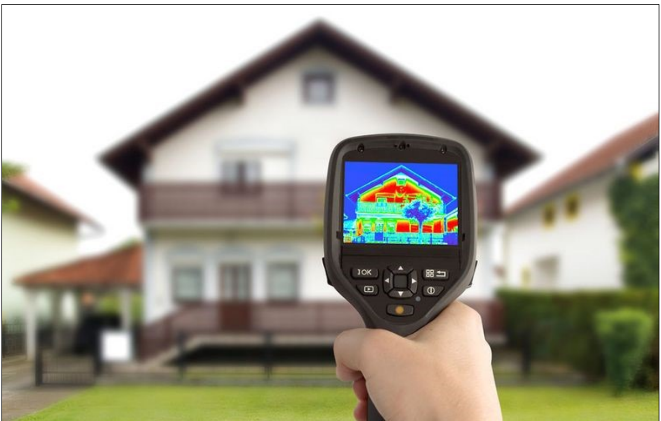
Termografisk måling af utætheder og varmetab.

Udlån af "energisparetaske" med måleudstyr såsom Spar-o-meter og infrarødt termometer. Supplerende aktiviteter for både børn og unge i de berørte boligforeninger.