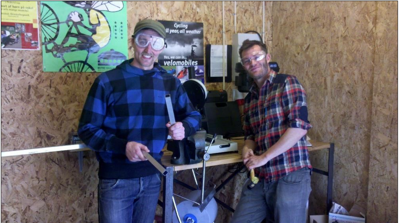
Cykelbibliotekets værksted er åben for både erfarne og nybegyndere.

Metode: Udvikling af nye medlemstilbud, hvor der sættes fokus på at inddrage lokalbefolkningen - gamle som unge - i at reparere og vedligeholde deres egne cykler. Tilbyde faste værkstedstider og specifikke workshops med fokus på forskellige former for vedligehold og reparation.