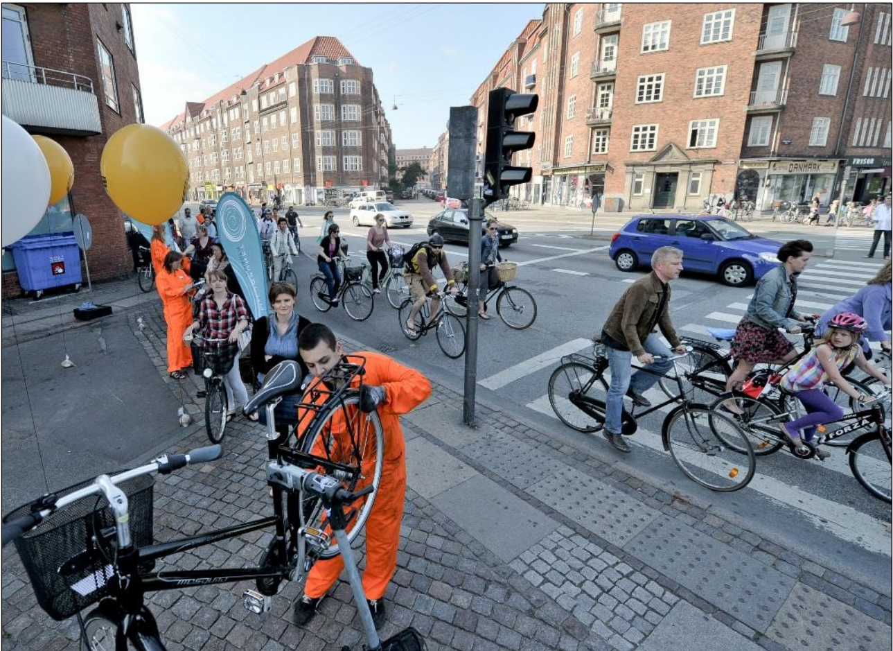
Cykelpitstop på Amagerbrogade – altid en oplevelse.

Der skal i 2017 afholde mindst to cykelpitstop på Amagerbrogade, hvor Miljøpunkt Amager takker lokale trafikanter for deres brug af cyklen til den daglige transport. Under cykelpitstoppet tilbydes cyklisterne gratis cykeltjek og en kop kaffe. Cykelpitstoppet er i øvrigt en enestående mulighed for direkte dialog med lokale borgere om de trafikale udfordringer i byen.