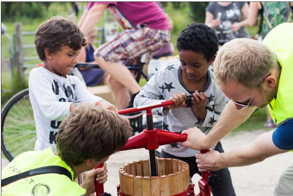
Mostworkshop på Amager i september 2016.

Metode: Indsats over hele året for at sætte fokus på det cirkulære forløb i at dyrke, bruge og i sidste ende kompostere lokale fødevarer. Brug af konkrete aktiviteter og sociale medier til at fremme brugen af lokale ressourcer samt opbygge et netværk omkring det.