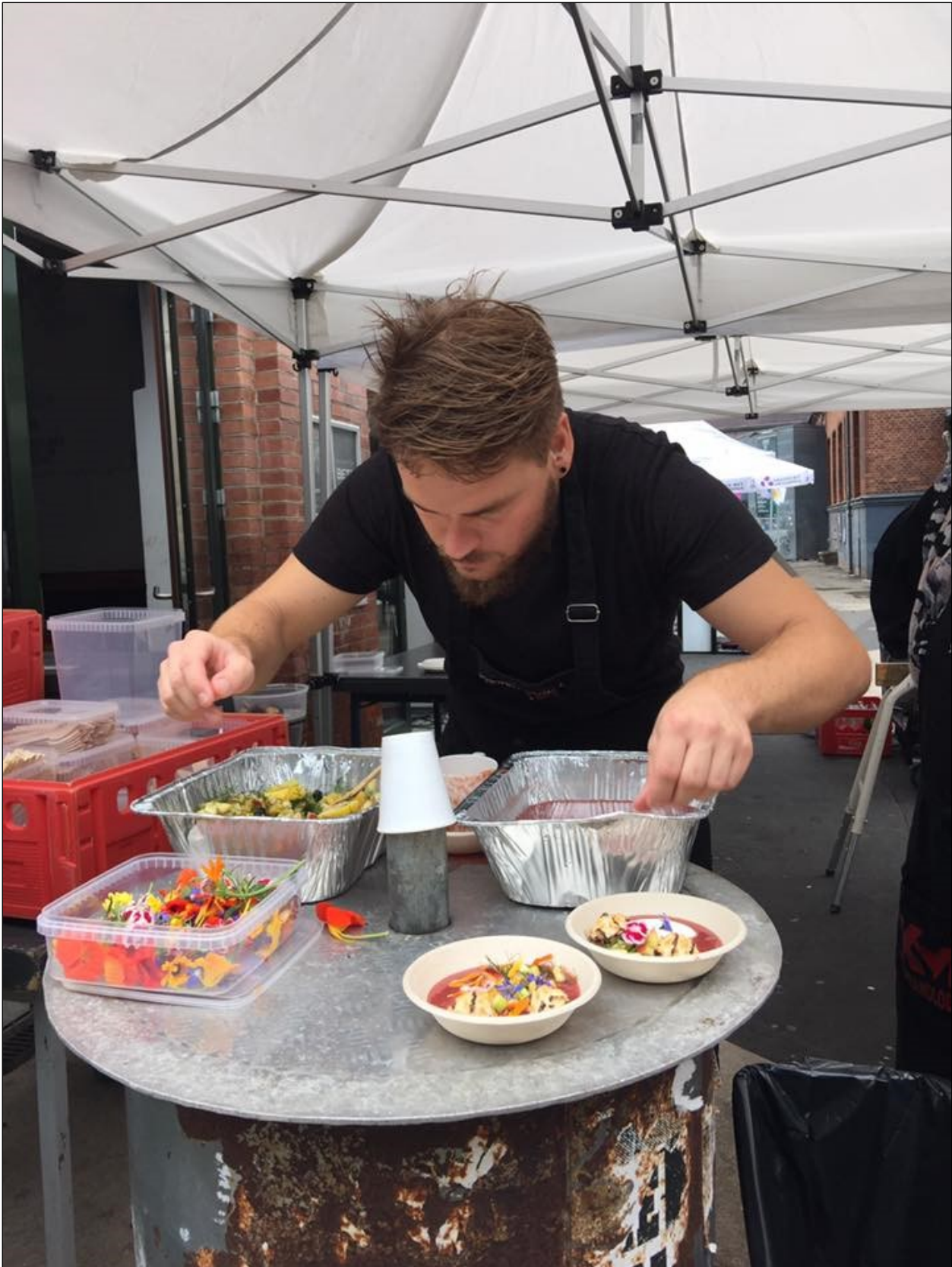
Street Food på Musiktorvet i august 2016 med overskudsmad fra Kvickly på Strandlodsvej.