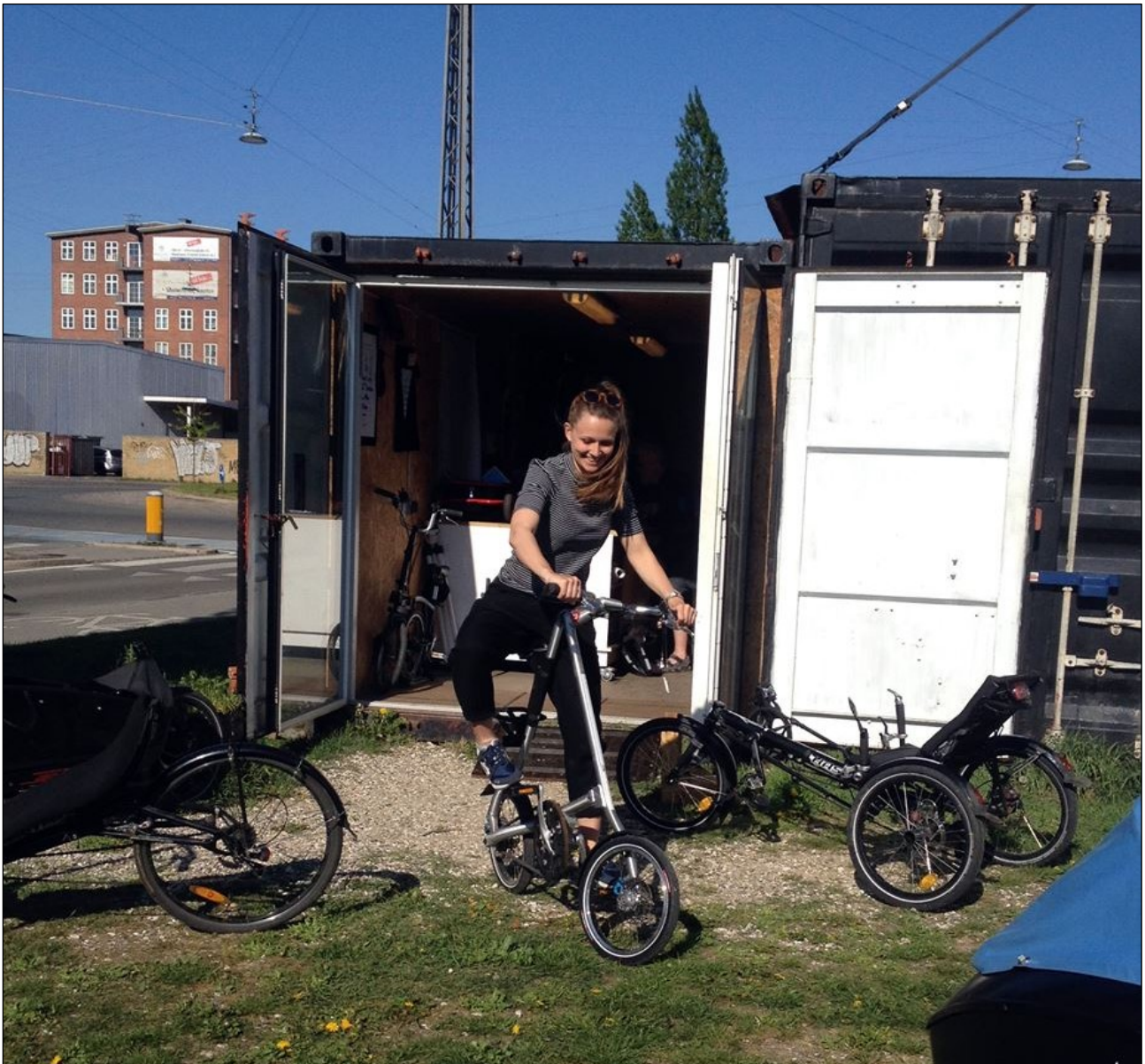
En foldecykel – hvordan gør man det? Cykelbiblioteket er åbent for alle borgere på Amager.

København har ca. 678.000 cykler, men der er langt fra lige så mange, der ved hvordan man holder dem vedlige. En dårligt vedligeholdet cykel er skidt at cykle på og det kan være en grund til at tage bilen i stedet for. Vi ønsker at fremme cyklismen på Amager, da det er gavnligt for miljøet og skaber et levende byrum hvor folk mødes. En vedligeholdet cykel holder længere og kan være med til at skabe mindre ressourcospild og færre efterladte cykler i gårde og gader.