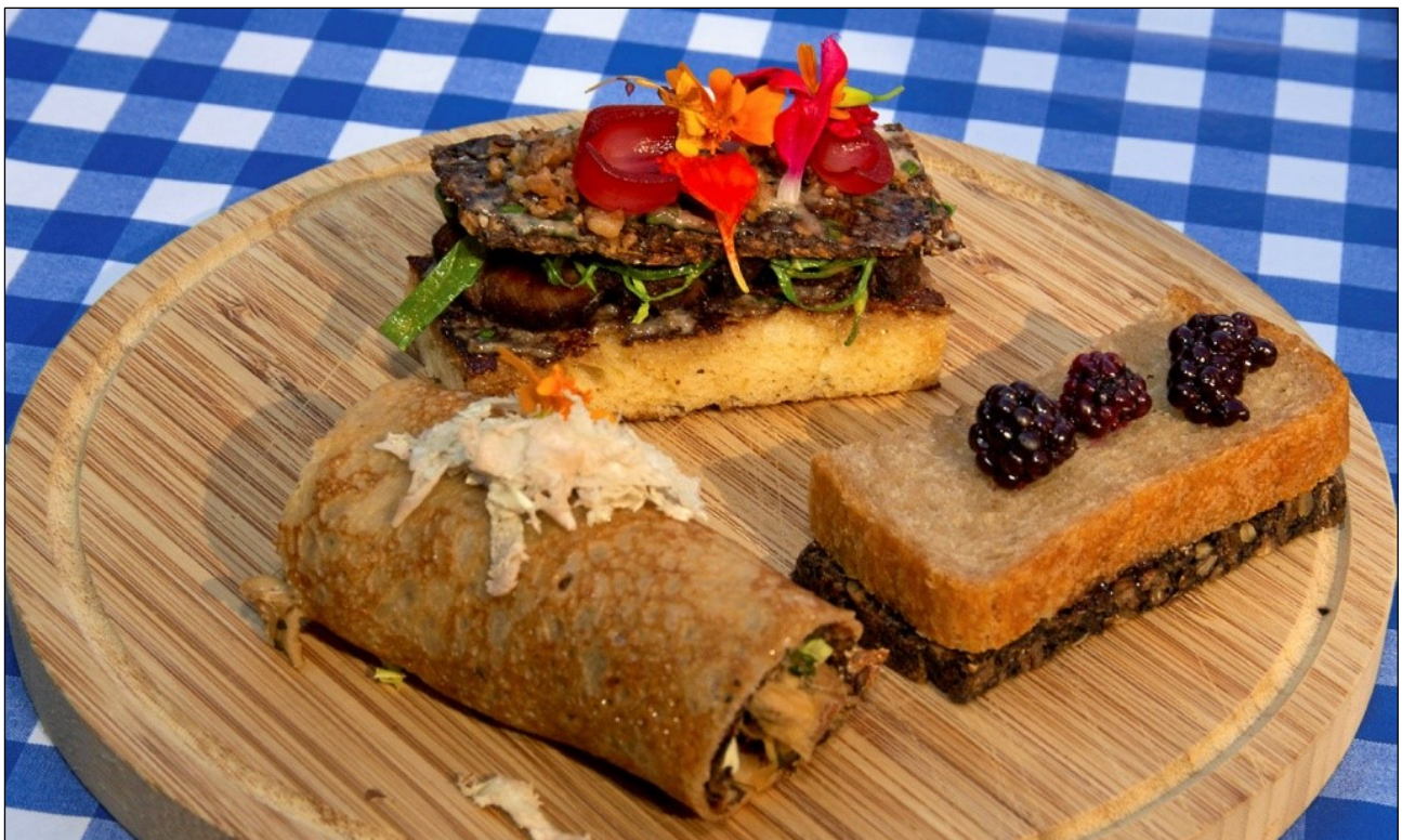
Den Ny (og bæredygtige) Amagermad – kåret på Musiktorvet i september 2016.

Miljøpunkt Amager ligger i Kvarterhuset på Jemtelandsgade. Miljøpunkt Amager har faste daglige åbningstider, hvor der er åbent for henvendelser og spørgsmål fra alle borgere på Amager. I Miljøpunkt Amager er der dagligt mulighed for gratis at låne ladcykler, elmålere og mostpresse samt at få gode råd og vejledning til, hvordan man kan spare på strømmen, sortere sit affald, holde pesticidfri have, købe miljøvenligt i dagligdagen og meget mere. Den daglige dialog og sparring med lokale samarbejdspartnere på Amager gør Miljøpunkt Amager til en særlig værdifuld og lokal ressource for miljøarbejdet, kulturlivet og borgerdrevne aktiviteter på Amager.