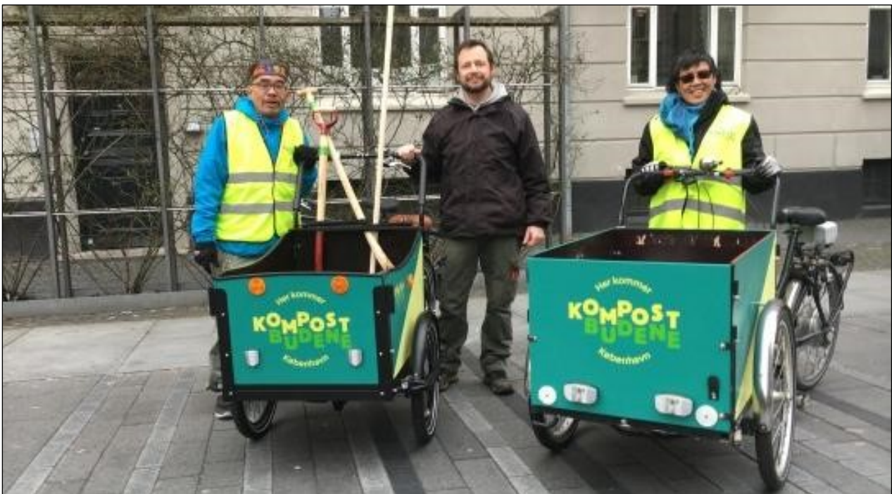
Miljøpunkt Amager samarbejder blandt andet med Kompostbudene om bedre ressourceanvendelse.

I fremtiden vil knapheden på ressourcer blive et konkurrencevilkår. De samfund der forstår at genanvende og genindvinde affaldsressourcerne vil stå stærkt i den globale konkurrence. Forudsætningen herfor er en renere affaldshåndtering, hvor affaldets ressourcer kan indgå i et produktions- og forbrugskredsløb med meget lidt spild – det er cirkulær økonomi.