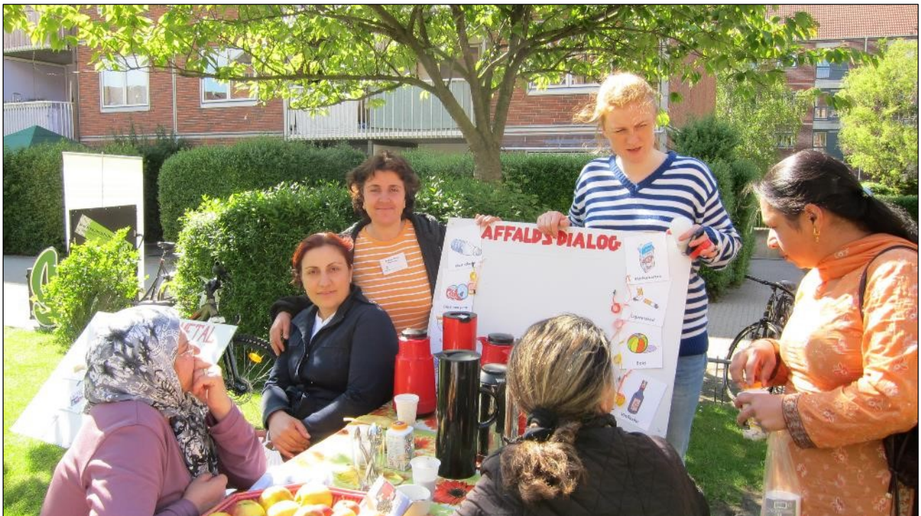
Miljøformidling til beboerne på Tingvej.

Fælles er også at målgruppen har begrænset adgang til landsdækkende kampagner og information om miljøproblemerne og dermed mangler viden om hvordan de kan blive en del af løsningen.