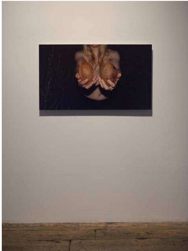
Barbara Amalie Skovmand Thomsen: The World Is Vibrating (installation view), New Shelter Plan, 2014.