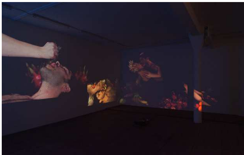
Barbara Amalie Skovmand Thomsen: The World Is Vibrating (installation view), New Shelter Plan, 2014.