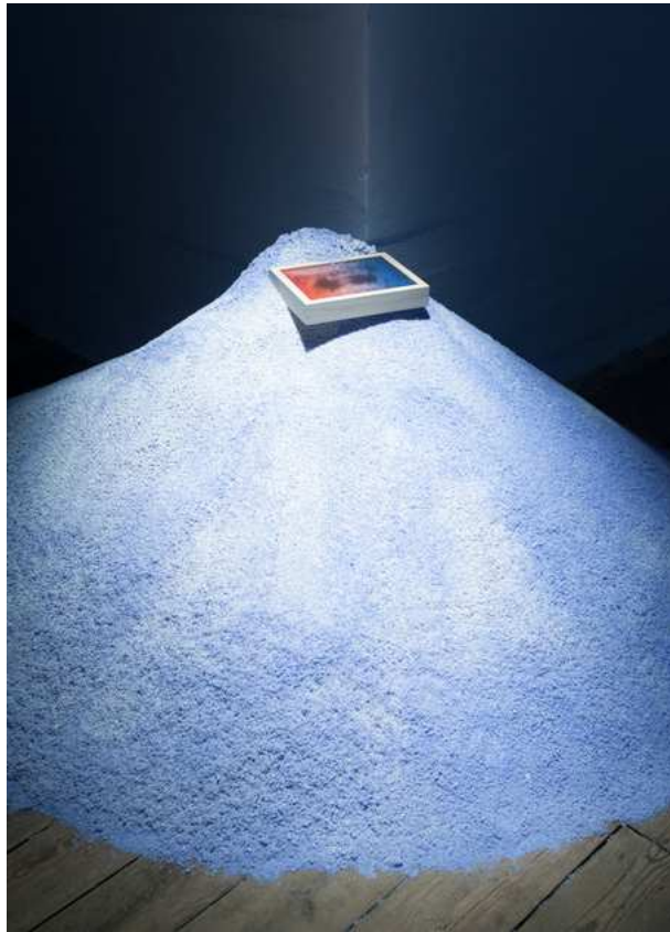
Barbara Amalie Skovmand Thomsen: The World Is Vibrating (installation view), New Shelter Plan, 2014.