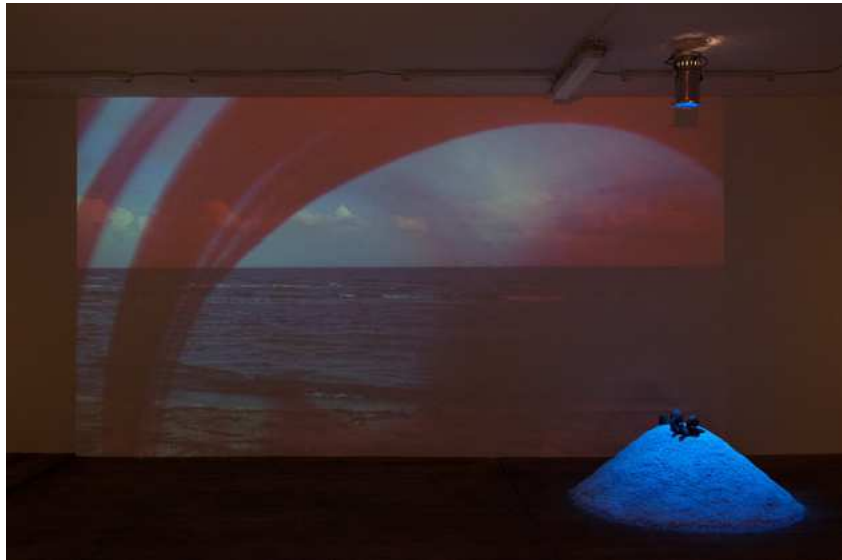
Barbara Amalie Skovmand Thomsen: The World Is Vibrating (installation view), New Shelter Plan, 2014.