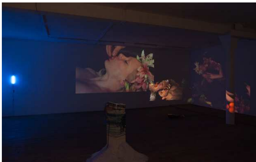
Barbara Amalie Skovmand Thomsen: The World Is Vibrating (installation view), New Shelter Plan, 2014.