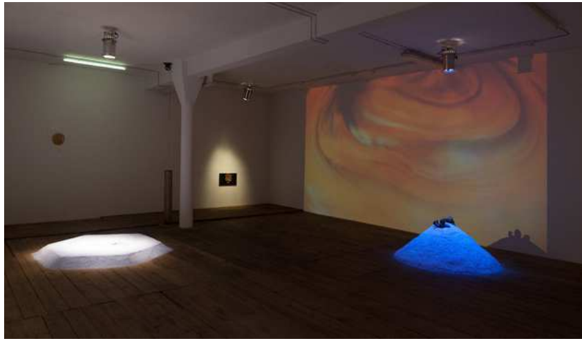
Barbara Amalie Skovmand Thomsen: The World Is Vibrating (installation view), New Shelter Plan, 2014.