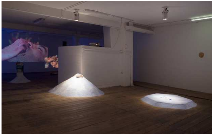
Barbara Amalie Skovmand Thomsen: The World Is Vibrating (installation view), New Shelter Plan, 2014.