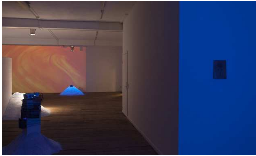
Barbara Amalie Skovmand Thomsen: The World Is Vibrating (installation view), New Shelter Plan, 2014.