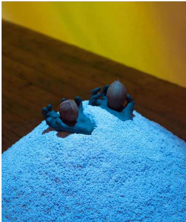
Barbara Amalie Skovmand Thomsen: The World Is Vibrating (installation view), New Shelter Plan, 2014.