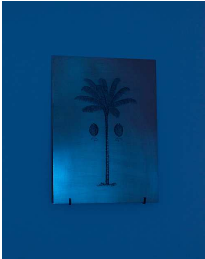
Barbara Amalie Skovmand Thomsen: The World Is Vibrating (installation view), New Shelter Plan, 2014.