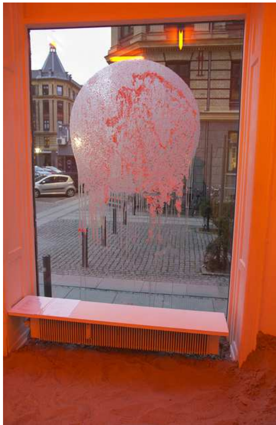
Barbara Amalie Skovmand Thomsen: Soleffekten II, 2016. Installation views.