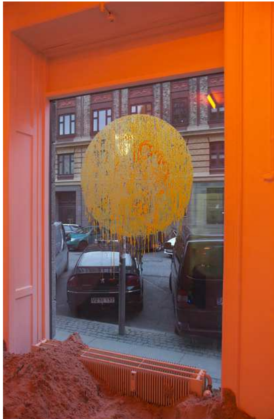
Barbara Amalie Skovmand Thomsen: Soleffekten II, 2016. Installation views. Foto: Barbara Amalie Skovmand Thomsen.