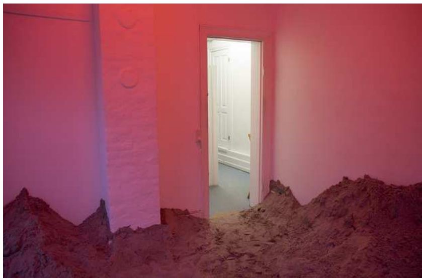
Barbara Amalie Skovmand Thomsen: Soleffekten II, 2016. Installation views.