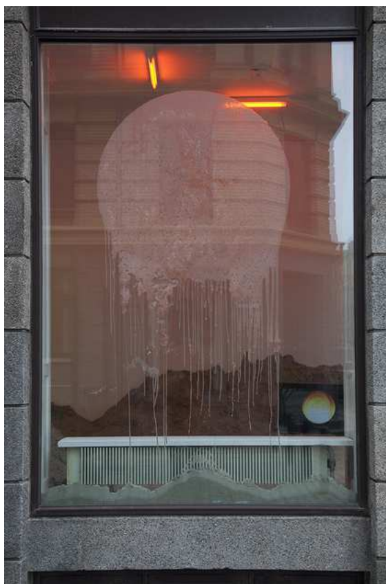
Barbara Amalie Skovmand Thomsen: Soleffekten II, 2016. Installation views.