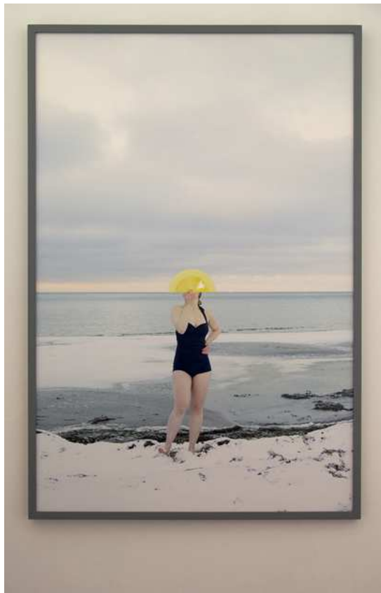
Barbara Amalie Skovmand Thomsen: Soleffekten II, 2016. Installation views.