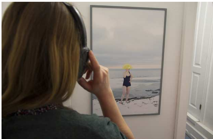
Barbara Amalie Skovmand Thomsen: Soleffekten II, 2016. Installation views.