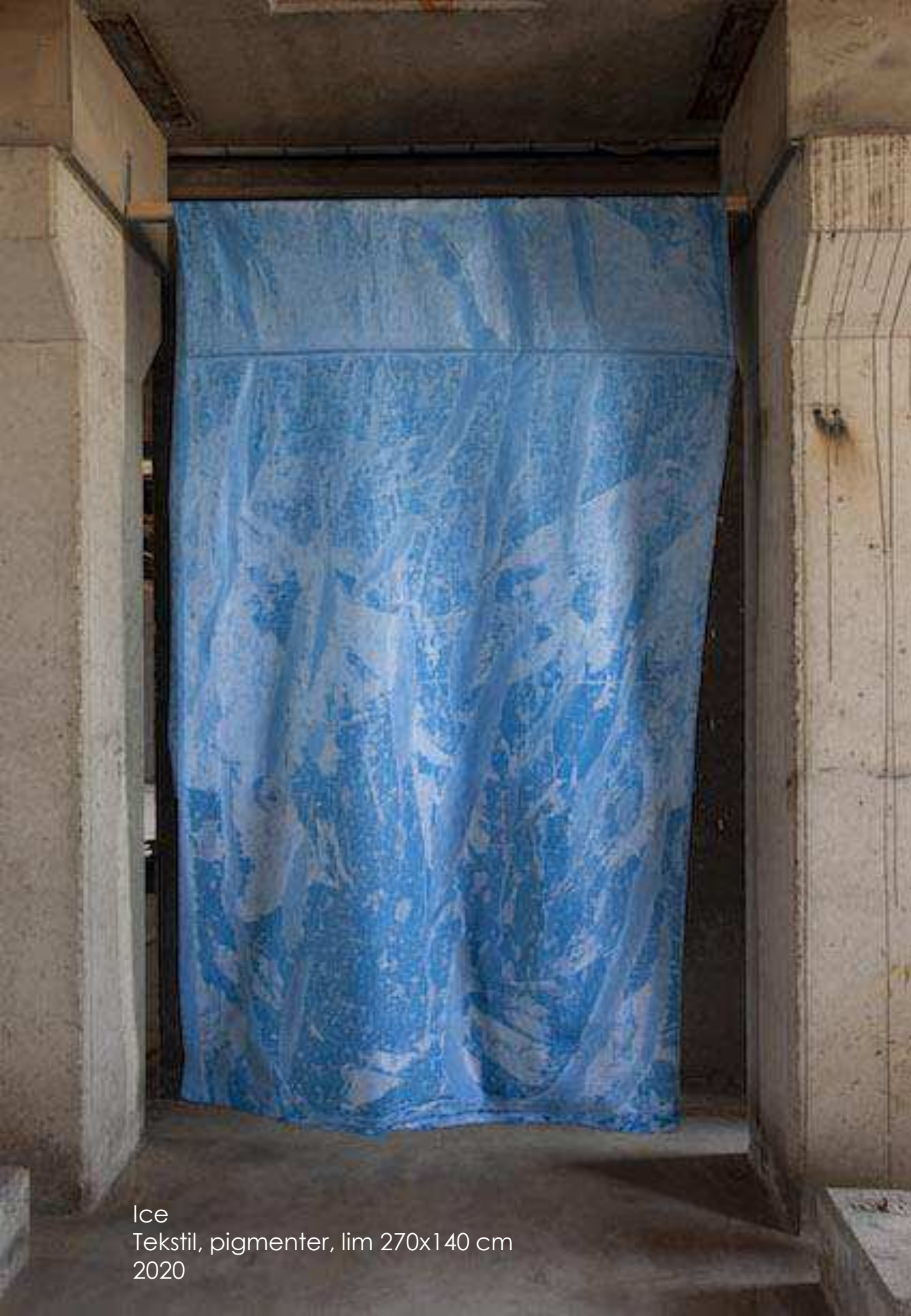
Ice Tekstil, pigmenter, lim 270x140 cm 2020