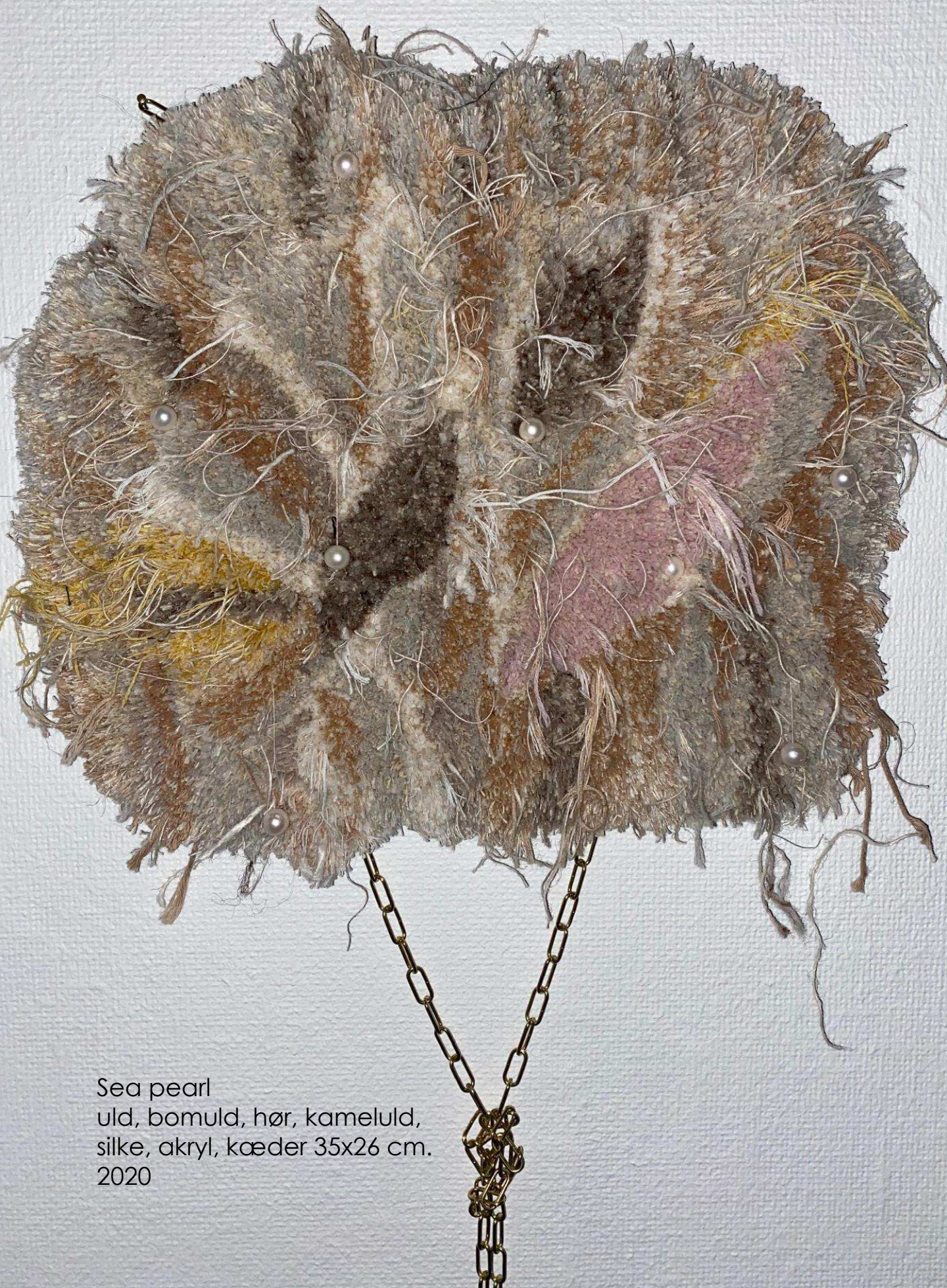
Sea pearl uld, bomuld, hør, kameluld, silke, akryl, kæder 35x26 cm. 2020