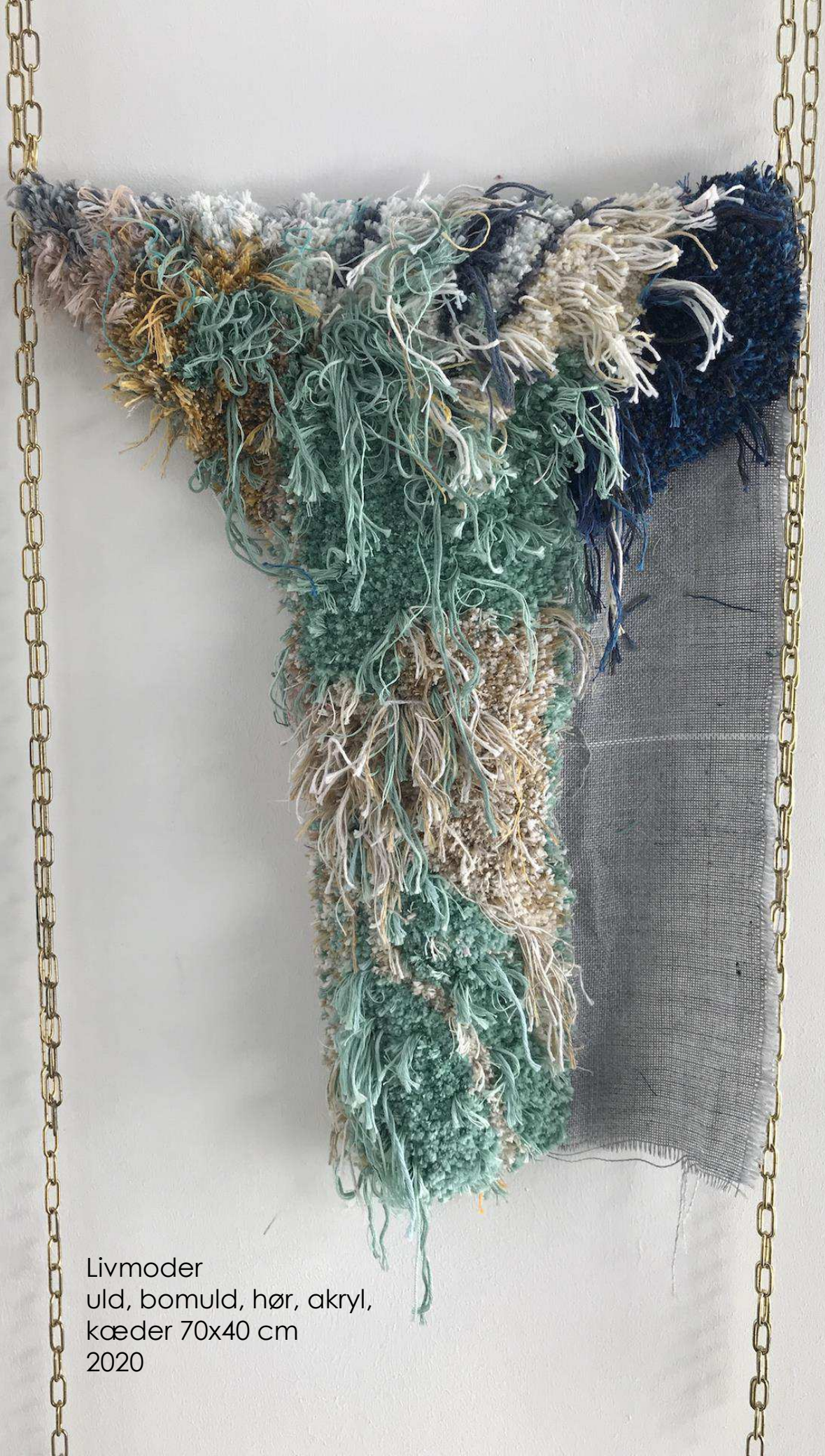
Livmoder uld, bomuld, hør, akryl, kæder 70x40 cm 2020