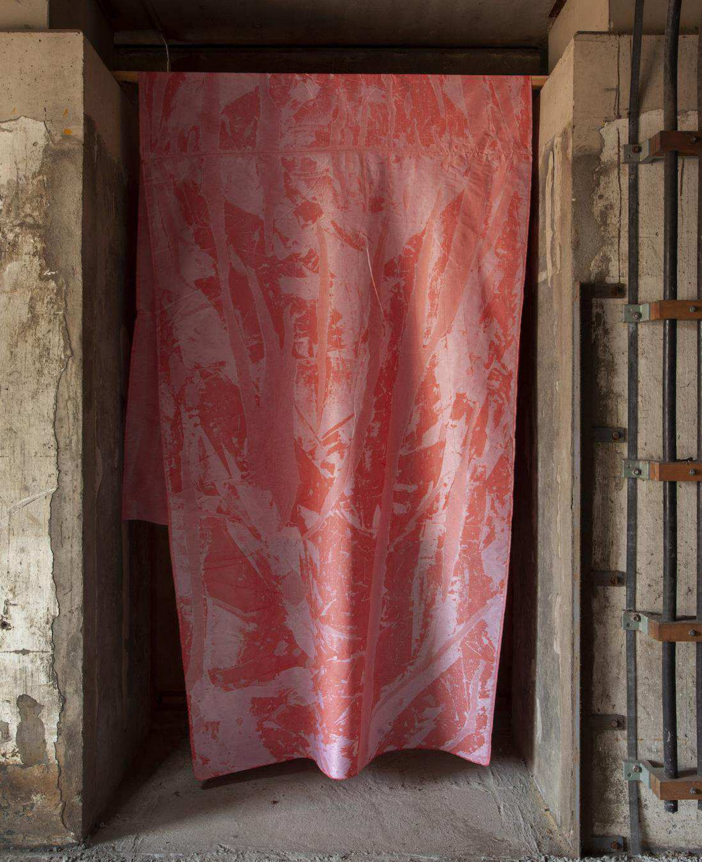
Tide Tekstil, pigmenter, lim 270x140 cm 2020