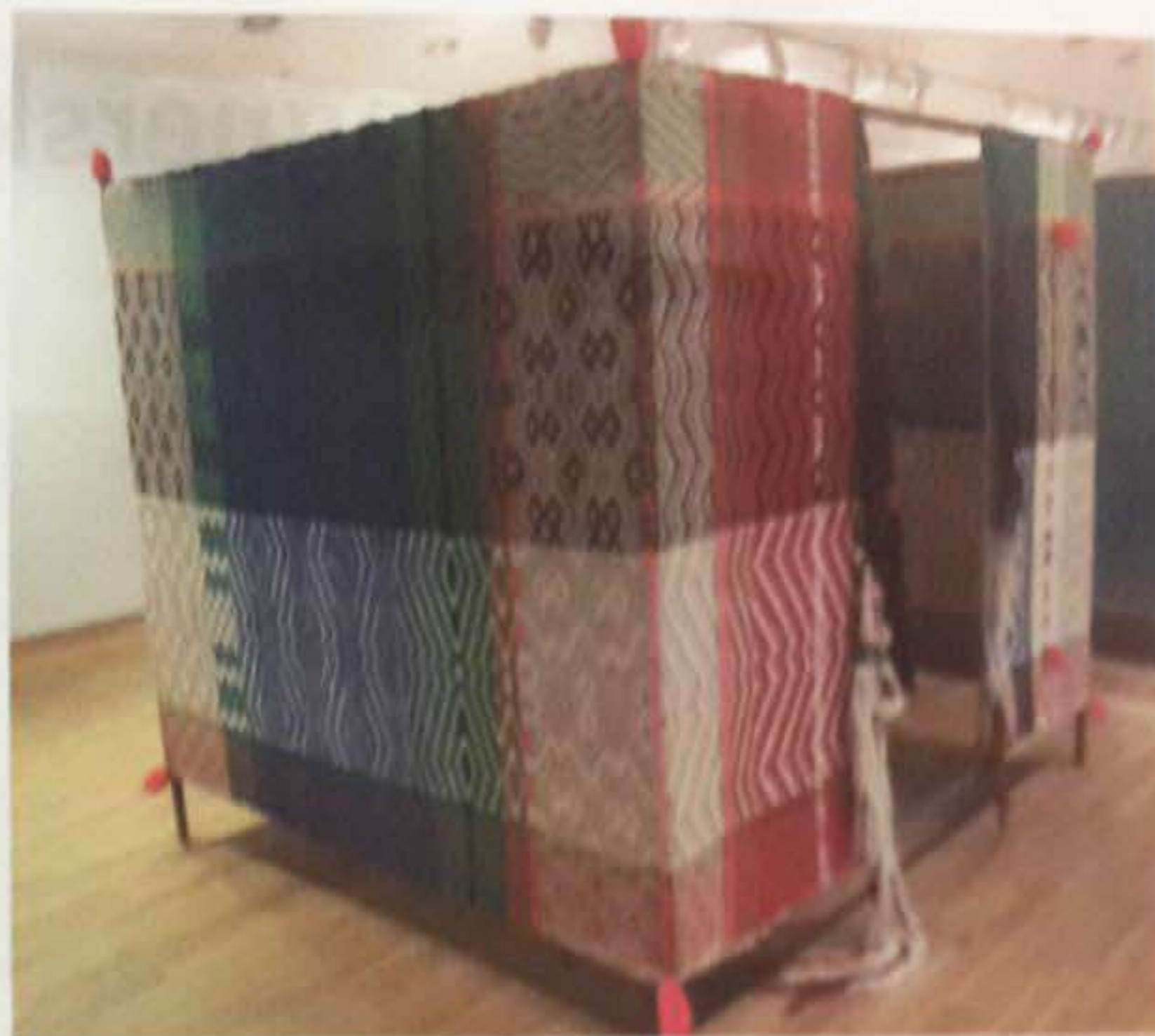
Ragna Braase. Afrikans hus

Kastrupgaardssamlingen Kastrupvej 299, Kastrup Fra til 27. maj