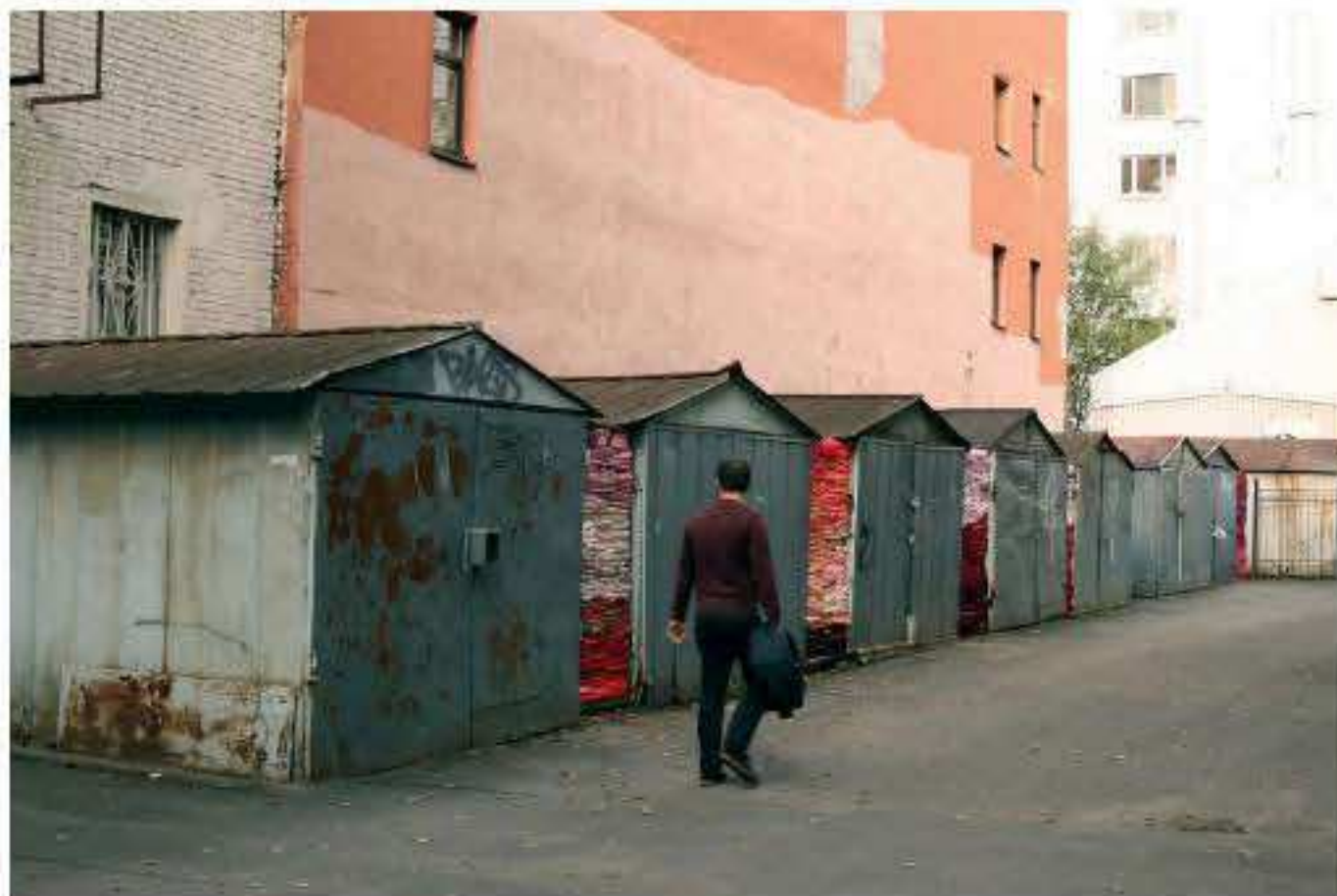
Charlotte Thrane, I Love you: Eight Gaps, site-specific installation for the 6th Art Prospect Festival, Russia, 2018 Materials: Used clothing sourced locally and stuffed in gaps between sheds Dimensions: Eight parts, each part between H 2.1m x W 0.2-1.2m