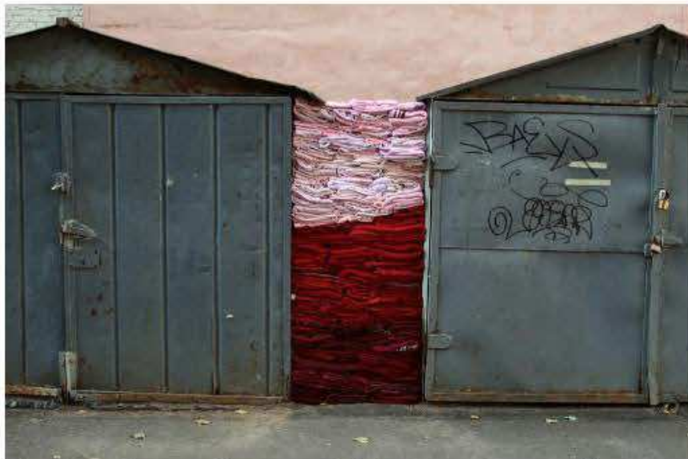
Charlotte Thrane, I Love you: Eight Gaps, site-specific installation for the 6th Art Prospect Festival, Russia, 2018 Materials: Used clothing sourced locally and stuffed in gaps between sheds Dimensions: Eight parts, each part between H 2.1m x W 0.2-1.2m