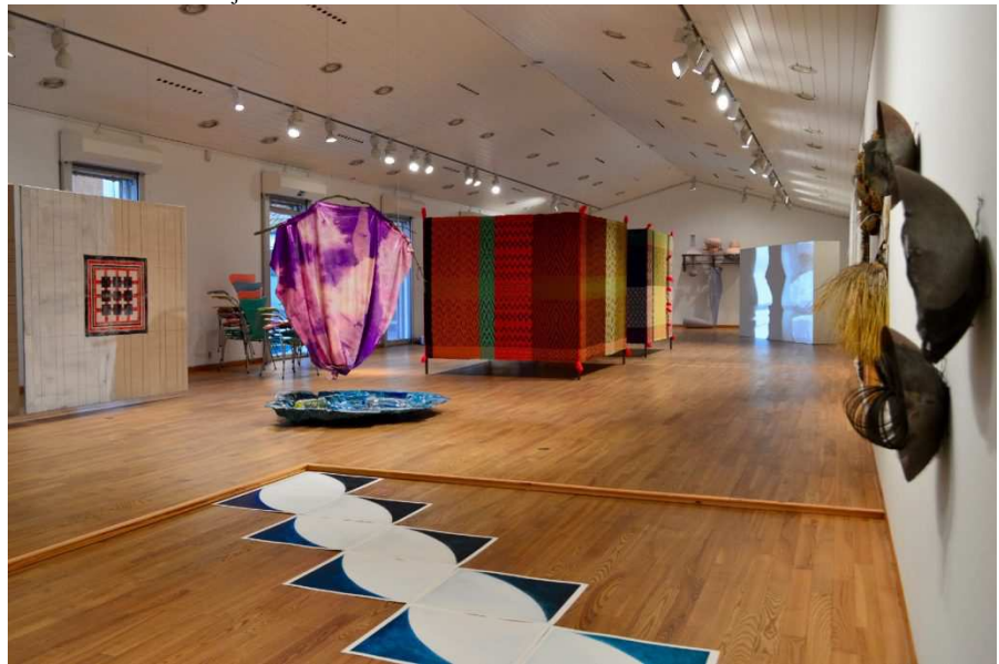
Villa til Ragna og Franka, installationsview.

Mette Winckelmann viser en maleriinstallation, fordelt på to rum. Værkerne er sat op som stof på blændramme, altså det vi rubricerer som et maleri, men de er i langt højere grad strukturelle undersøgelser og fysiske indgreb i rummet, end de er egentlige malerier. Hun er gået helt tæt på Braases vævning i sine diagrammatiske abstraktioner over den måde trådene i vævet griber ind i hinanden på.