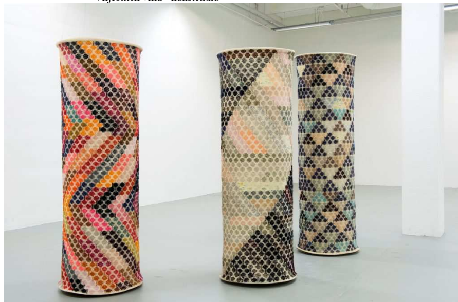
Ragna Brasse: Søjlerne fra Uruk , ca. 1985.

Det næste rum er det sværeste, langt og smalt, men her får Franka Rasmussens værker plads på væggene. Særligt interessante synes jeg de to papirværker er, som jeg ikke ved om hun egentlig har tænkt som skitser til større installationer, hvor hun arbejder grafisk klart og med papiret som et tredimensionalt materiale, der synes at sprænge sit eget format med en voldsom dynamik, som jeg ikke helt genfinder i hendes fysiske relieffer, hvor det i højere grad virker som om det er mødet mellem materialernes karakterer, der har drevet hende.