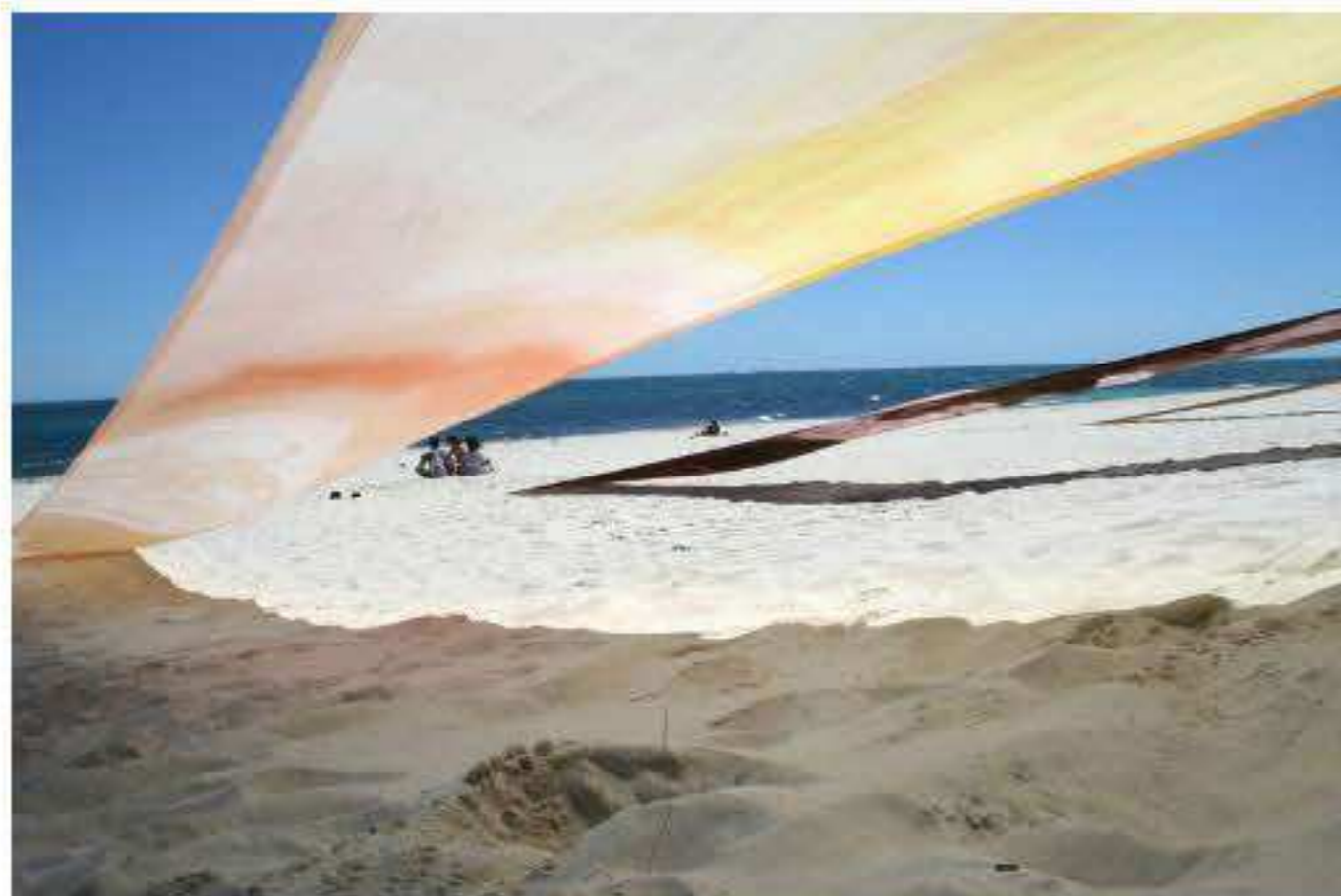
Charlotte Thrane, Sun Strips, site-specific work for Sculpture by the Sea, Australia, 2016 Materials: Rope, steel tubes and swimsuit material exposed to bleach, dye, daylight lamps, self-tanning lotion, and sunbeds in Denmark, and sunlight, sand and wind in Australia. Dimensions: Three lengths, each H 18m x W 2.4m

Dimensions: Three lengths, each length H 18m x W 2.4m