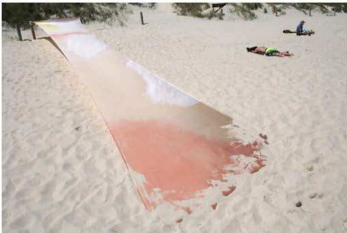
Charlotte Thrane, Sun Strips, site-specific work for Sculpture by the Sea, Australia, 2016 Materials: Rope, steel tubes and swimsuit material exposed to bleach, dye, daylight lamps, self-tanning lotion, and sunbeds in Denmark, and sunlight, sand and wind in Australia. Dimensions: Three lengths, each length H 18m x W 2.4m