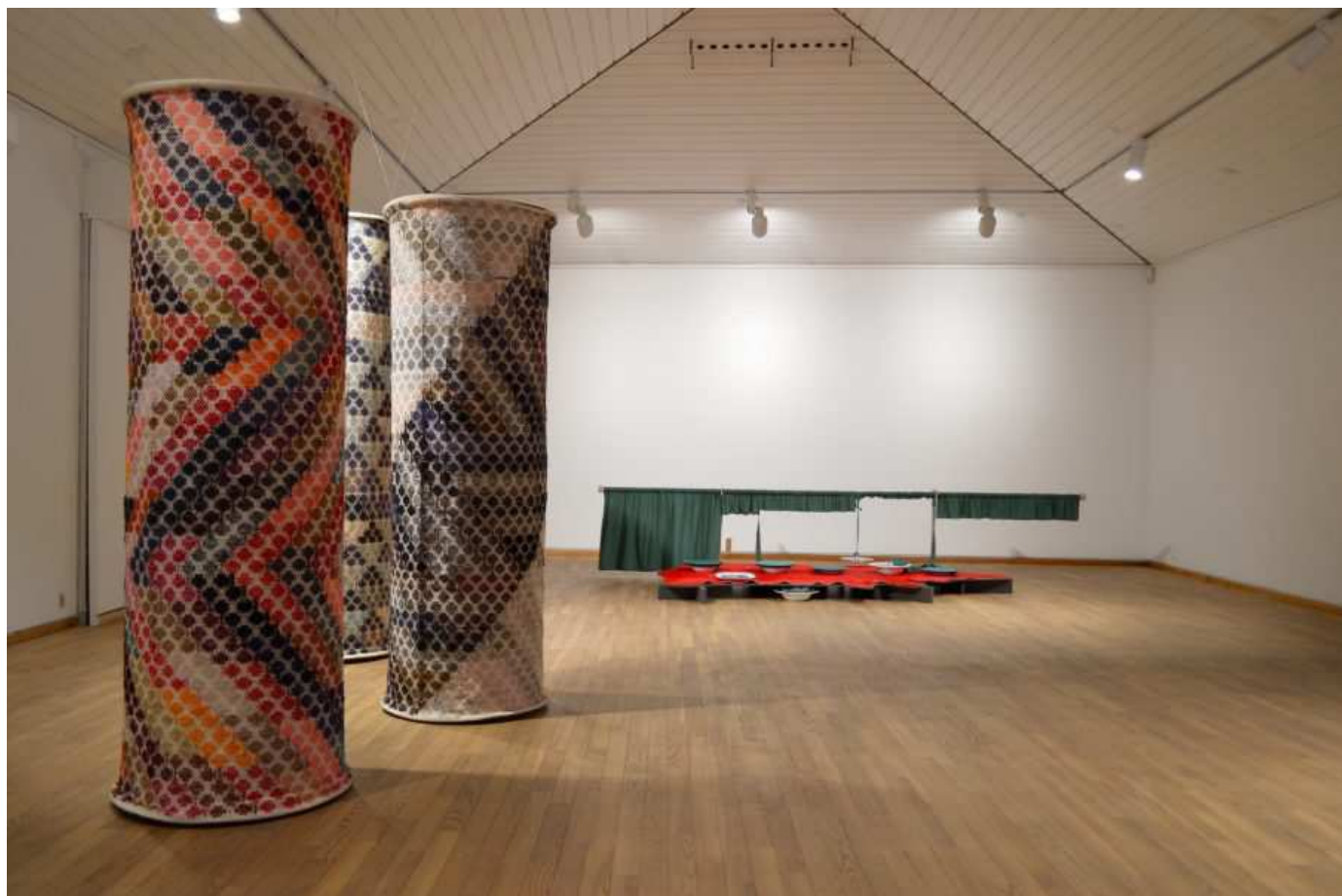
Villa til Ragna og Franka, installationsview.

På Kastrupgårdasmlingen tages traditionens tråde op af flere generationer på en energifyldt udstilling kurateret af de to kunstnere Torgny Wilcke og Charlotte Thrane.