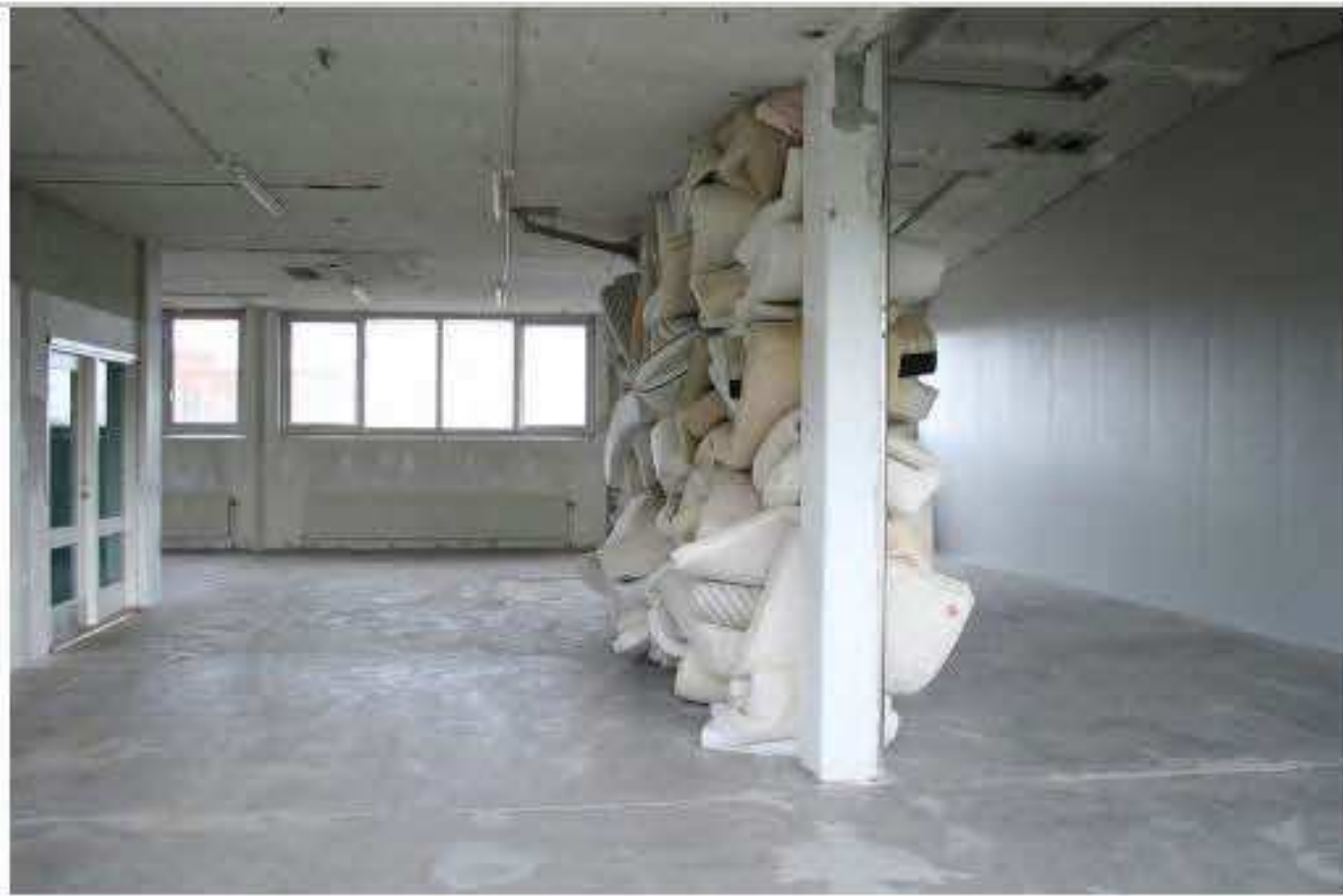
Charlotte Thrane, Big Body, site-specific installation for KH7 Artspace, DK, 2019 Materials: Used mattresses and cushions sourced locally and stuffed in a space between two pillars, the floor and ceiling Dimensions: H 3.2m x W 4.7m x D 1.4m