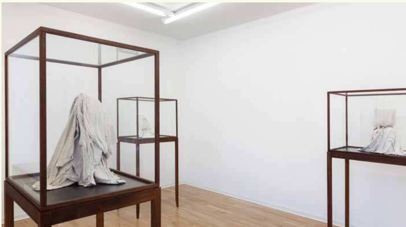
Valérie Collart: Enigme 1, Enigme 2 og Enigme 3, 2017. Gips, stof og forskellige materialer. Montrer i kastanje og laminat.