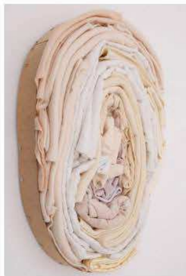
Charlotte Thrane, Untitled (relief), 2019 Materials: Used, folded clothing and wood Dimensions: H 37cm x W 57cm x D 8cm