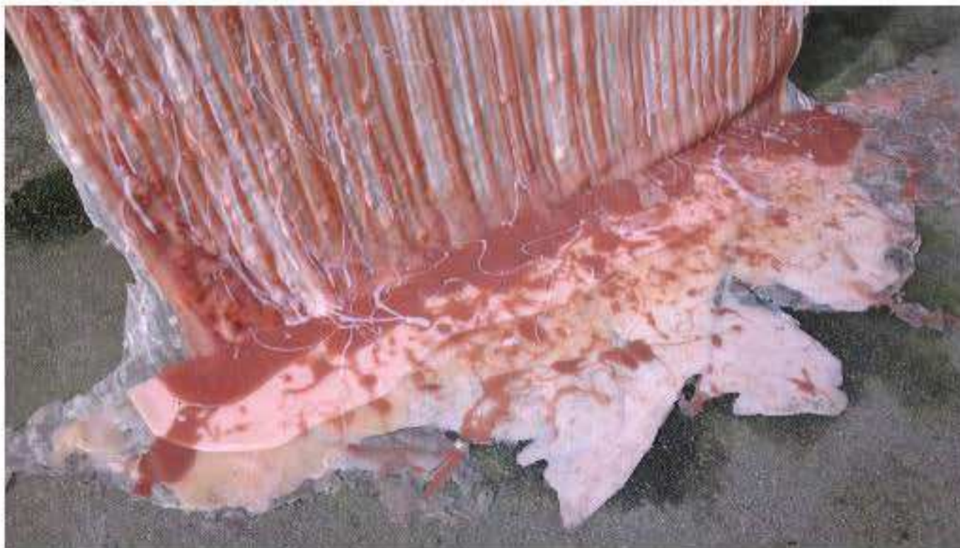
Charlotte Thrane, Tung i sproget, site-specific installation for the exhibition ENGROS at the old greengrocers market, DK, 2017 Materials: Pigmented silicone poured from roofs Dimensions: Two parts, each part H 6m x W 2m x D 1.4m