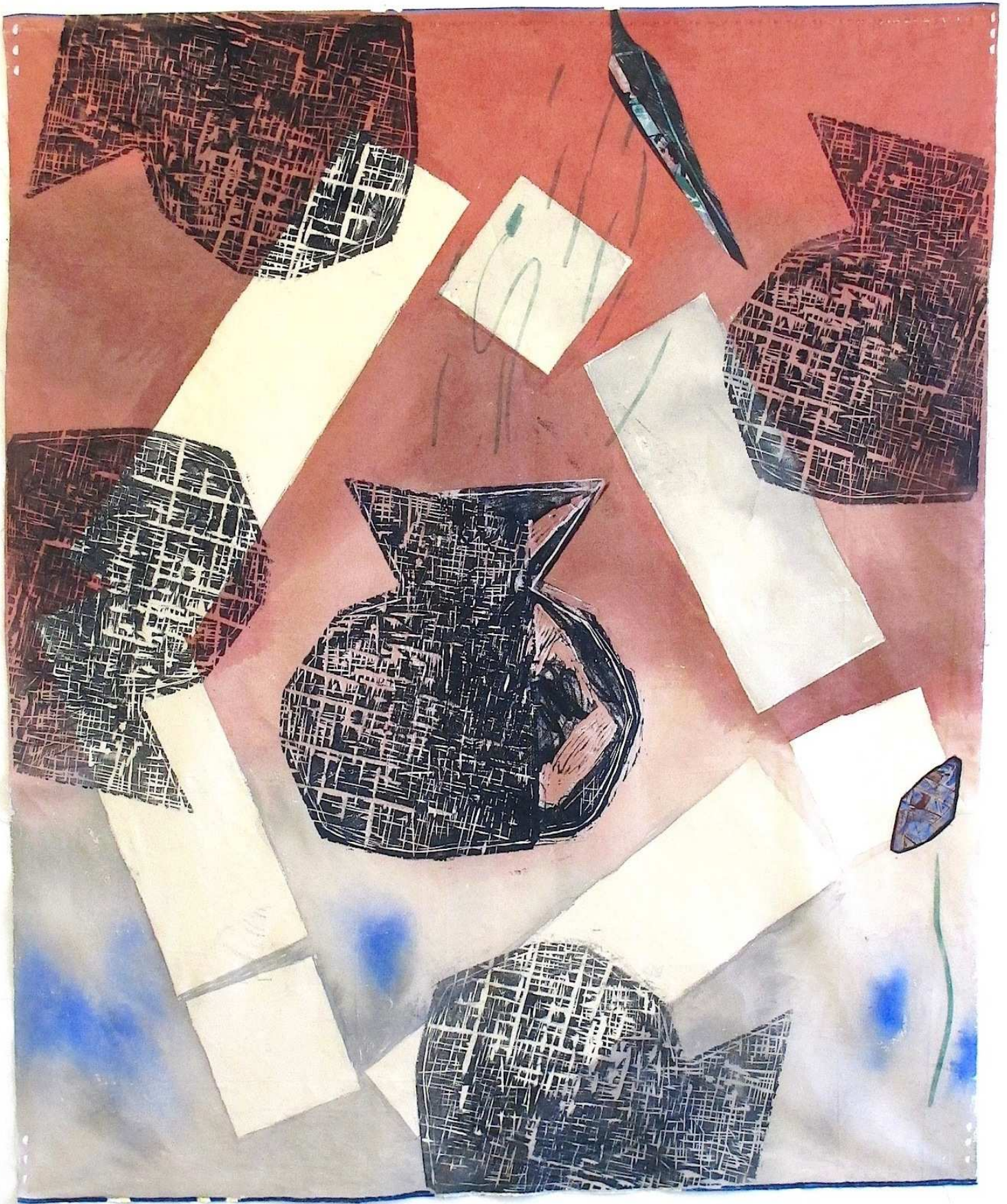
The Scattering Contains , 113 x 137 cm, farvetræsnet, gouache & collage på stout, 2020