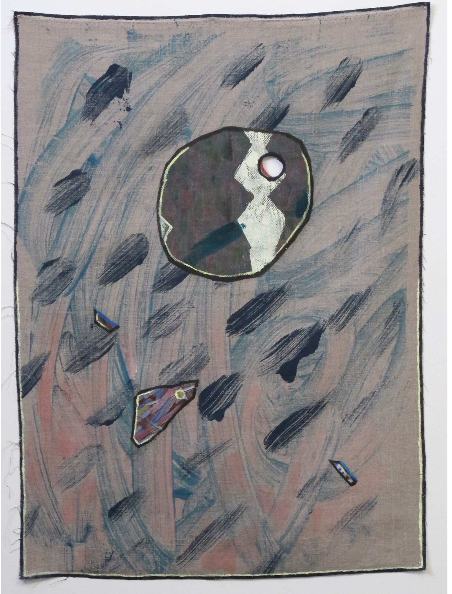
Loom weight , 2018, akryl og akvarel på russisk hør, 40 x 55 cm