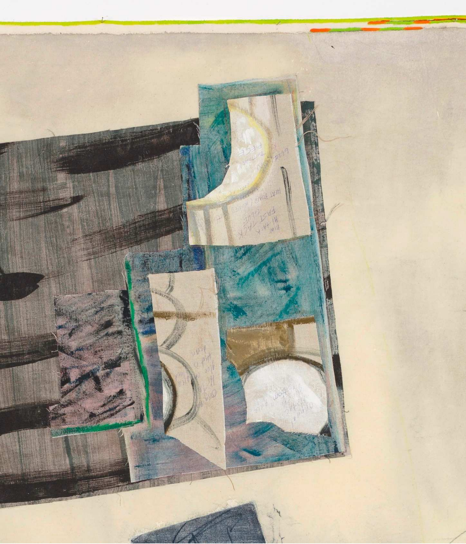
Maybe as usual they're walking while it gets ready to cloud up, akryl, gouache, træsnit, sprittusch & hørlærred på lærred, 2019, detalje