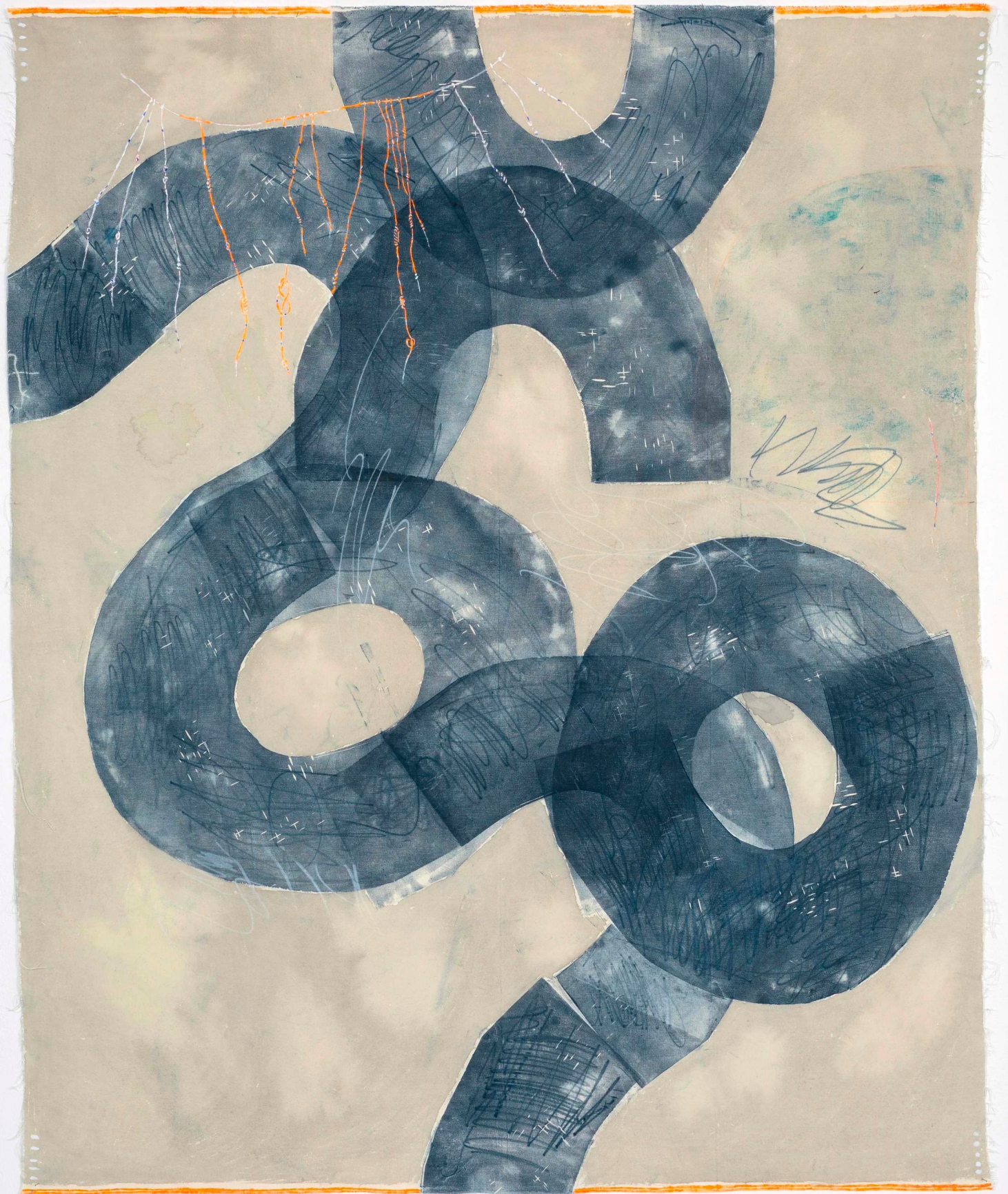
The rain of alphabets, akryl, gouache & træsnit på lærred, 2019, 130 x 160 cm