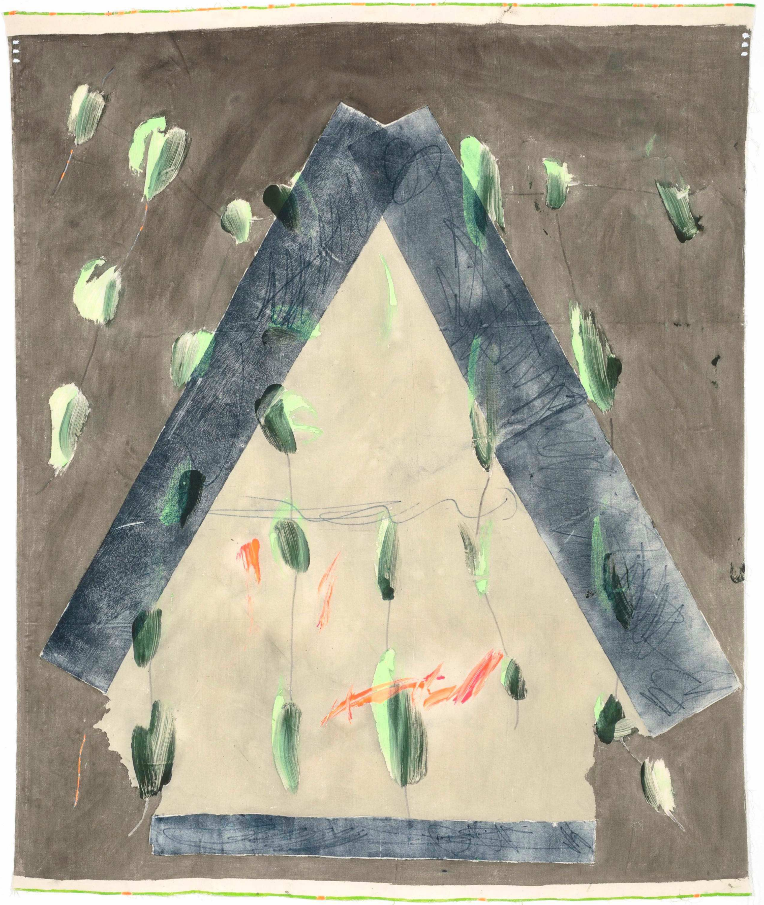
Apricot trees exist , akryl, gouache & farvetræsnit på lærred, 2019, 127cm w x 156cm h