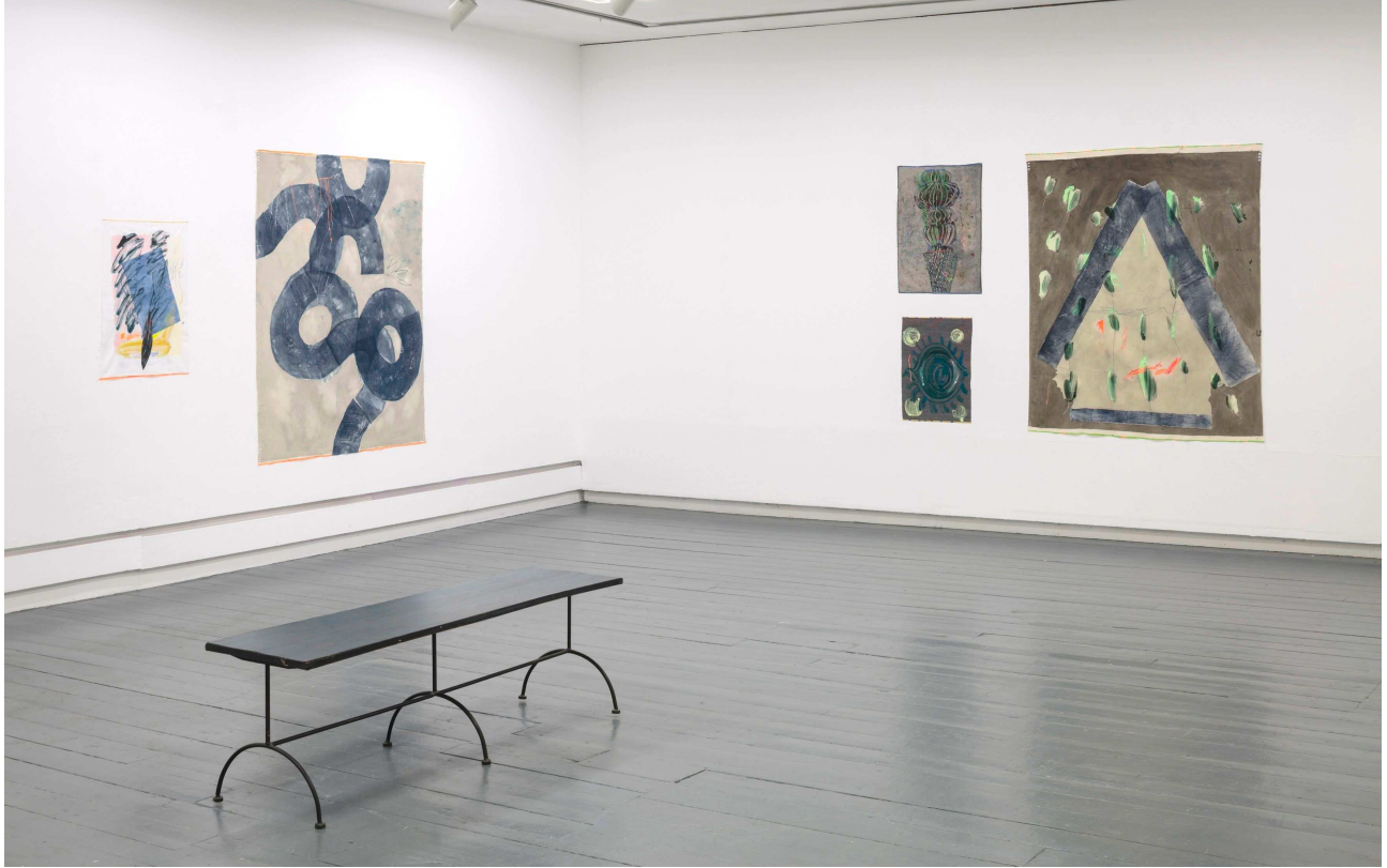
Install view, solo udstilling, Intermedia Gallery, Centre of Contemporary Art (CCA) Glasgow, Februar 2019