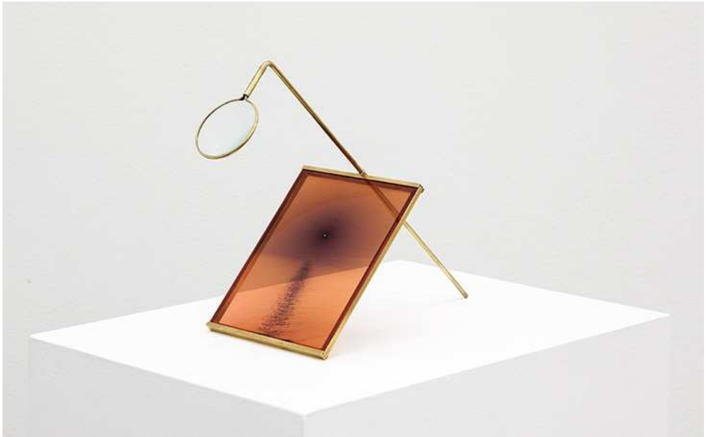
Juuso Noronkoski, Device No:1 (The Madness of the Day) , Sunlight focused on exposed negative, magnifying glass, brass. Gallery Taik Persons, 2018.