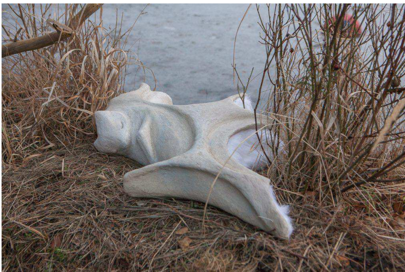
Militza Monteverde – Crawl 2019

Værket er udstillet til udstillings konceptet Uttran