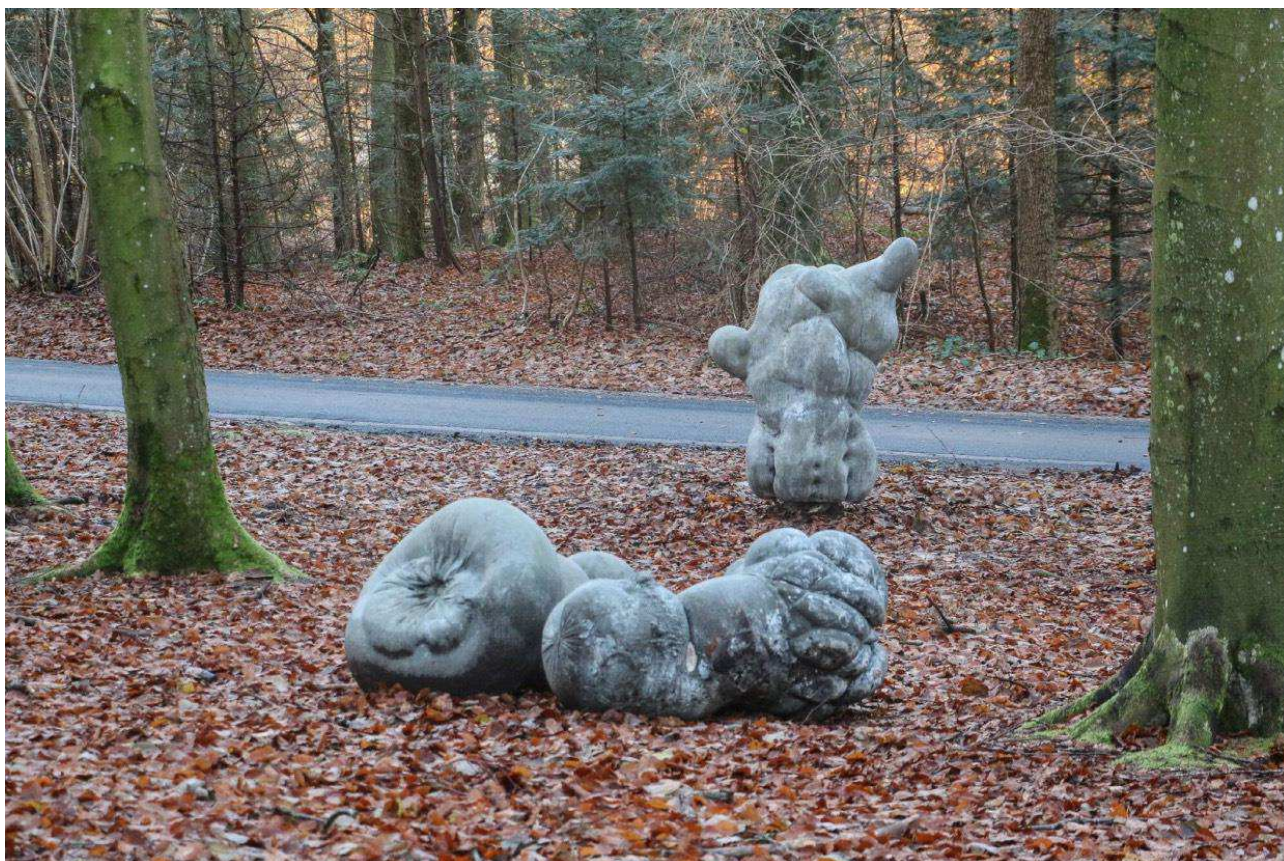
Ida Hy - "Fra lycra til beton - en bondage af kroppen" 2017 Værket er udstillet i 'Skovsnoeen - Deep Forest Art Land'