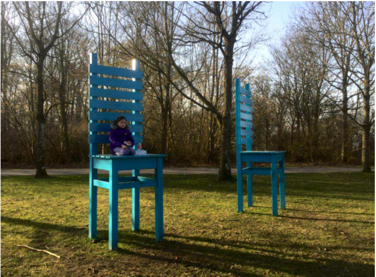
Mimwah – Stole Værket er udstillet på Skulpturparken på Hollufgård

For mere info kan Skulpturparken's hjemmeside læses: https://gah.dk/artparken/