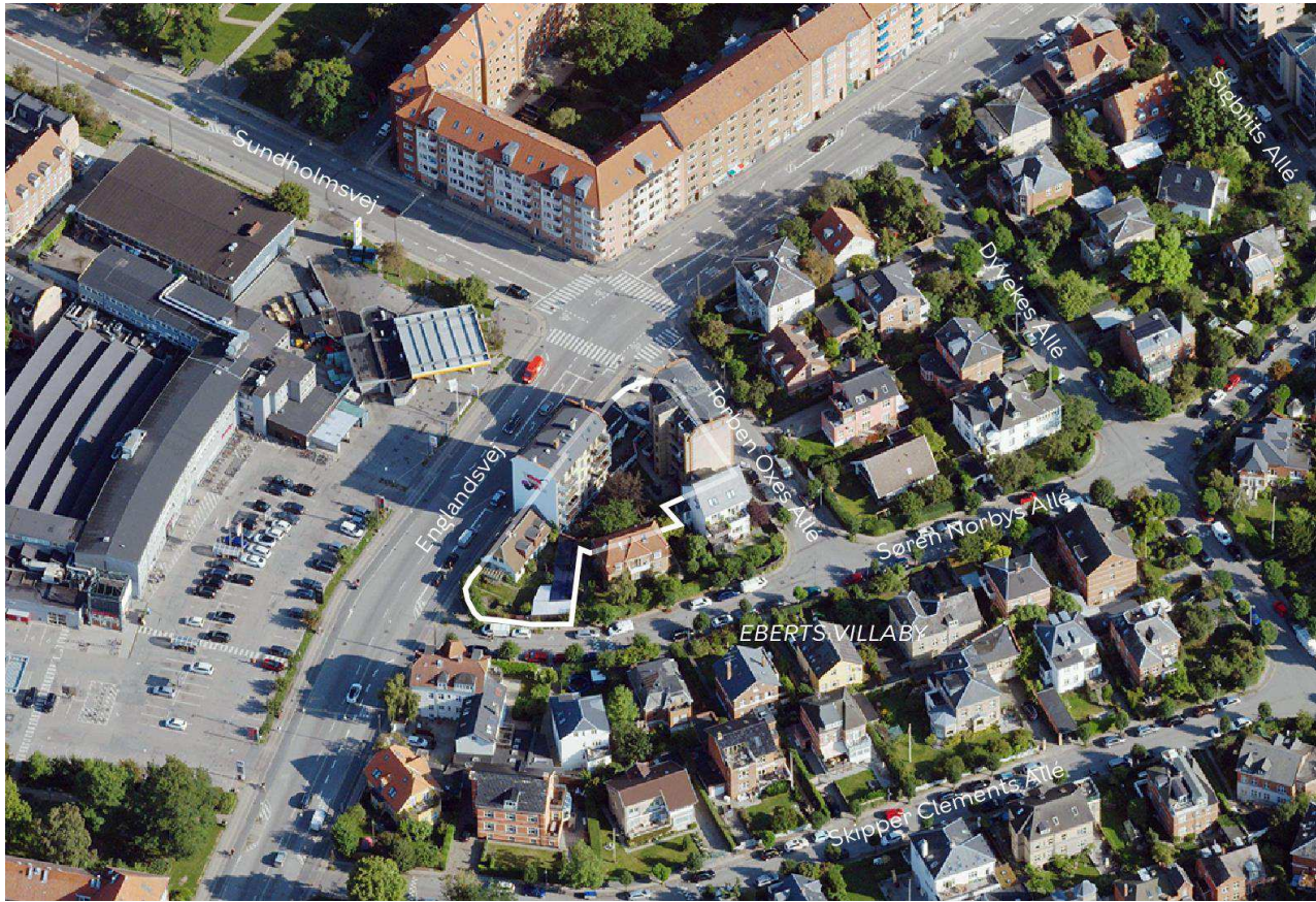
Området set mod nord. Lokalplanområdet er indtegnet med hvid linje, og de vigtigste gader er navngivet.