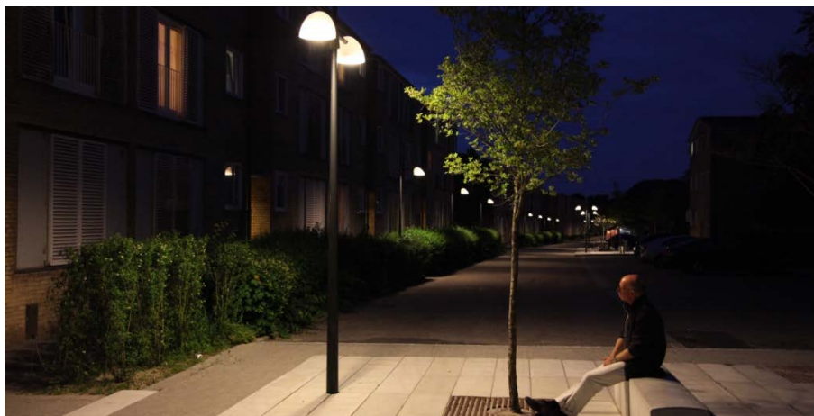
Illustration: Bjarne Schläger Design