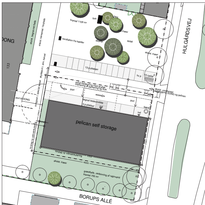
Ud over et opholdsareal skaber pladsen afstand til naboerne

Generelt er det vigtigt, at arkitekturen understøtter de mange tiltag, der er foretaget for at tilføre stedet et løft, med kvalitet i de arkitektoniske løsninger og identitet, samt fokus på kvaliteten af de ubebyggede områder. Byggeriet er i overensstemmelse med Københavns Kommunes ønske om miljørigtig byggeri. Mere specifikt vil der i det videre arbejde blive fokuseret