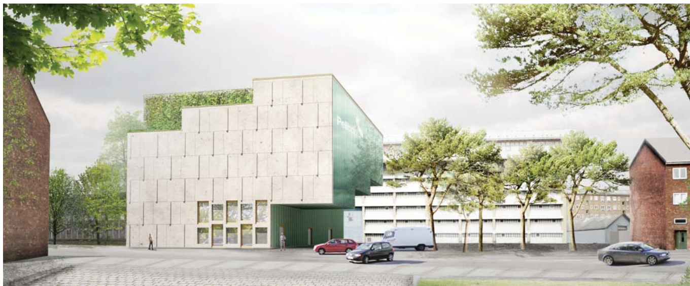
Aktuelt forslag. Materialerne og udformningen af facaden henter inspiration fra Bellahøj Koblingstation