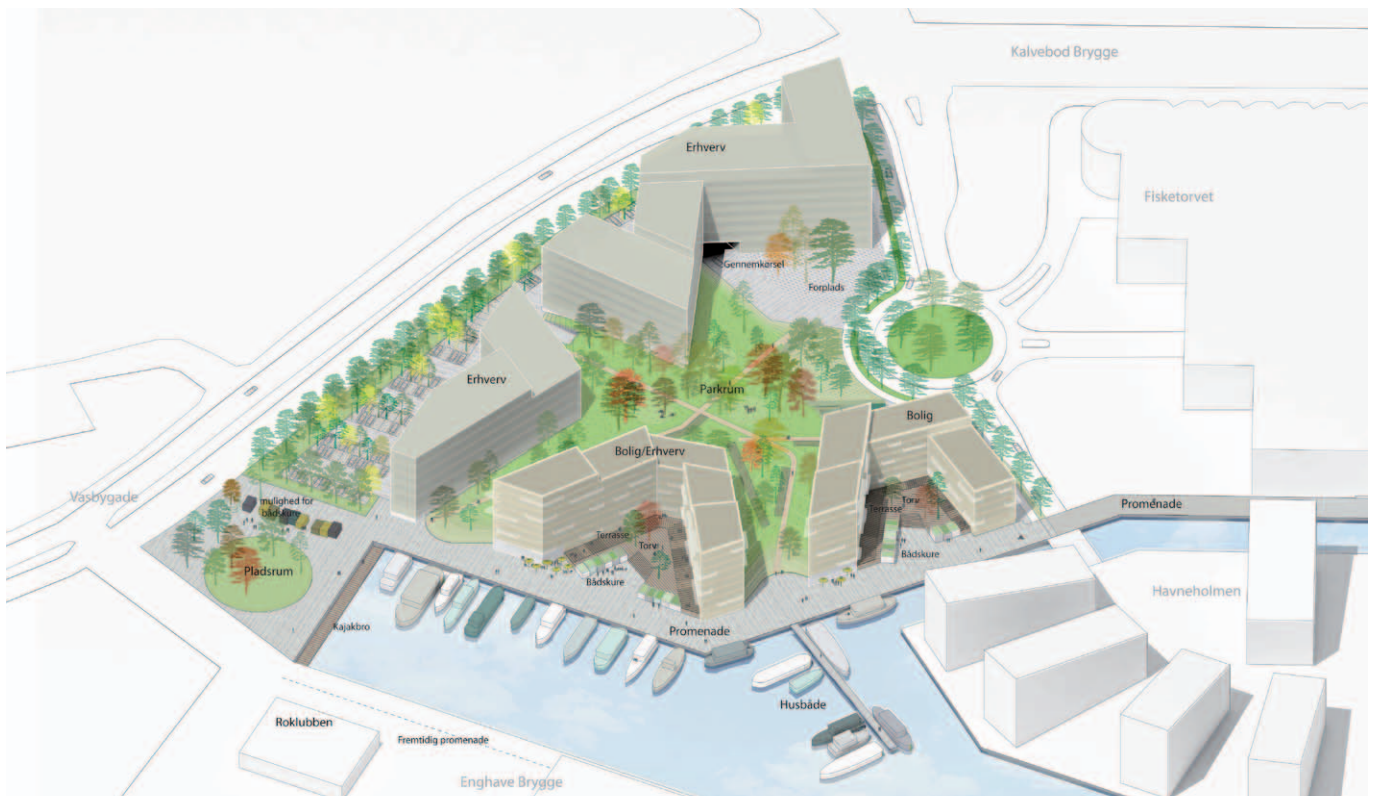
Illustration, der viser bebyggelsens placering på grunden. Illustration af Holscher Arkitekter.