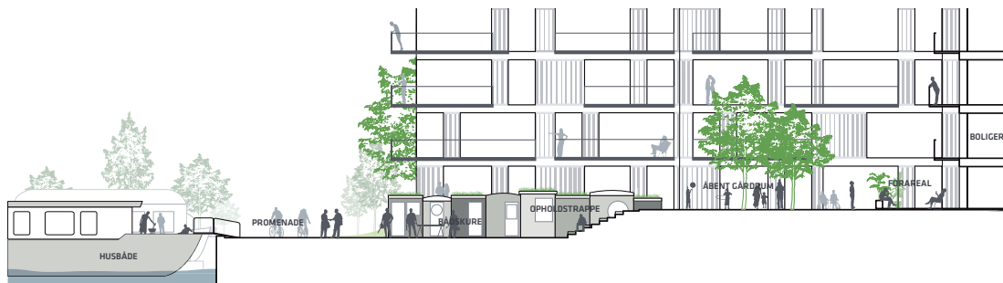
Promenaden der fra kajkanten og frem mod boligerne tilbyder en række forskellige zoner til ophold og oplevelser

Byggeriets disponering giver klare fordele med hensyn til minimering af energiforbrug. Dette betyder, at bygningerne vil blive fremtidssikret med hensyn til energiforbrug og de strammere krav til årligt energiforbrug pr. m 2 . Byggeriet skal opføres efter laveste energiklasse.