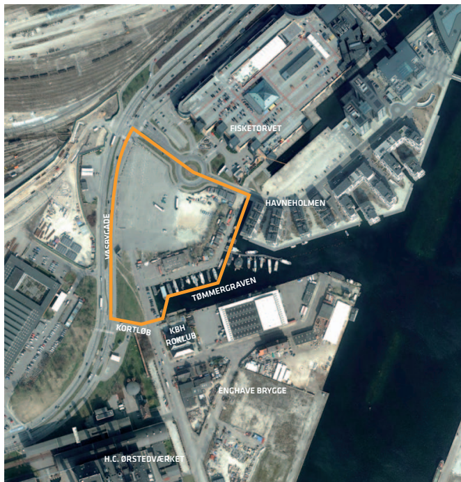
Luftfoto af lokalplantillægsområdet. Husbådene og bådskurene ved Tømmergraven er en del af et særligt miljø, og H.C. Ørstedværket er et landemærke for området.