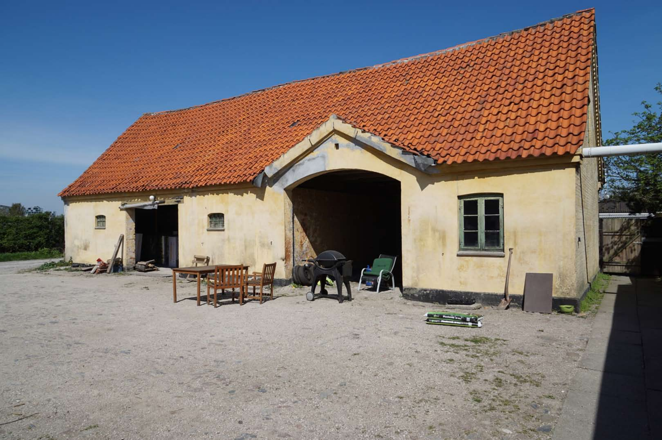
Inger Hansens Minde, Oliefabriksvej 2, 2770 Kastrup