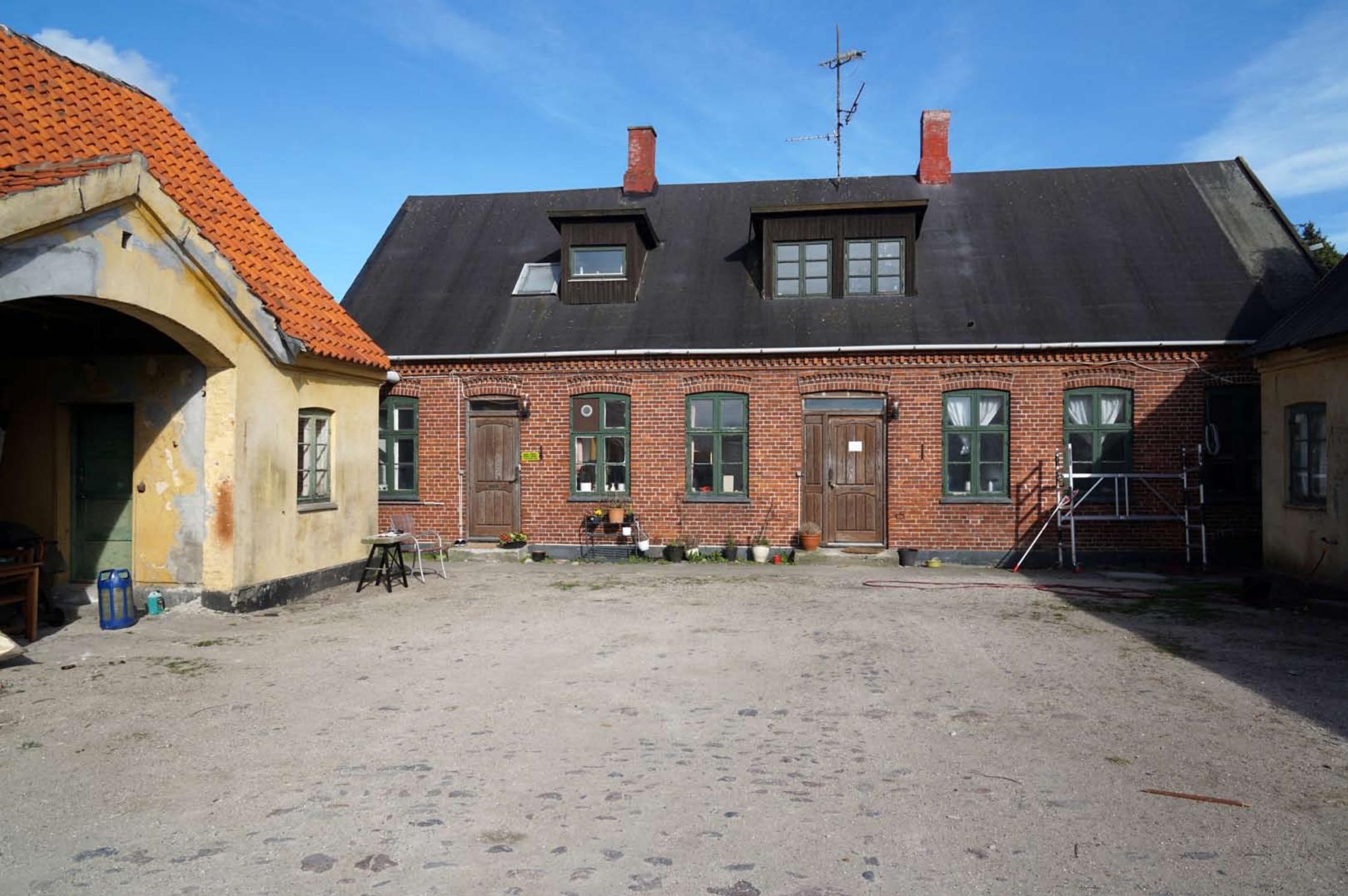
Inger Hansens Minde, Oliefabriksvej 2, 2770 Kastrup