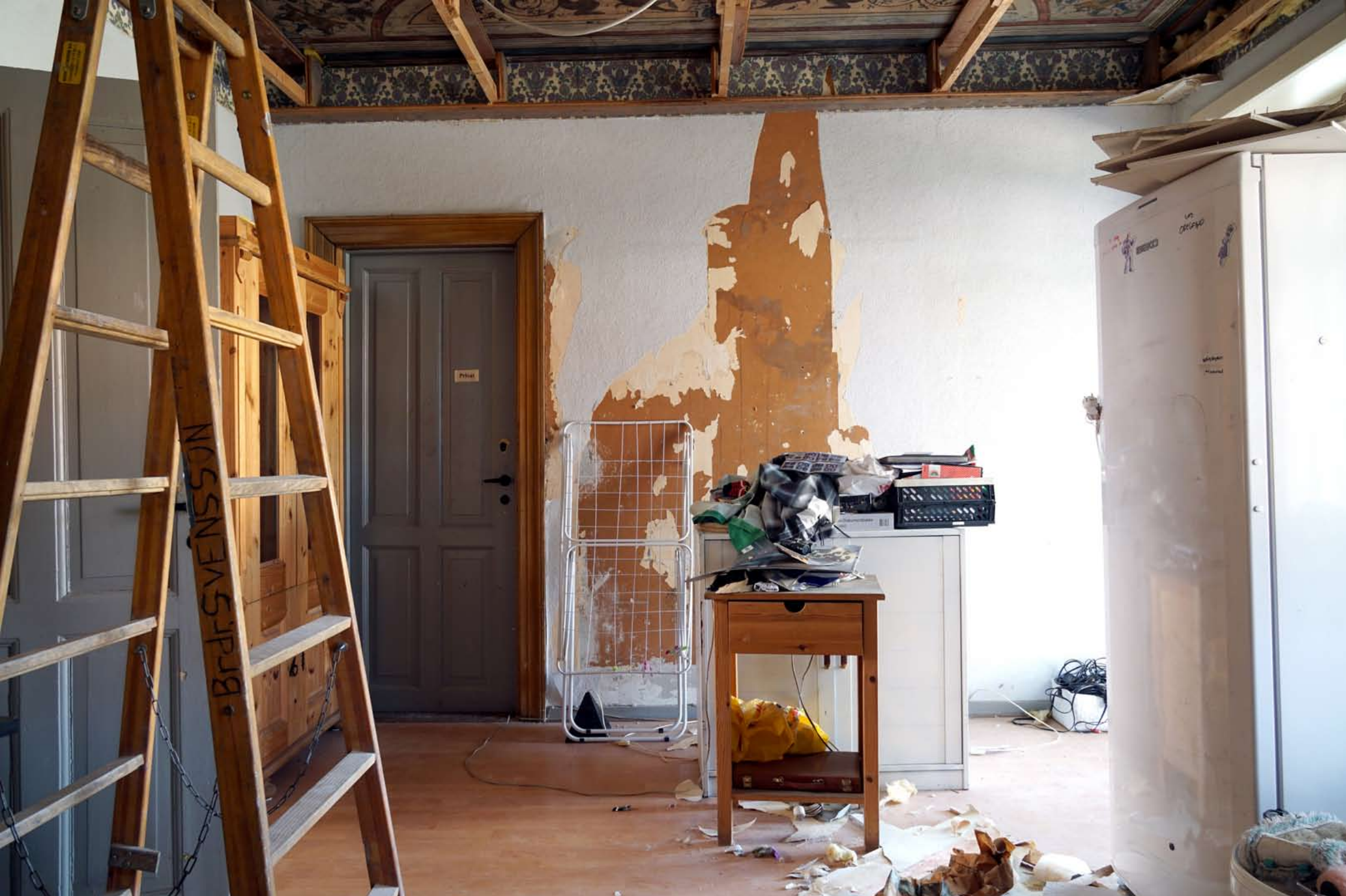
Inger Hansens Minde, Oliefabriksvej 2, 2770 Kastrup