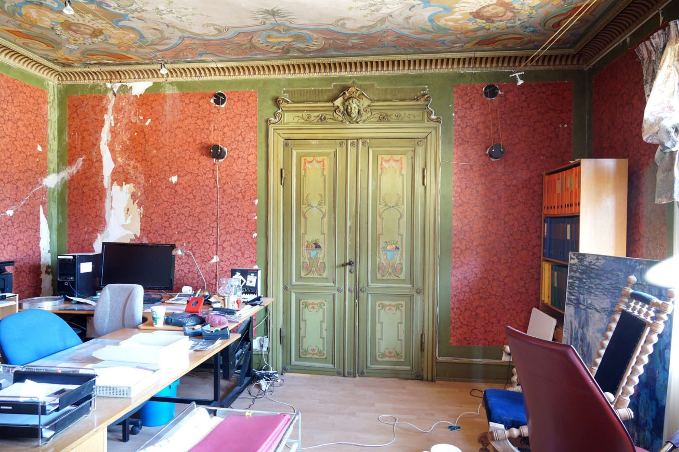
Inger Hansens Minde, Oliefabriksvej 2, 2770 Kastrup