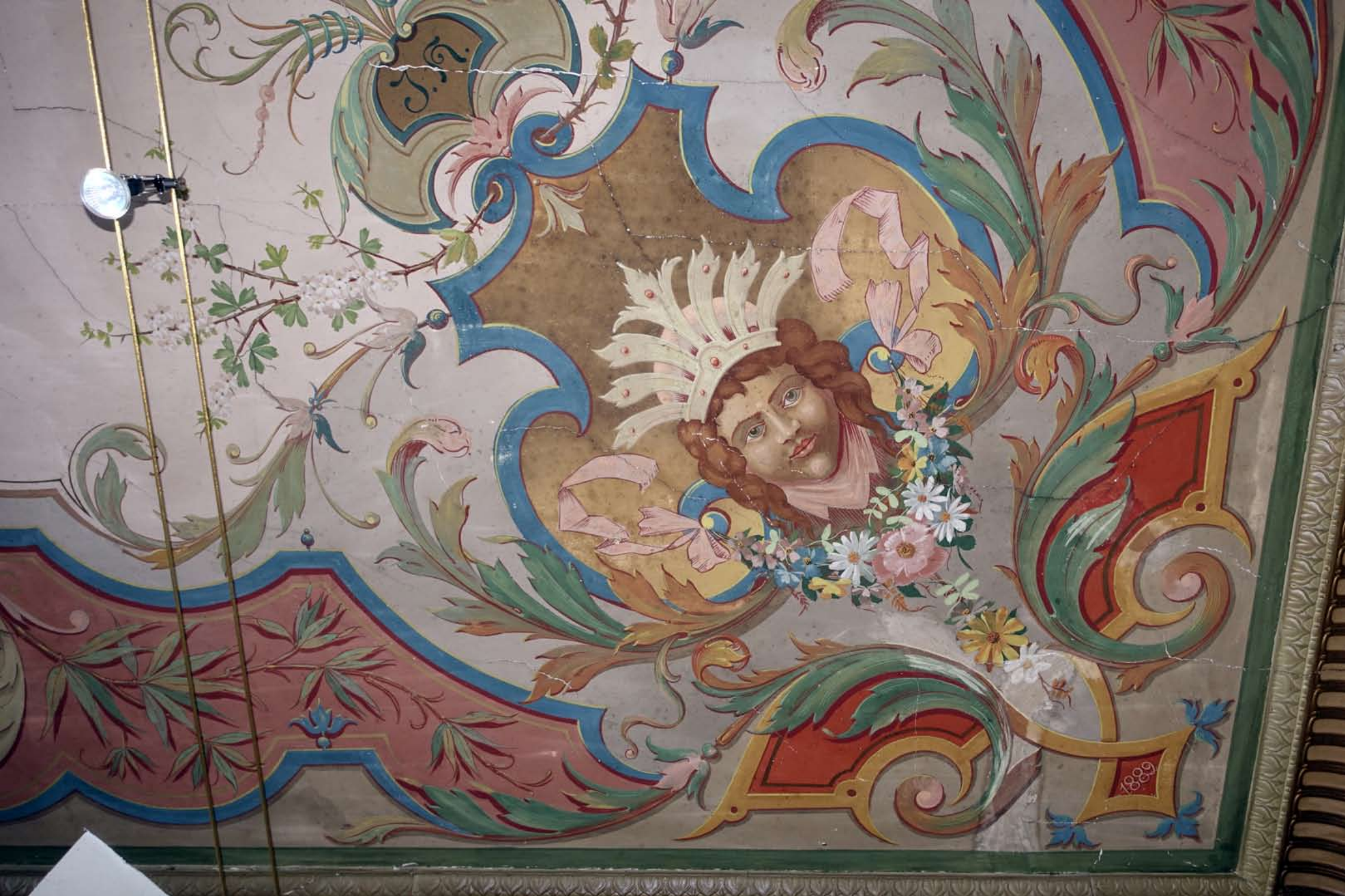
Inger Hansens Minde, Oliefabriksvej 2, 2770 Kastrup