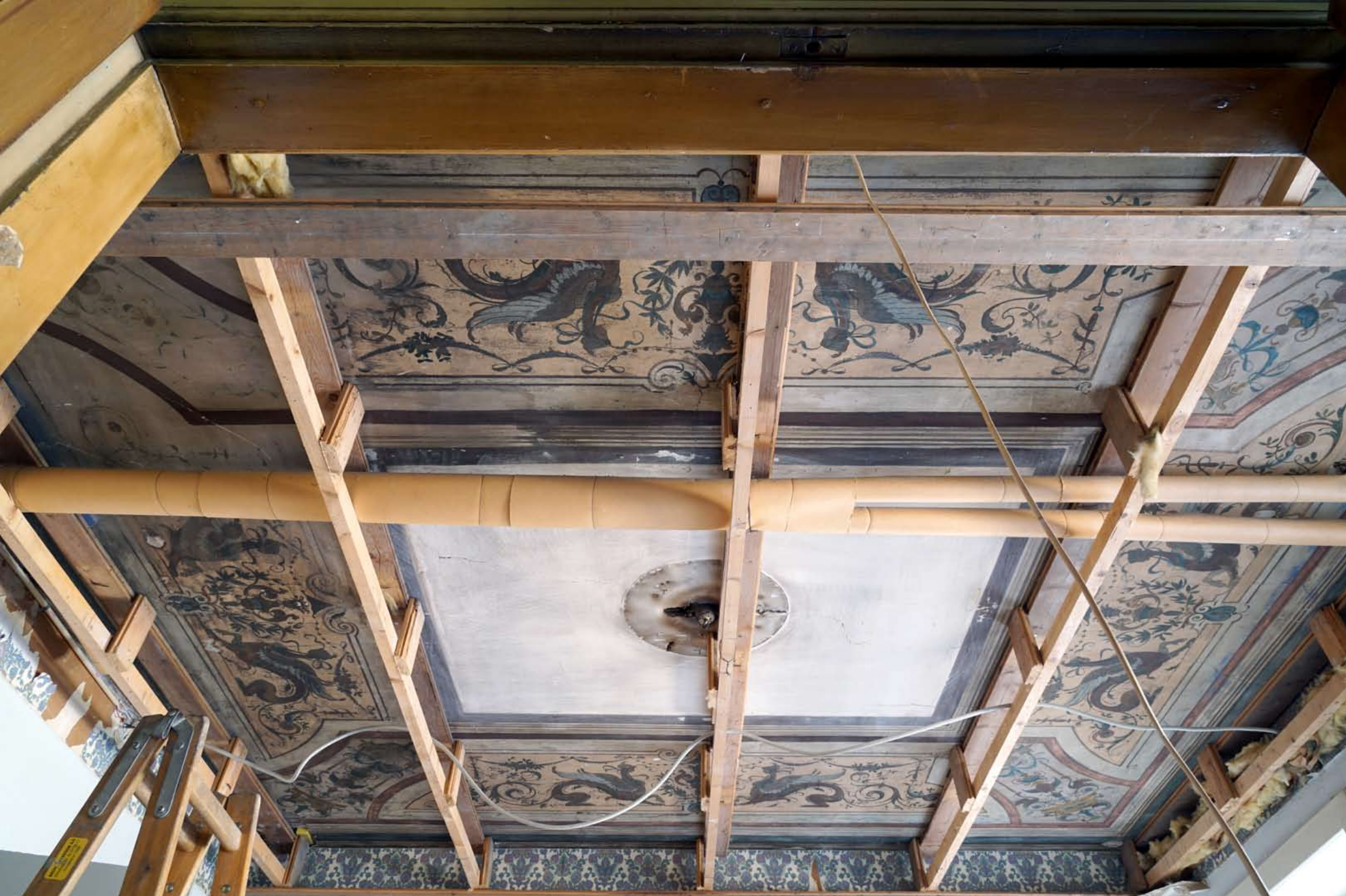
Inger Hansens Minde, Oliefabriksvej 2, 2770 Kastrup