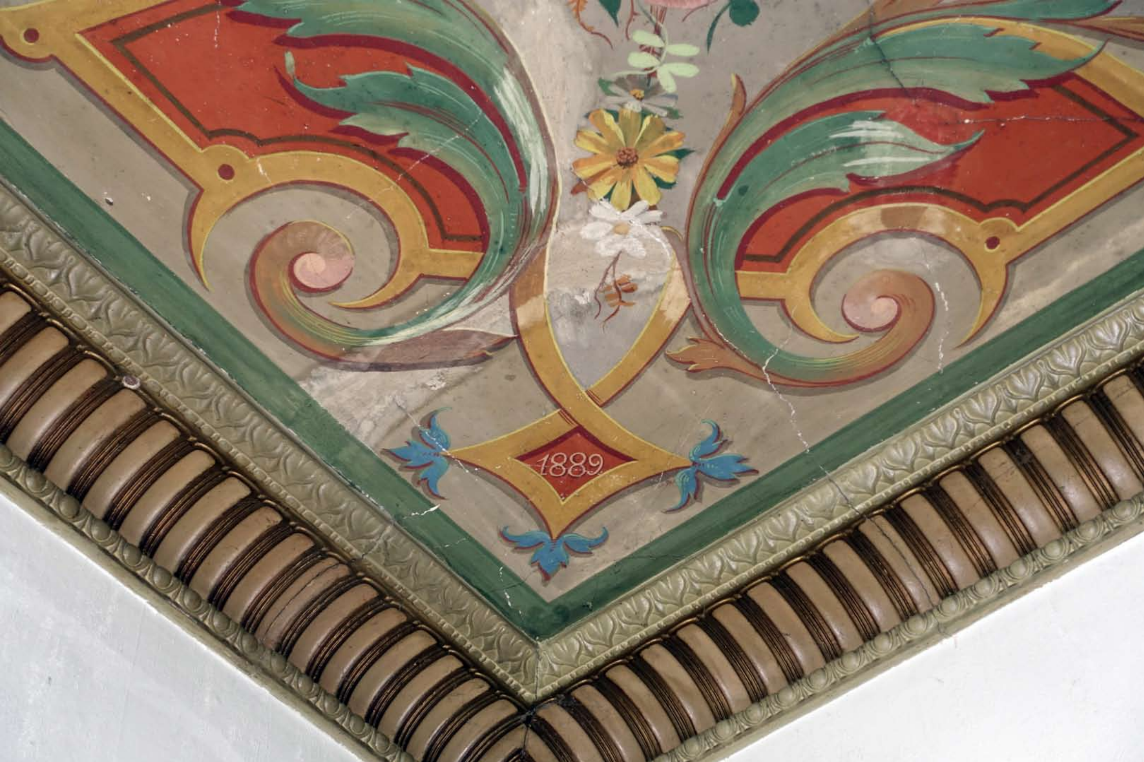
Inger Hansens Minde, Oliefabriksvej 2, 2770 Kastrup