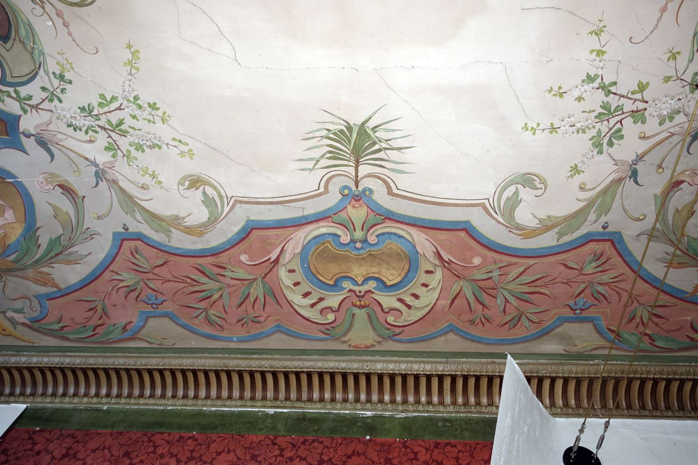
Inger Hansens Minde, Oliefabriksvej 2, 2770 Kastrup