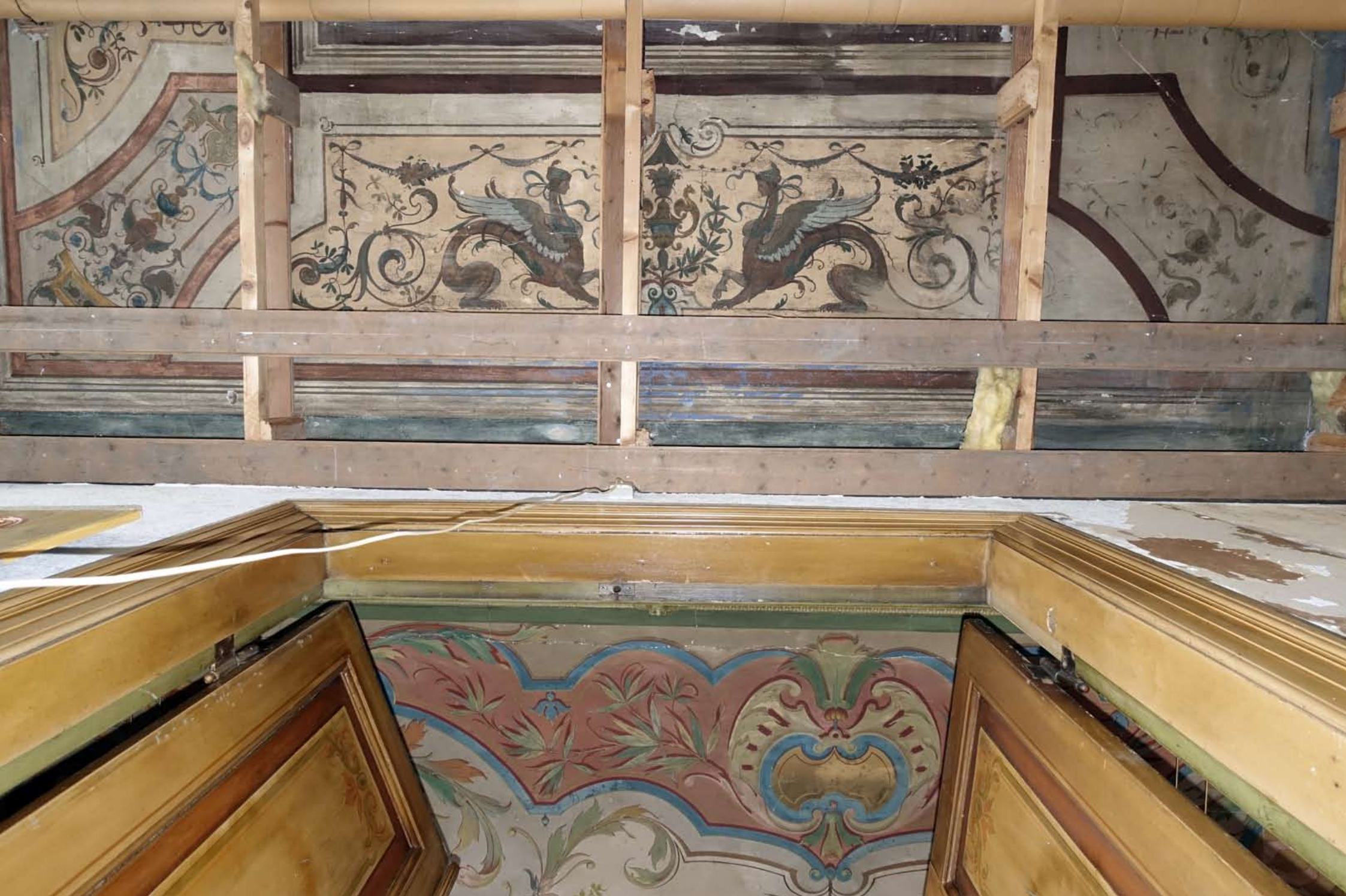
Inger Hansens Minde, Oliefabriksvej 2, 2770 Kastrup