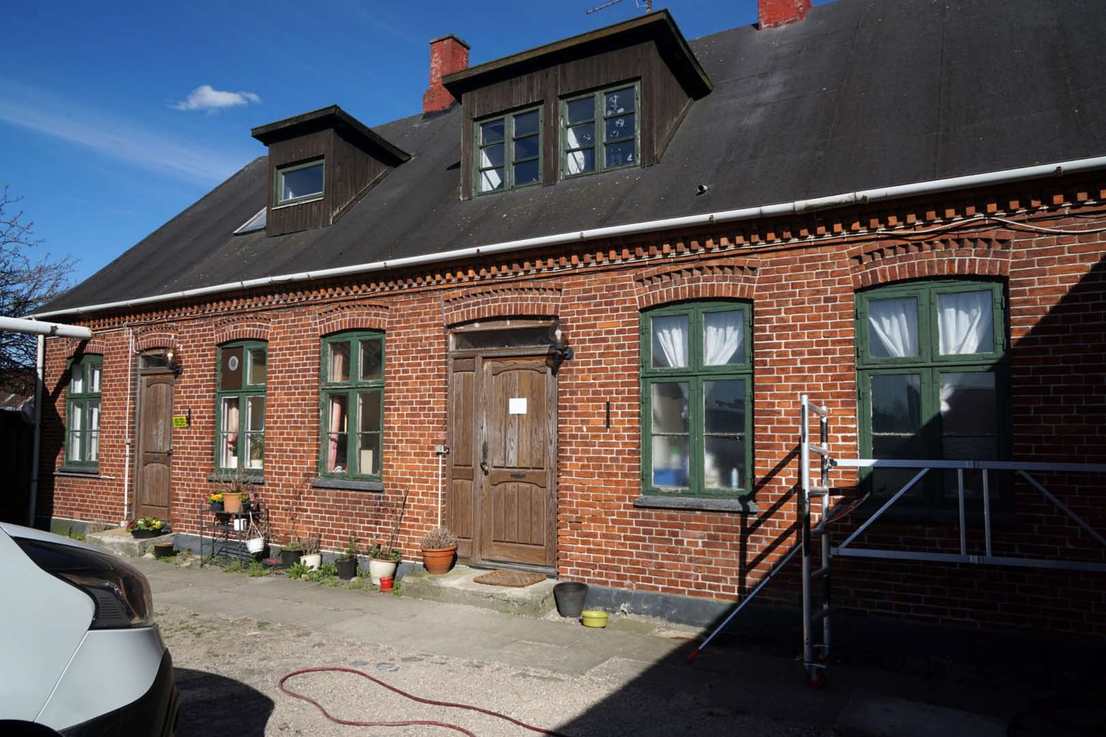
Inger Hansens Minde, Oliefabriksvej 2, 2770 Kastrup