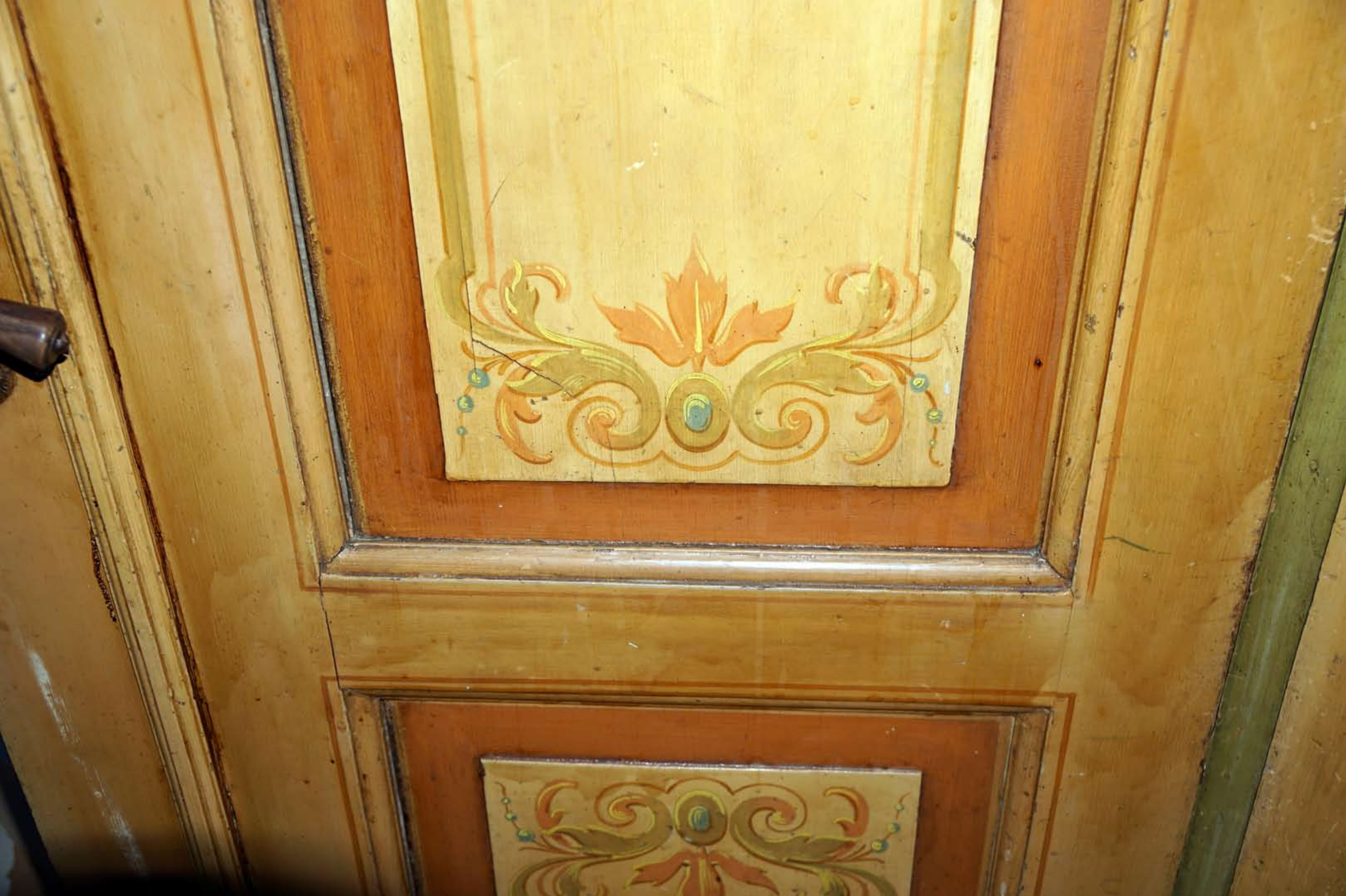
Inger Hansens Minde, Oliefabriksvej 2, 2770 Kastrup