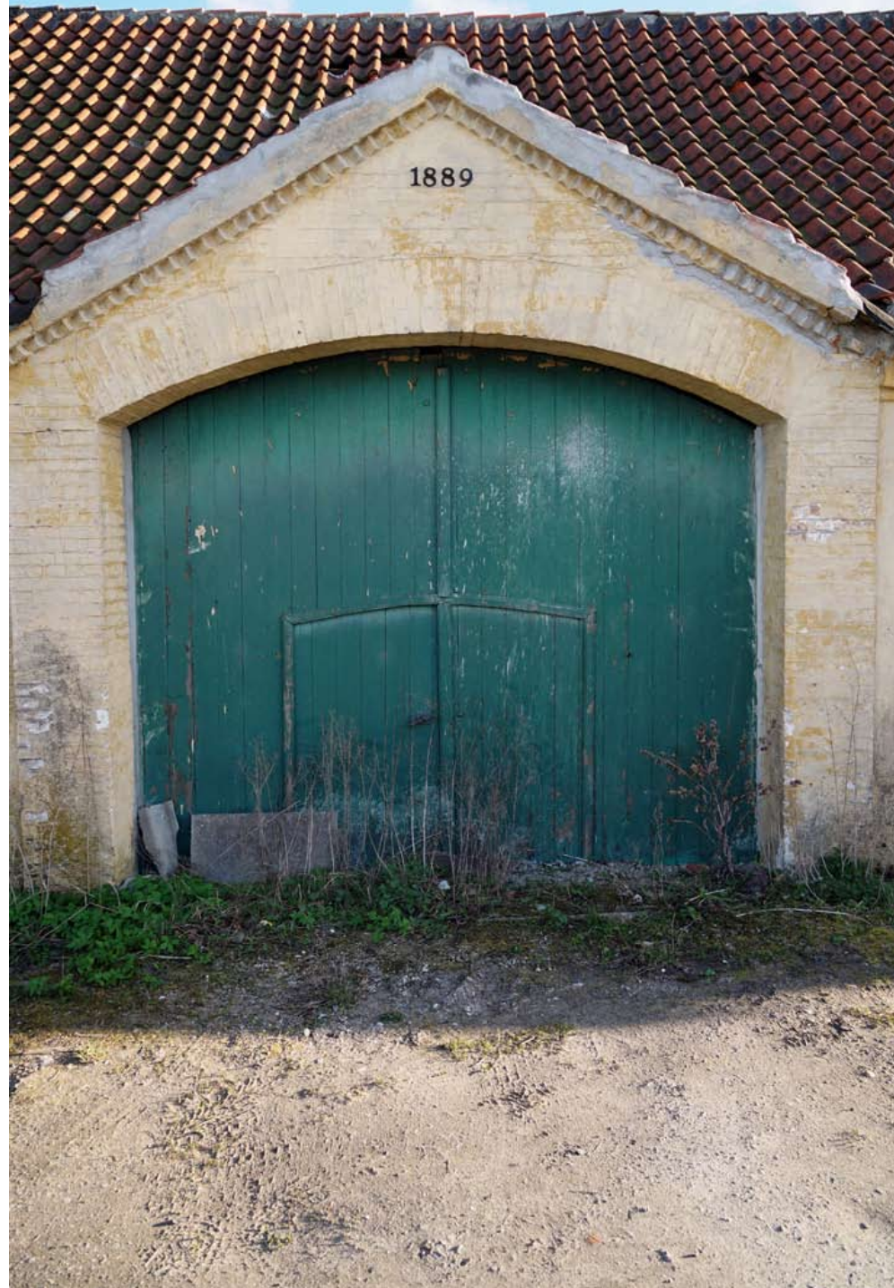
Inger Hansens Minde, Oliefabriksvej 2, 2770 Kastrup