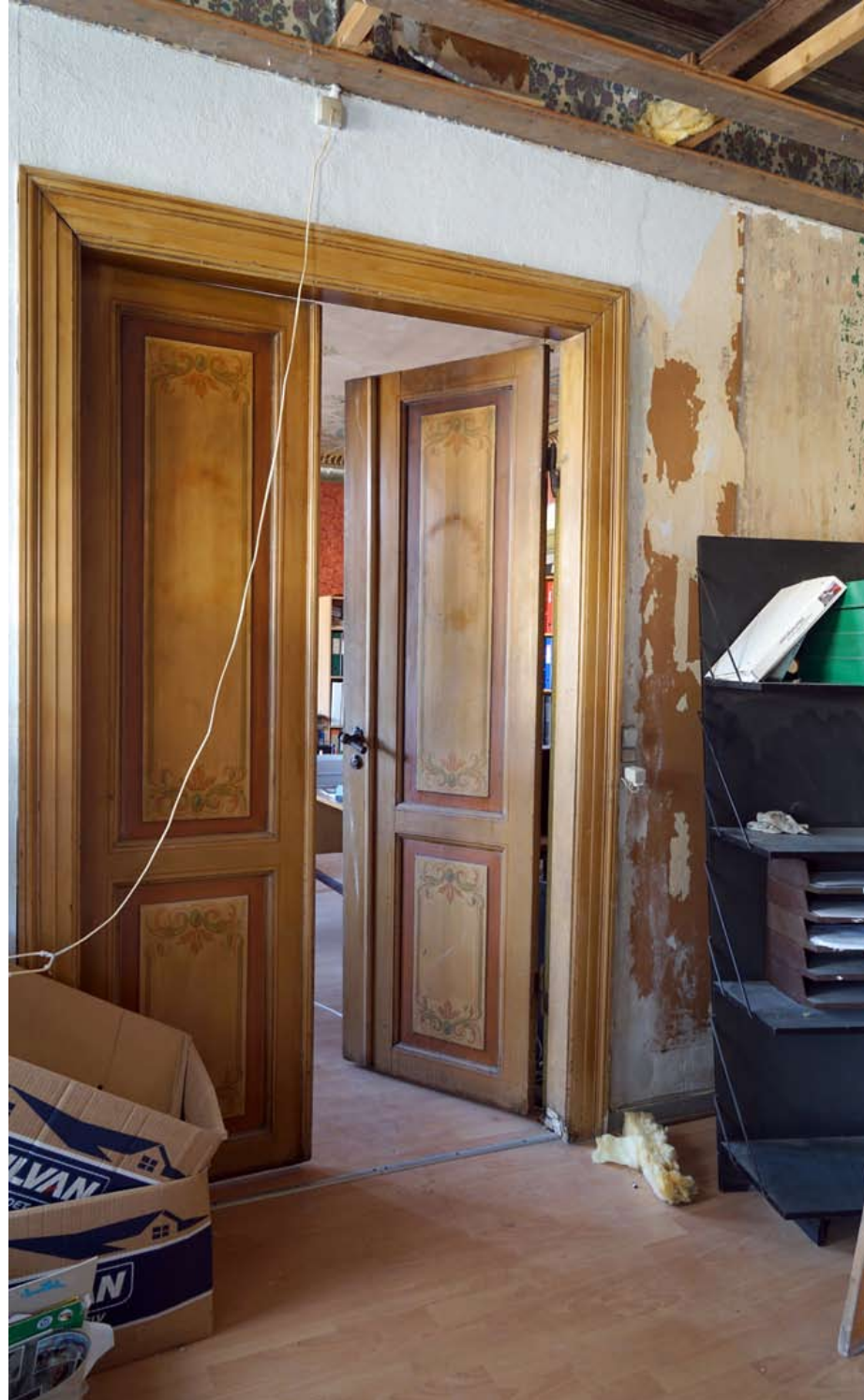
Inger Hansens Minde, Oliefabriksvej 2, 2770 Kastrup