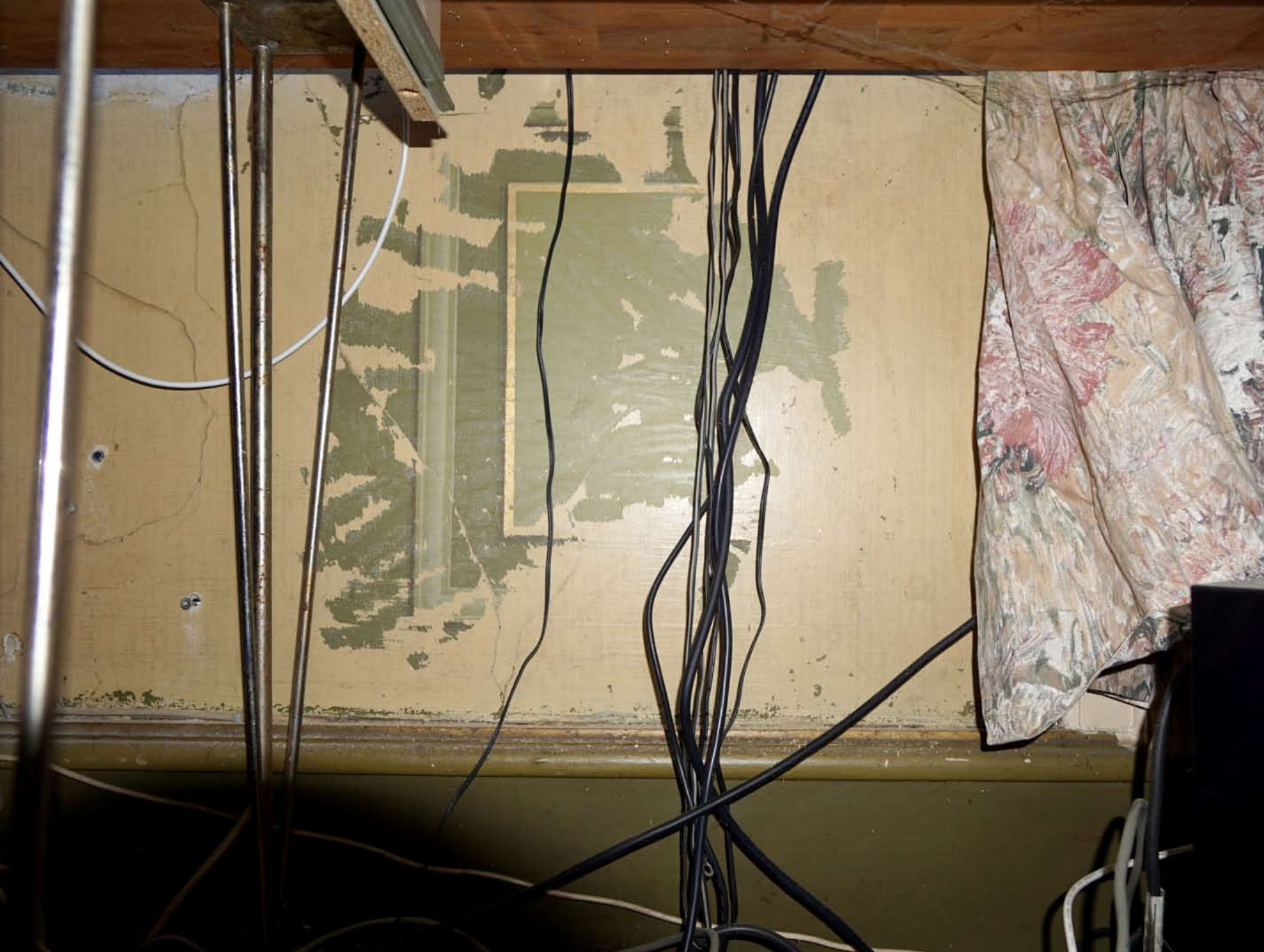
Inger Hansens Minde, Oliefabriksvej 2, 2770 Kastrup