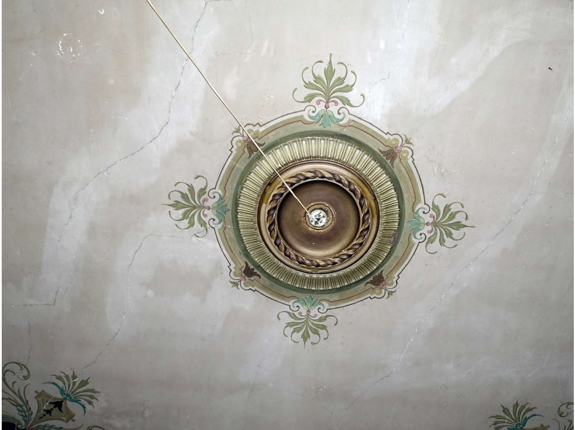
Inger Hansens Minde, Oliefabriksvej 2, 2770 Kastrup