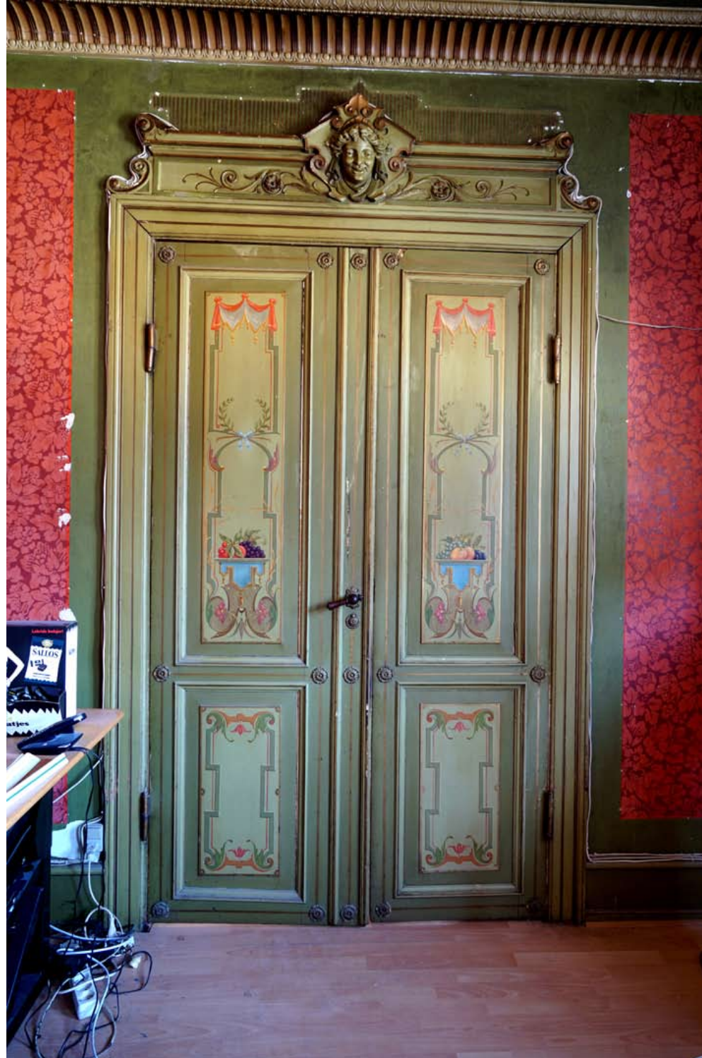
Inger Hansens Minde, Oliefabriksvej 2, 2770 Kastrup