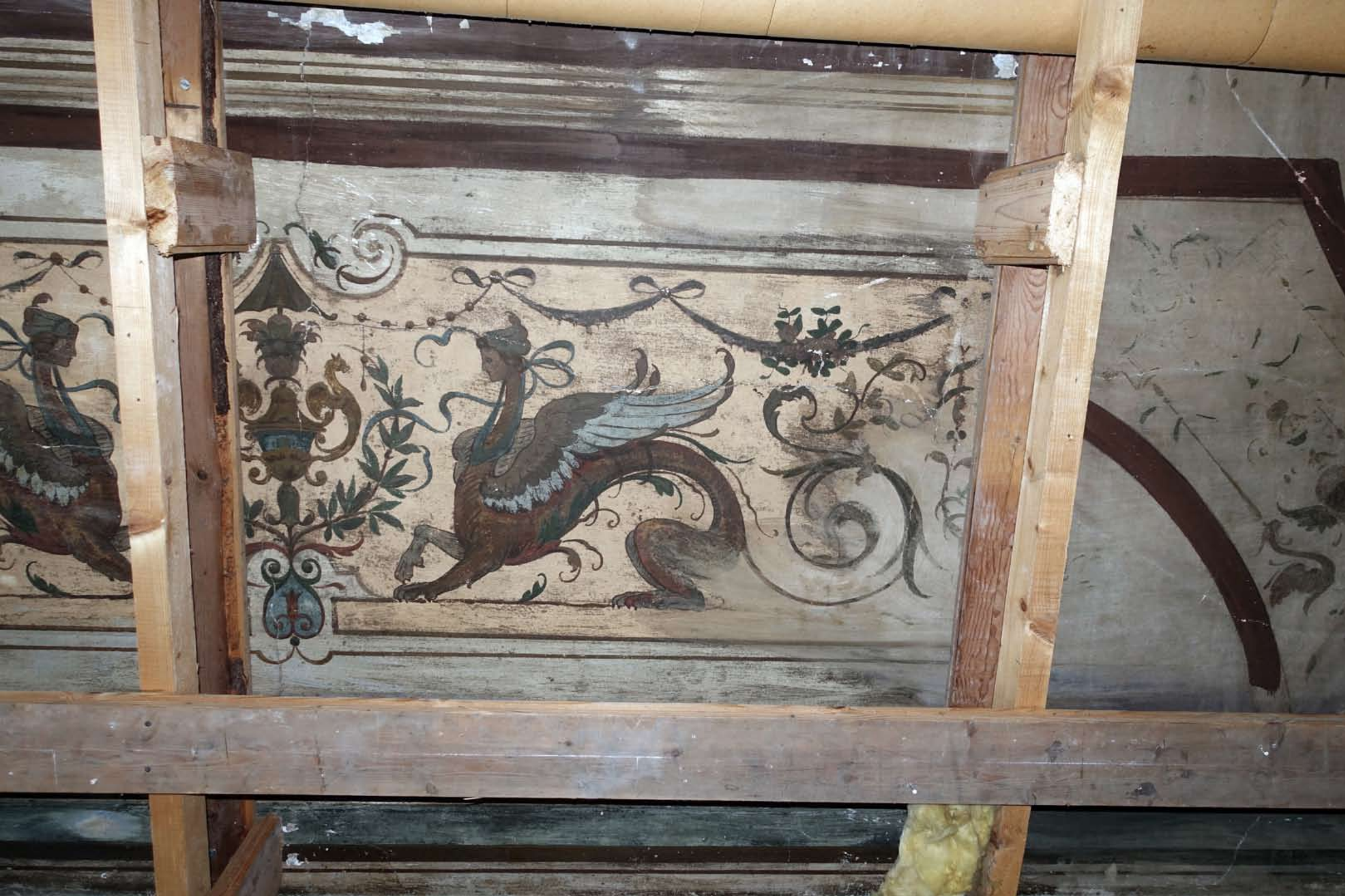
Inger Hansens Minde, Oliefabriksvej 2, 2770 Kastrup