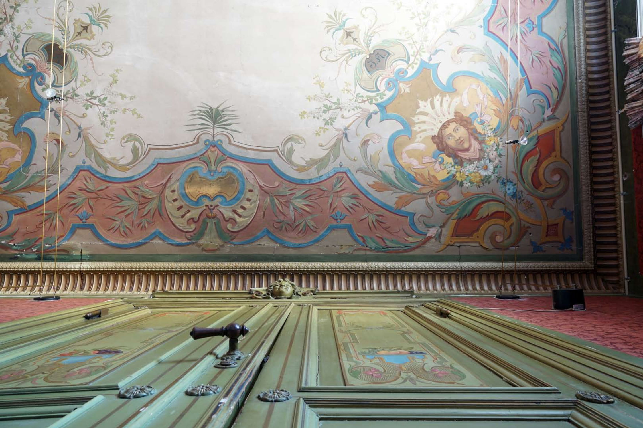
Inger Hansens Minde, Oliefabriksvej 2, 2770 Kastrup