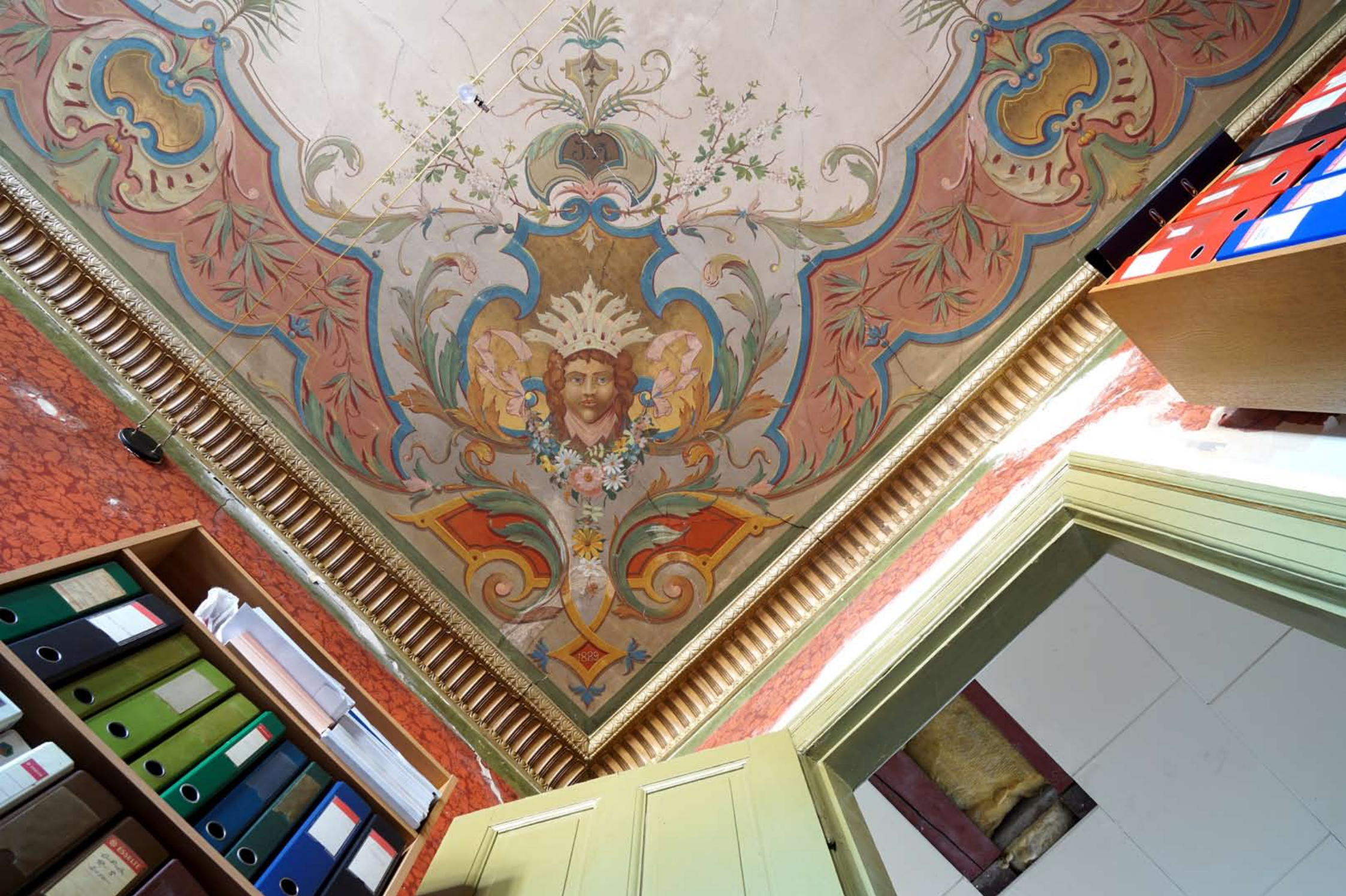
Inger Hansens Minde, Oliefabriksvej 2, 2770 Kastrup