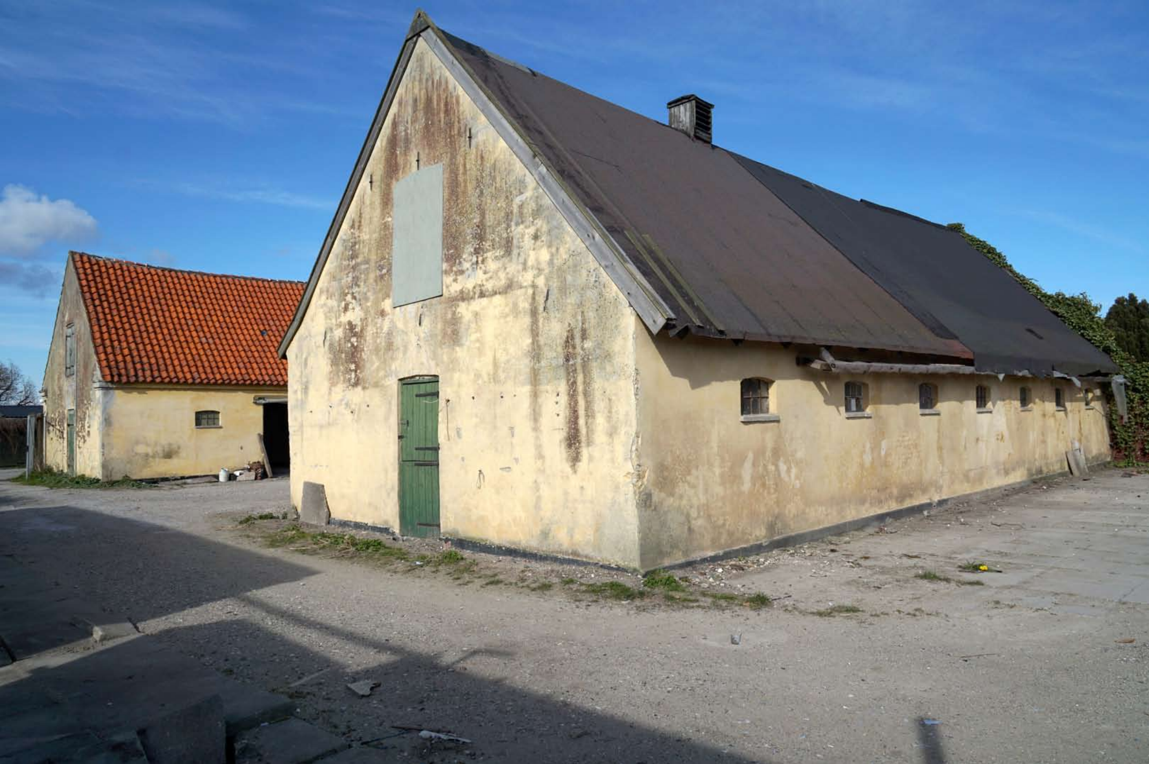
Inger Hansens Minde, Oliefabriksvej 2, 2770 Kastrup