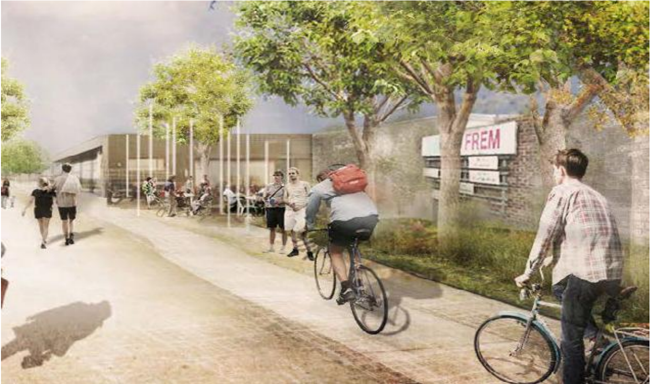
Fælles klubhus som nabo til BK Frem's gamle klubhus