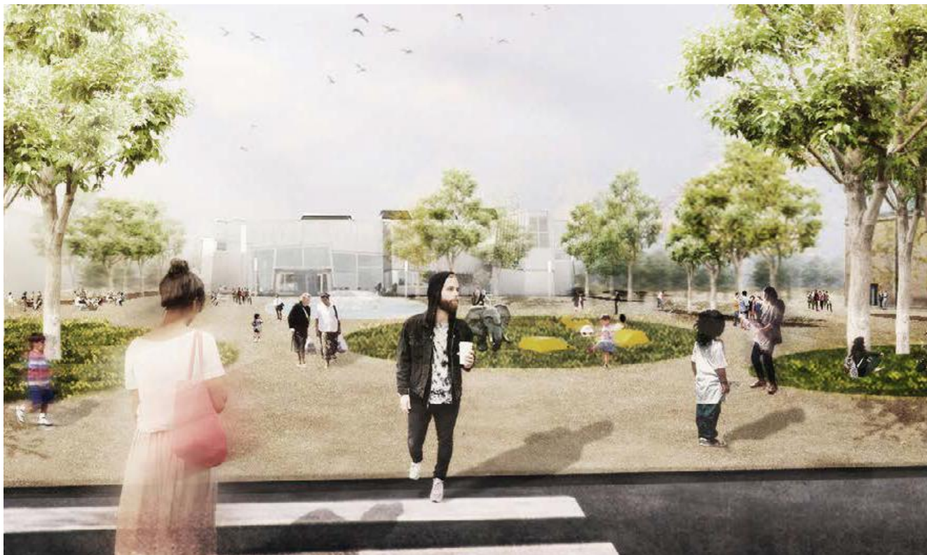
Stemning i Valby Idrætspark - Idrætsbyen har brug for liv.

Der er særlig stor vækst af børn, unge og deres forældre i København. Derfor vil det også være oplagt at netop 2 klubber med børnetilbud, men også 5 klubber med tilbud til voksne bliver klar til at håndtere en øget medlemstilgang fremadrettet.