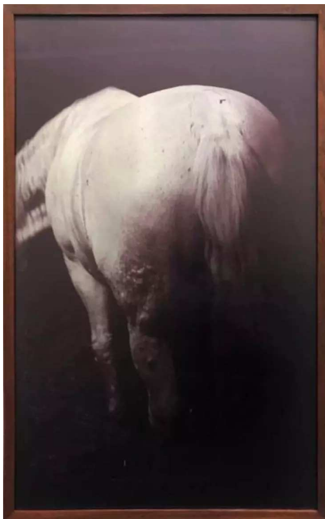
▲ Fotografi af hest printet på aluminium, Jytte Rex.

Hos Byggeri København har de været så heldige at have fået skænket ikke blot ét, men to kunstværker, der forestiller bagdelen af en hest.