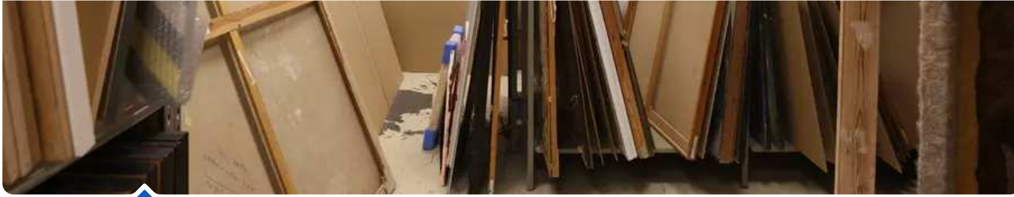
På kommunens depot opbevares omkring 250 kunstværker.