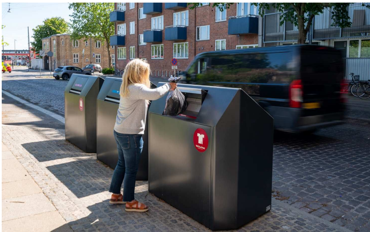
Eksempel på sorteringspunkt med tre kuber i Amager Øst.