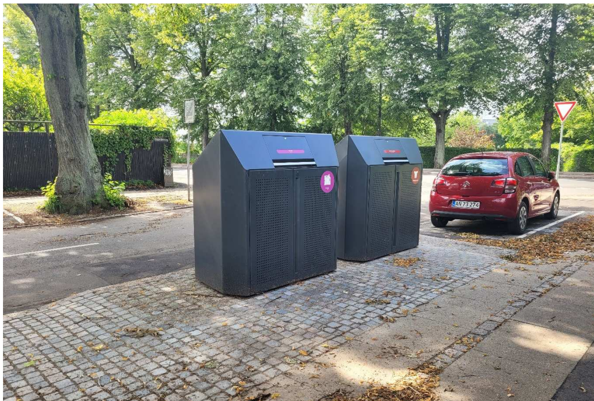
Eksempel på sorteringspunkt med to skjul på Østerbro.