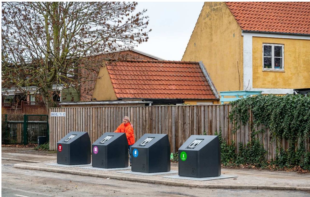
Eksempel på sorteringspunkt med fire nedgravede beholdere i Amager Øst.