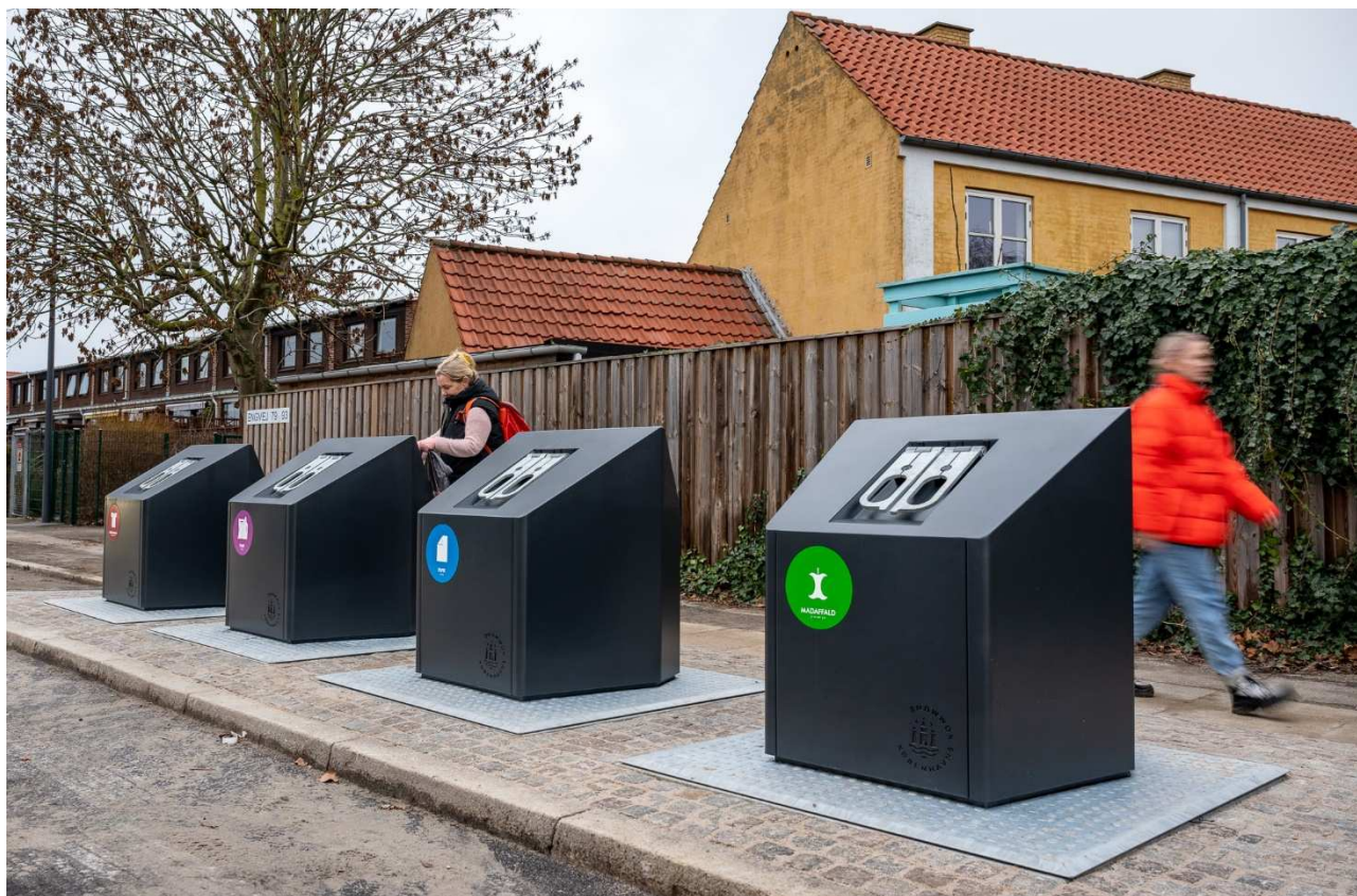
Sorteringspunkt i Amager Øst med fire nedgravede beholdere. Anlagt i januar 2023.