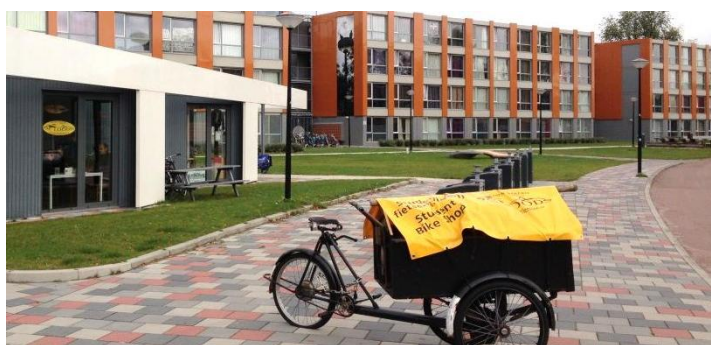
Cykelreparationsværksted som socialt samlende element i Amsterdam

Erhvervslejemålene til de socialøkonomiske microvirksomheder i Urbanias stueetage/ungdomsboligerne skal bygges, så der bliver mulighed for at ændre funktion og indhold over tid.