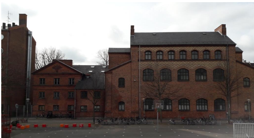
Til venstre den gamle badeanstalt (SAVE 3), der foreslås nedrevet, og til højre den gamle gymnastikbygning (SAVE 3), der foreslås bevaret.

Idet badeanstaltsbygningen er registreret med høj bevaringsværdi, har Teknik- og Miljøforvaltningen foretaget en konkret vurdering af de foreliggende omstændigheder forud for, at der med lokalplanforslaget gives mulighed for nedrivning.