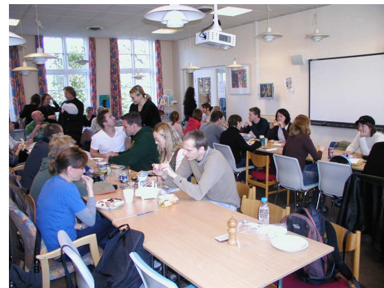
- og alt for lidt plads i personalelokalet