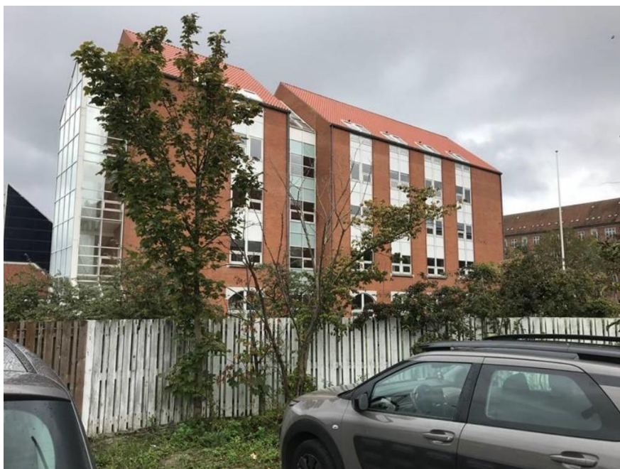
Foto 4: Det er nødvendigt at fælde to selvsåede mindre træer (mirabel og ahorn) og buskads øst for Nyborggade/Svendborggade, da de står i det nye vejanlæg. De erstattes med nye træer langs Svendborggade, jf. bilag 4 (foto september 2019).