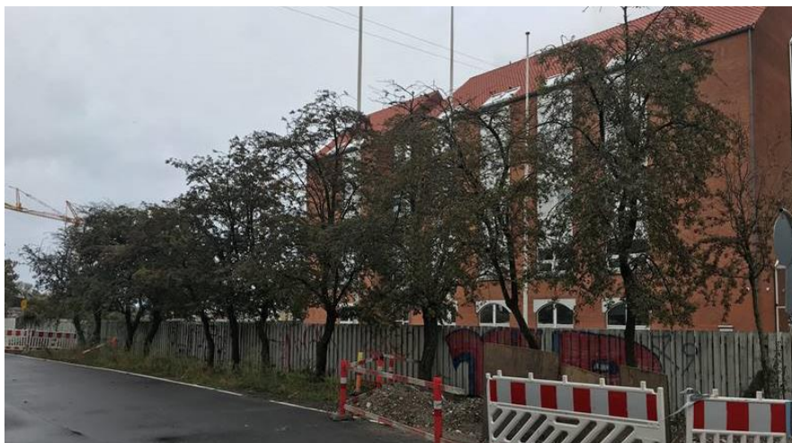
Foto 2: Det er nødvendigt at fælde en træække med 13 tjørn langs Svendborggade (fra Strandboulevarden til Nyborggade), da de står i det nye vejanlæg. De erstattes med nye træer langs begge sider af vejen, jf. bilag 4 (foto september 2019).

Byens Fysik Park og Byrum Islands Brygge 37 Postboks 339 2300 København S