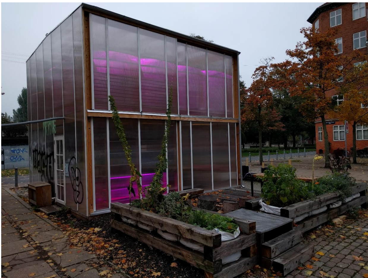
Hydroponisk bylandbrug. Produktionen fortsætter i efterår og vinter