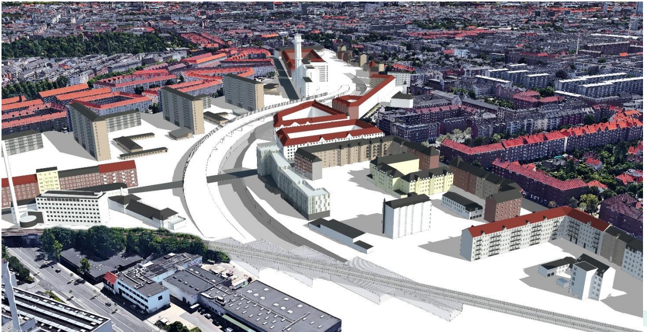
Vi er ved at opbygge en model af Bispepegen, hvor det er meningen, at man kan bevæge sig i 3D // Allan Obling