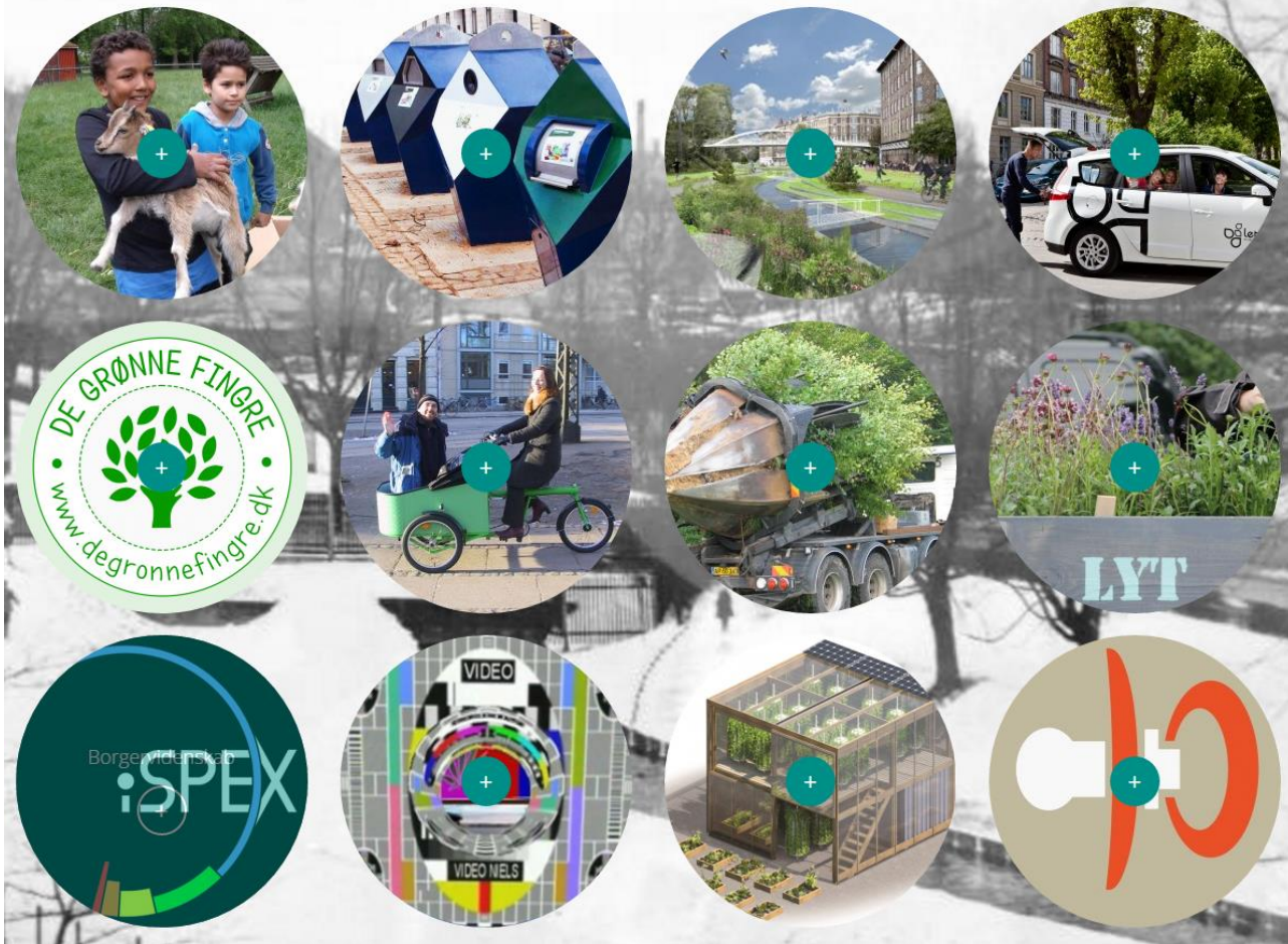
Screenshot af vores hjemmeside med de forskellige projekter