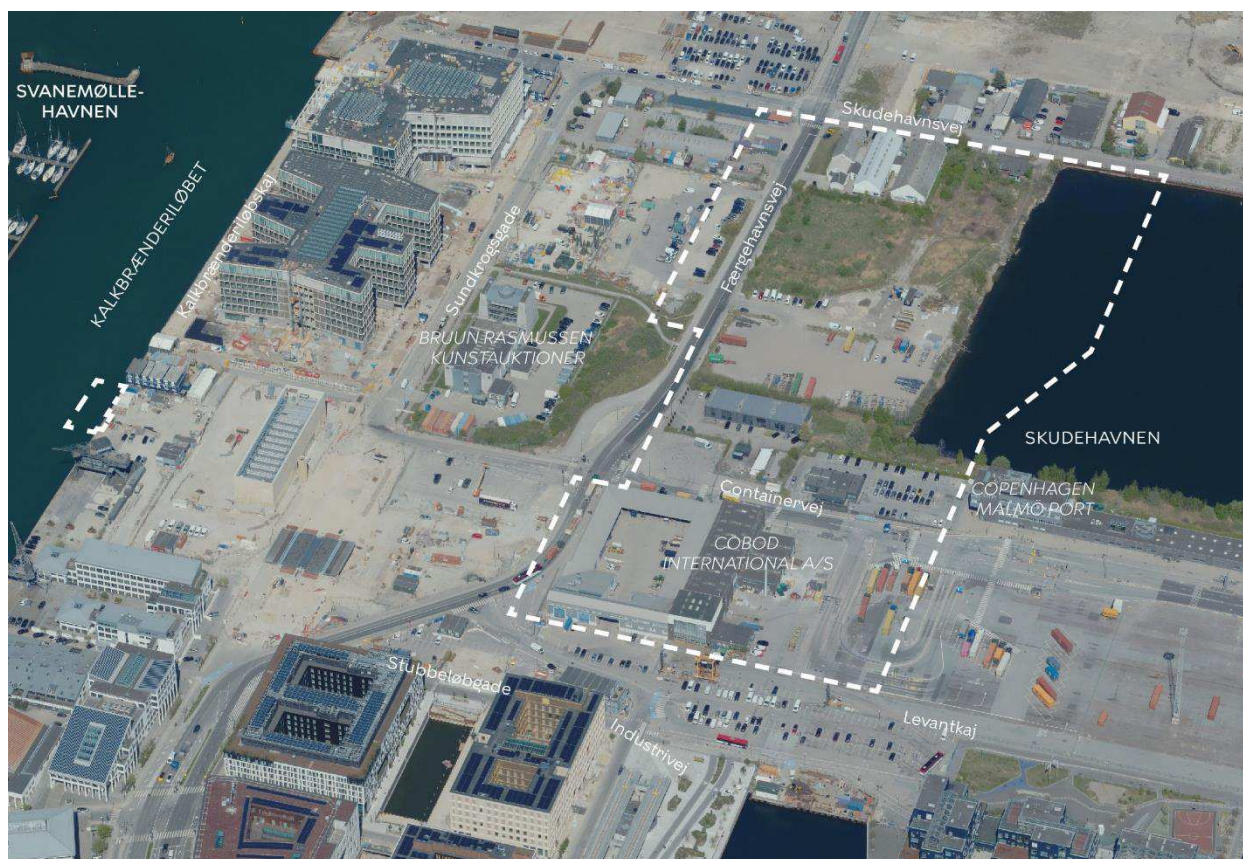
Området set mod nord. Lokalplanområdet er indtegnet med hvid linje, og de vigtigste gader og bygninger er navngivet.