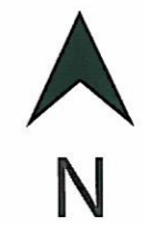
Situationsplan 1 : 200