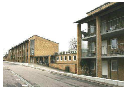
Arkaderne mod øst med en 1-etages institution

Tingbjerg er opført på grundlag af en bebyggelsesplan udarbejdet i 1950 af Arkitekt Steen Eiler Rasmussen i samarbejde med havearkitekt C. Th. Sørensen. I 1956 påbegyndtes byggeriet og størstedelen af bebyggelsen var færdigopført i 1970. I 2018 er der opført et kulturhus tegnet af arkitektfirmaet COBE. Bygården mod Ruten stod i medio 2020 færdigbygget med butikker og private boliger på det førhenværende Lille Torv.