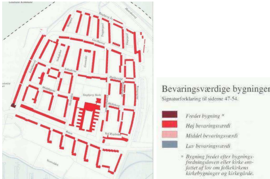
Kort: Bydelsatlas Brønshøj-Husum