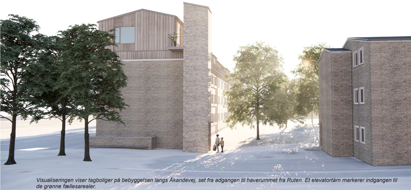
Visualiseringen viser tagboliger på bebyggelsen langs Åkandevej, set fra adgangen til haverummet fra Ruten. Et elevatortårn markerer indgangen til de grønne fællesarealer.