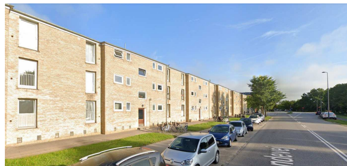
Ankomsten til Tingbjerg langs Åkandevej idag. Visualiseringen nedenfor viser Åkandevej med nye tagboliger og ankomst ved hjørnet for Ruten.