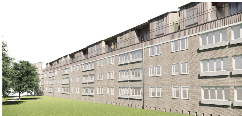
Visualiseringen viser haverummet ved Åkandevej med nye tagboliger. Haverummet ved Åkandevej er Tingbjergs største og har potentiale for at rumme flere nære beboere.