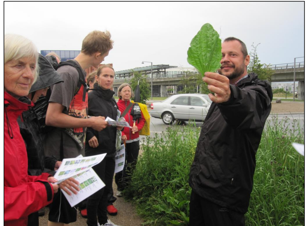
Tur til Spiselige planter på Amager Fælled

Målgruppen for denne indsats er borgere på Amager (Øst & Vest). For at nå dem, er det oplagt at samarbejde med Center for Park og Natur og lokale interessenter som Planteklubben, SGF og Projektbasen. Succeskriterierne for projektet er at afholde mindst to arrangementer eller ekskursioner i 2014.