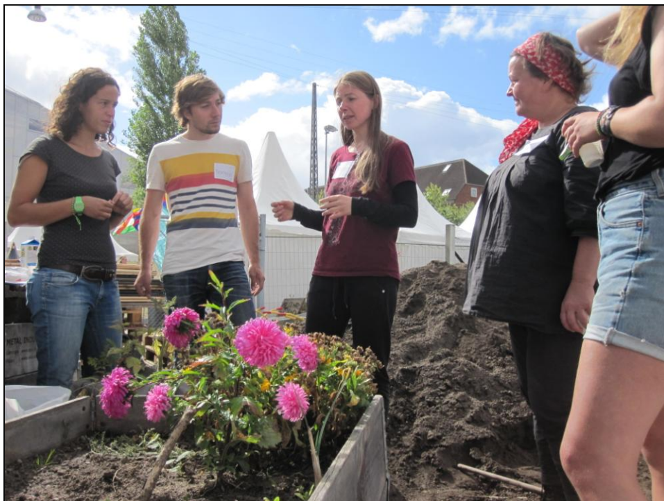
”Byg din egen byhave” – workshop i Prags Have

Miljøpunkt Amager er organiseret som en selvejende fond med egen bestyrelse, der har det overordnede ansvar. Hovedparten af Miljøpunkt Amagers midler kommer fra lokaludvalgene på Amager.