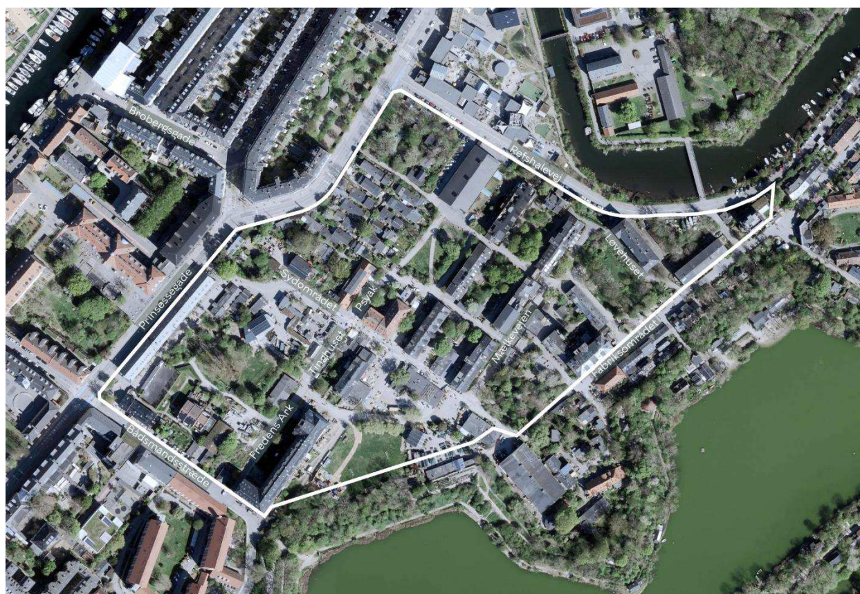
Lokalplanområdet er indtegnet med hvid linje, og de vigtigste gader er navngivet.

I de markerede orange områder forventes den primære andel af byggeriet