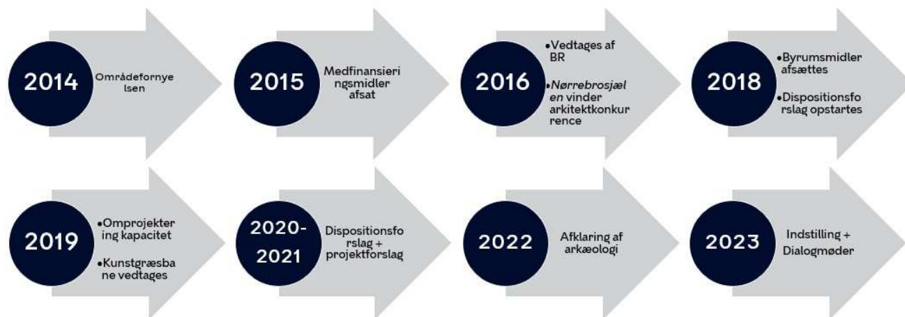
Figur 1 - Oversigt over Hans Tavsens Park historik.

Hans Tavsens Park er et projekt med en lang historik, se evt. oversigten på Figur 1, med inddragelse af lokale interessenter og borgere gennem hele processen. Figur 2 viser en oversigt over den inddragelse, der har været undervejs i de forskellige faser af projektet.