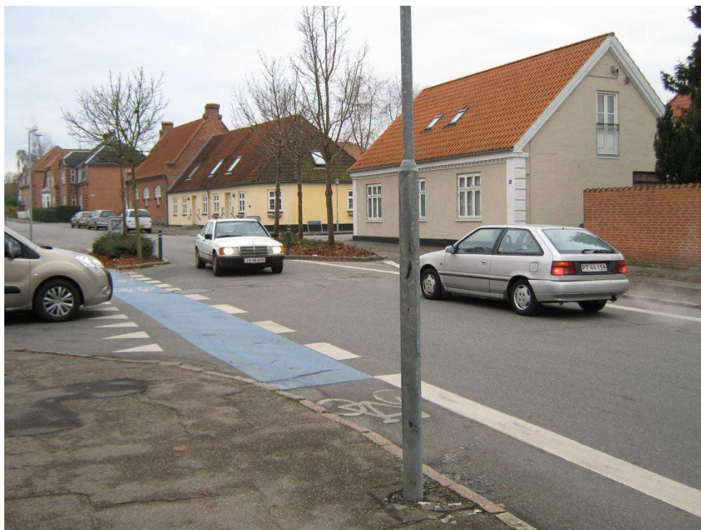
Figur 2 Vejindsnævring i krydset Dagmarsgade/Schandorphsvej og Dagmarsgade/Anlægsvej.

De øvrige forhold på Dagmarsgade er anlagt på delstrækninger mellem kryds og med tilstrækkelig afstand til nabokryds. Der er ikke registreret ulykker i forbindelse med disse, ej heller er der så vidt vides, indkommet klager fra borgerne.