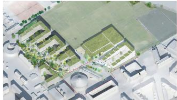
3D illustration af det samlede Østre Gasværk Kvarter med ny boligbebyggelse ved Østre Gasværk Teater indpasser. Illustration: JaJa Architects, SLA architects og KHR Architecture.