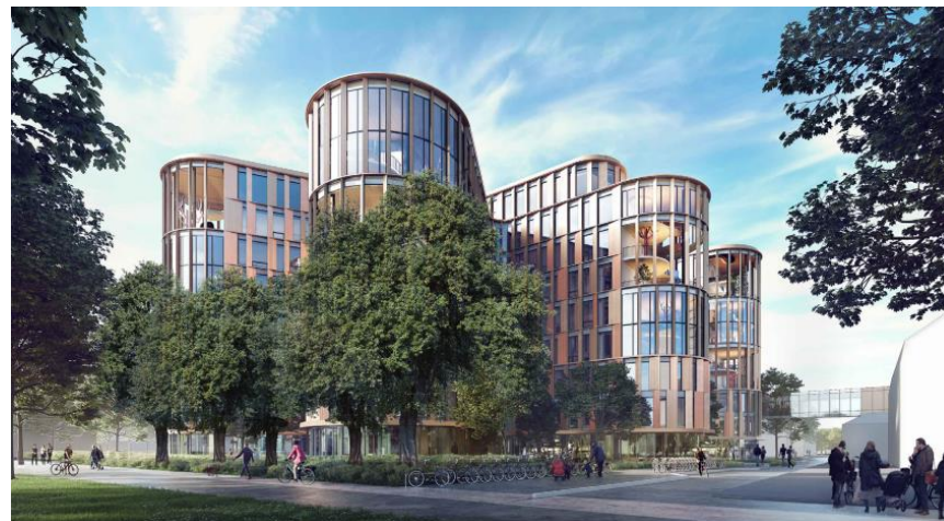
Bebyggelsen set fra sydvest. Illustration: 3XN