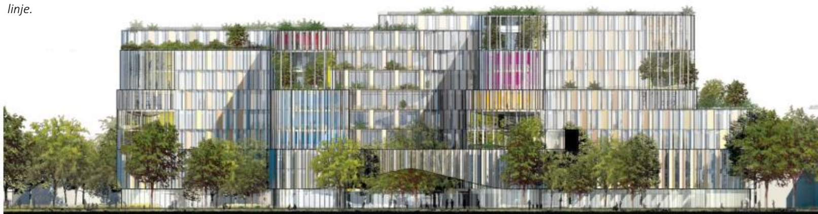
Facade mod sydøst. Illustration: 3XN