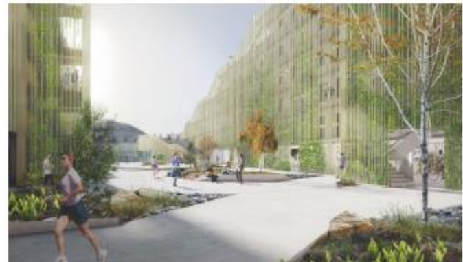
Gårdrummet set fra øst med teaterbygningen i baggrunden. Illustration: KHR Architecture.