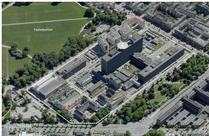
Luftfoto af området set fra nordvest. Lokalplan nr. 493 er angivet med hvid linje. Området for tillæg nr. 1 er angivet med hvid stiplede linje.