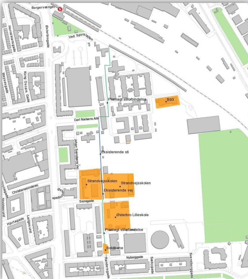
Kort 1: Planlagt stiftorbindelse

På den baggrund har forvaltningen vurderet alternative stiftorløb uden om skolen, herunder det af forældregruppen for Strandvejskolen forslag til alternativ linjeføring, som de har indsendt til Østerbro Lokaludvalg.