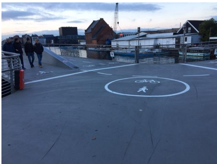
Sommerfuglebroen set fra Lejerbo-siden. Der er i dag opstribet adskillelse mellem gang- og cykelsti ude i krydset og der er markeret en "tavle" nede i belægningen, der skal fortælle, at dette broen er