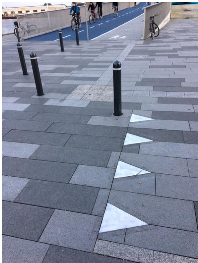
Havnegade ved Nyhavn og brolandingen.