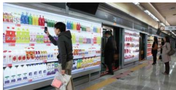
Virtuelt supermarked – Korea 2011

Materiale kan bestilles eller hentes direkte ned på telefonen. Et teknologisk selvbetjeningstilbud.