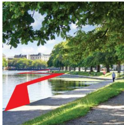
Løberute (ill. Byudvikling & Events)

Københavnerne løber, går og opholder sig langs søerne. Nogle dage er trængslen stor. Ved at etablere en egentlig løbesti/løberute i kanten af søerne vil der skabes plads til endnu flere aktiviteter og bevægelse/løb. Løbestierne kan tænkes etableret ud i søerne og dermed give en markant synlighed af fritidslivet. Løbestierne vil kunne understøtte søerne som byens nye søpark og et attraktivt idrætsanlæg i byen. Anlægsprisen er ca.: 20 mio. kr.