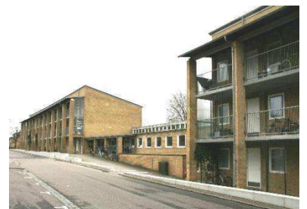
Arkaderne mod øst med en 1-etages institution

Tingbjerg er opført på grundlag af en bebyggelsesplan udarbejdet i 1950 af Arkitekt Steen Eiler Rasmussen i samarbejde med havearkitekt C. Th. Sørensen. I 1956 påbegyndtes byggeriet og størstedelen af bebyggelsen var færdigopført i 1970. I 2018 er der opført et kulturhus tegnet af arkitektfirmaet COBE. Bygården mod Ruten stod i medio 2020 færdigbygget med butikker og private boliger på det førhenværende Lille Torv.