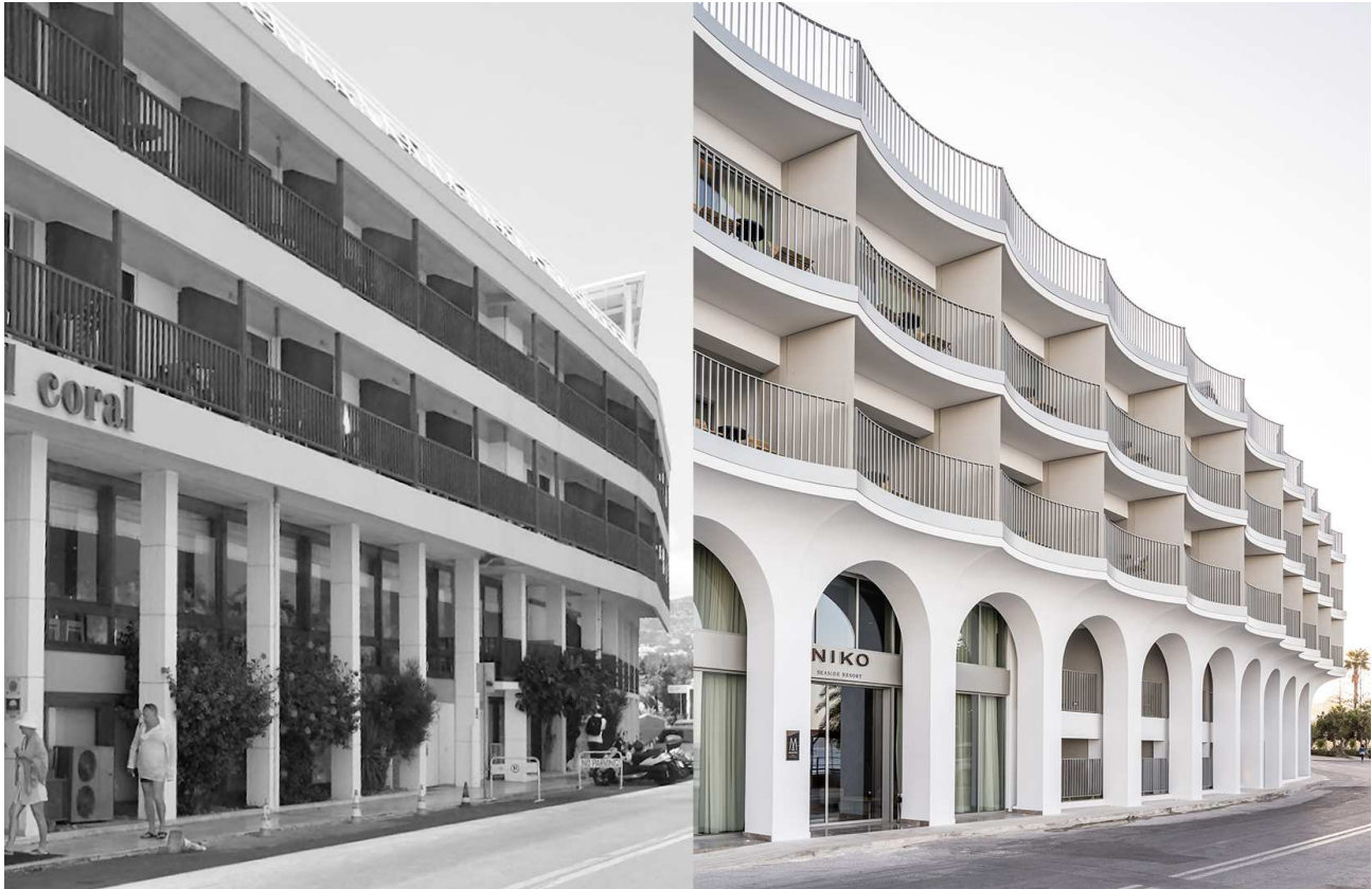
På Kreta har 3XN transformeret et 3-stjernet hotel fra 70'erne til det moderne 5-stjernede Hotel Niko.

København, du har behov for en lovgivning der sikrer, at vi bygger videre på det, vi allerede har.