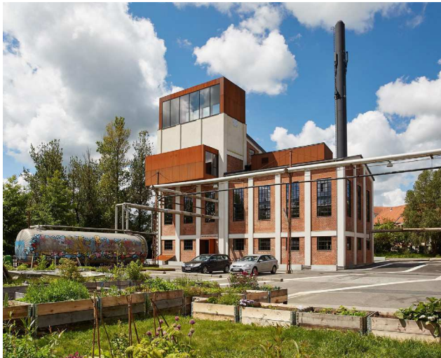
Kedelbygningen i Vejle, som Schmidt Hammer Lassen har været med til at restaurere sammen med Spinderihallerne. Foto: Schmidt Hammer Lassen

Udkastet til loven – den er endnu ikke vedtaget – foreskriver, at der kun bør gives tilladelse til nedrivning på baggrund af en »interesseafvejning«, hvor bygningens arkitektoniske kvalitet, værdi for offentligheden og dens betydning i bystrukturen tages i betragtning.