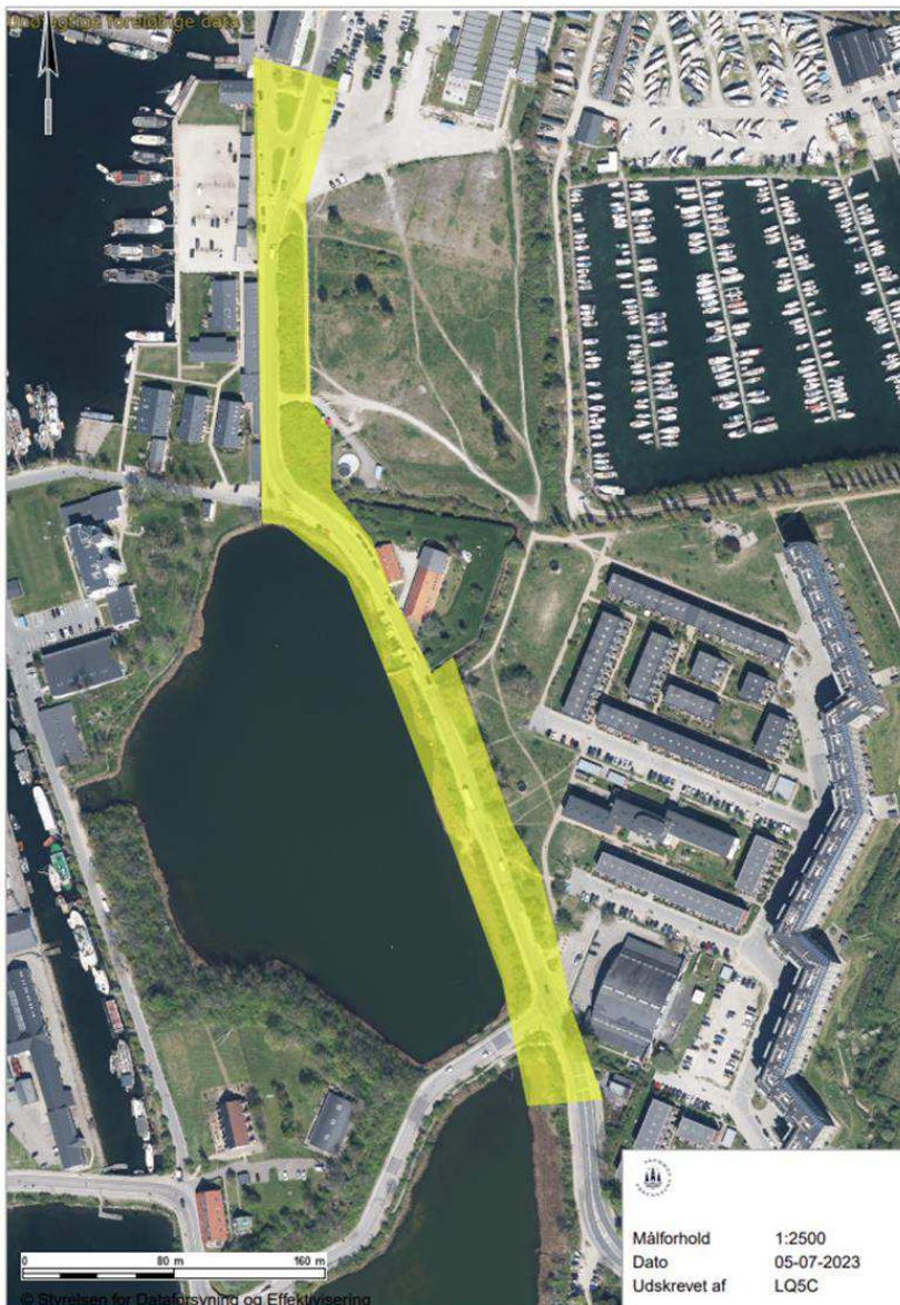
[Figur 2: Projektområdet ved opstart af projektet.]