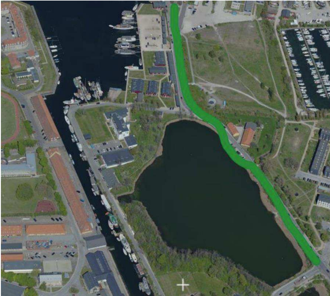
[Figur 1: Linjeføring der ønskes undersøgt.]