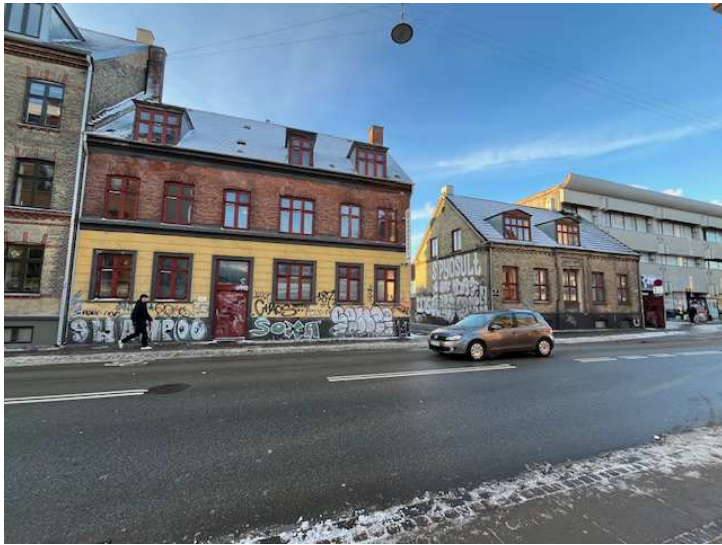
Nordre Fasan 273 til venstre i billedet og 275 til højre i billedet