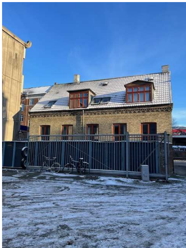
Nr. 275 set fra baggården