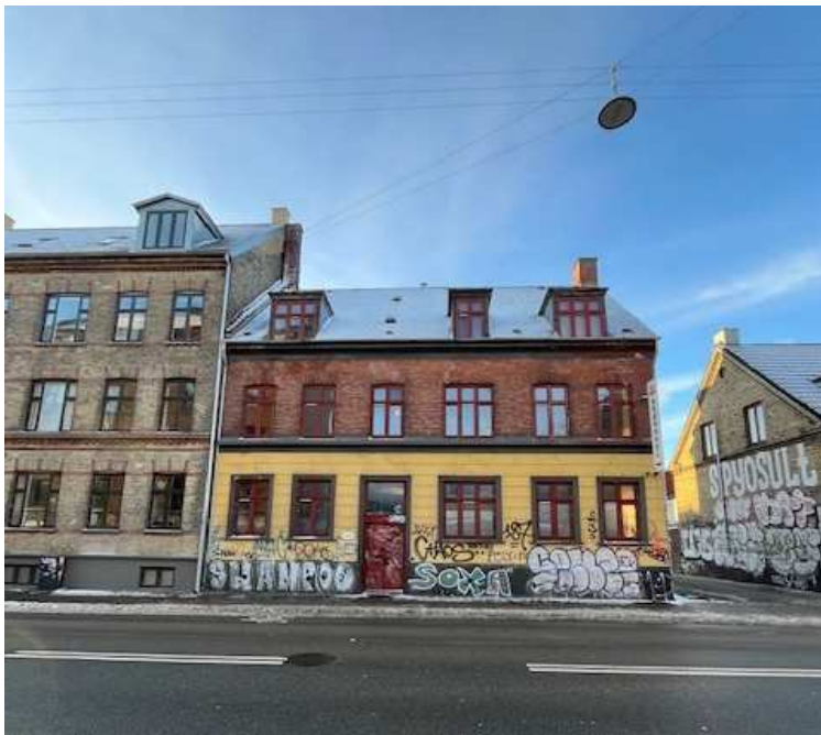
Nordre Fasanvej 273, forhus

Samlet bevaringsværdi: Forhuset vurderes til at være bevaringsværdigt ud fra ovennævnte arkitektonisk, miljømæssige og kulturhistoriske grunde, mens baghuset vurderes til at have en vis bevaringsværdi i det kulturhistoriske, men samlet i noget mindre grad.