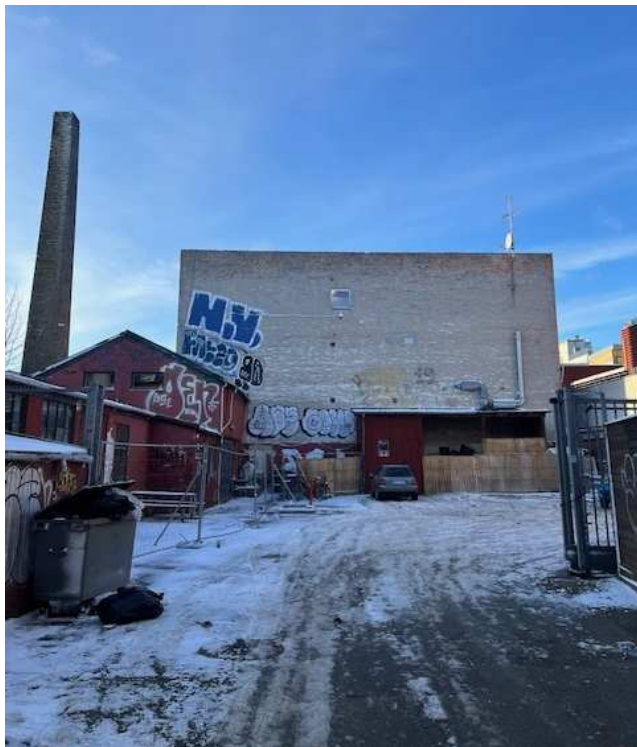
Fælles baggårdsmiljø med baghus, tilhørende skorsten og fritstående gavl