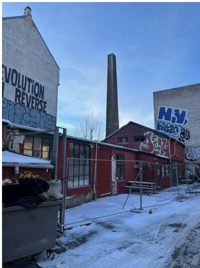
Nordre Fasanvej 273, baghus