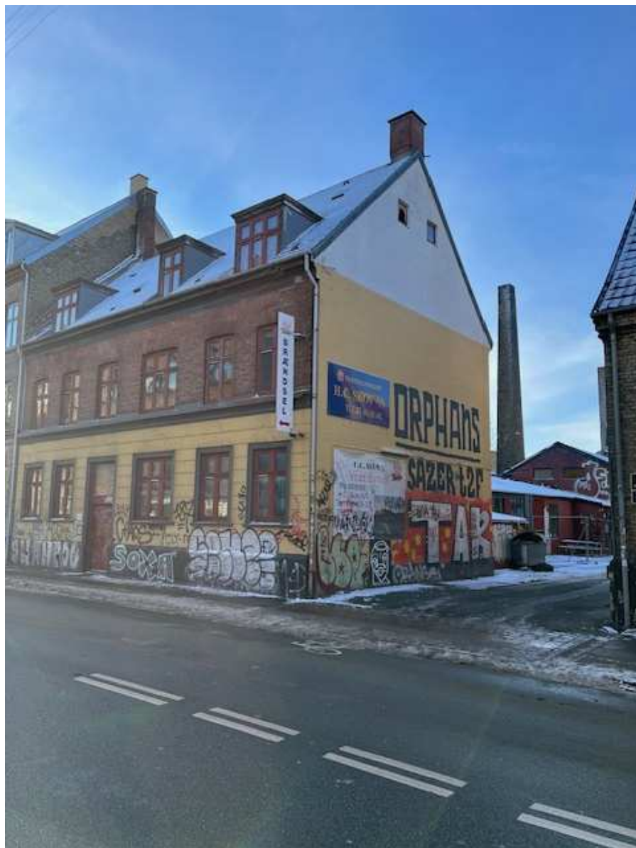
Kig fra Nordre Fasanvej