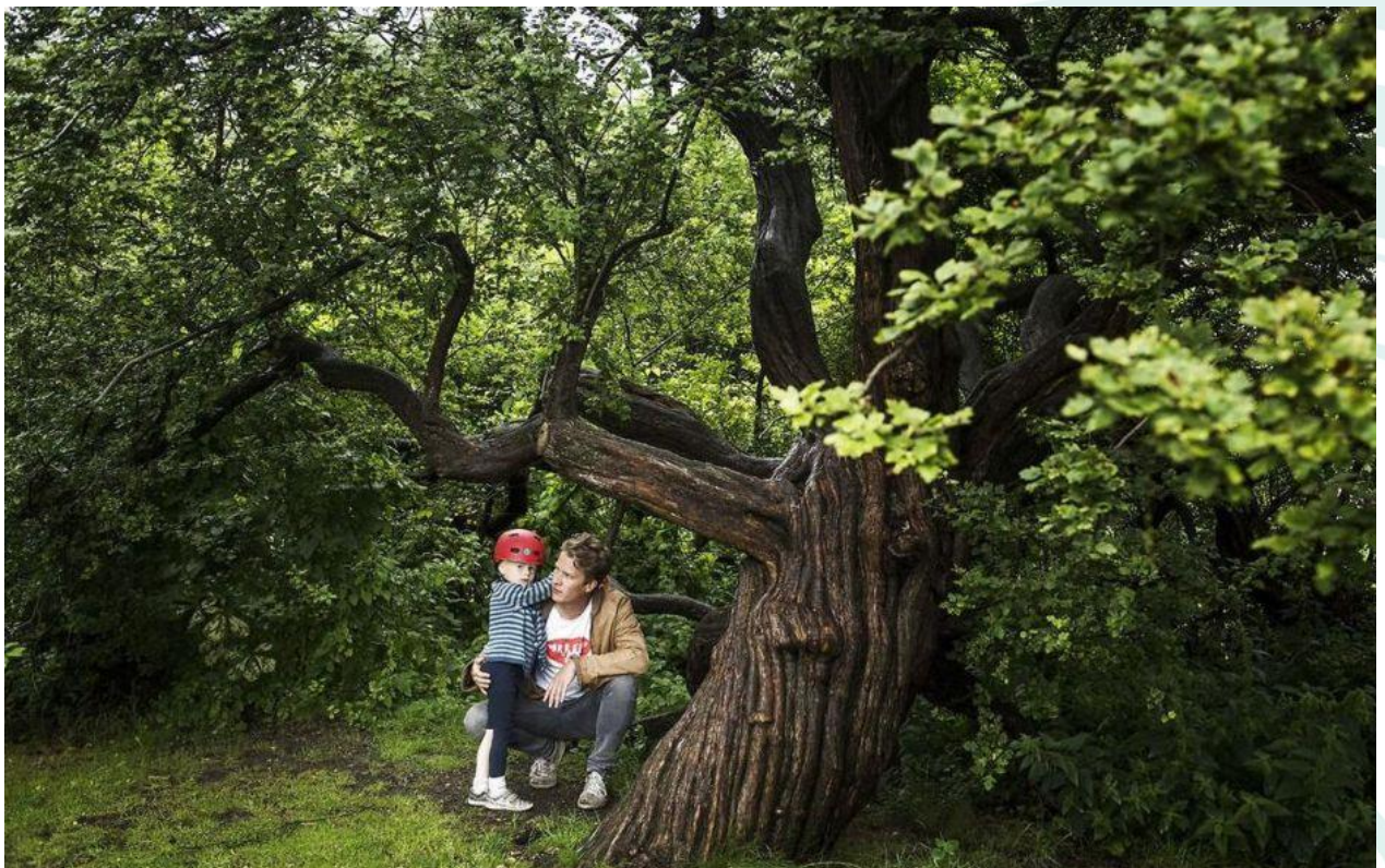
Nørrebros ældste træ - en Hvidtjørn på 'Nordpolen' i De Gamles By - har stået her siden før Nørrebro blev bebygget. Det planlagte diabetescenter skulle bygges her men flyttes i stedet til et andet byggefelt på Møllegade