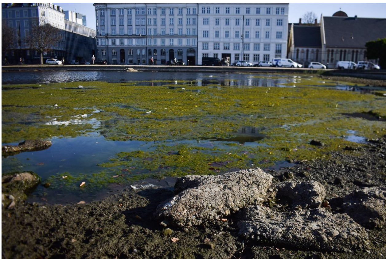
Tørke og hedebløge i København. Hedebløgen gave en overdødelighed på 250 ifølge Seruminstittet. Tørke og hede førte også til øget trædød og vandtab på 90.000 liter i timen fra Søerne // Romas Neniškis