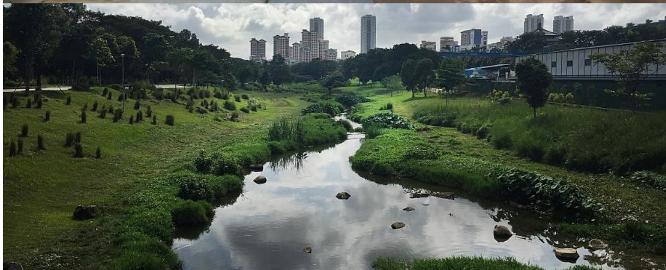
Singapore Bishan Park før og efter å/skybrudspark blev etableret. Dette kunne være en model for Bispeengen // klimatilpasning.dk