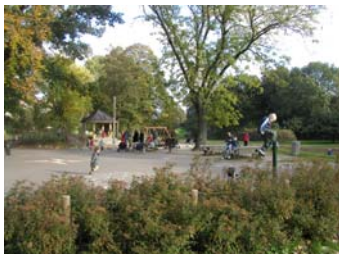
Nabokvarterernes børn i alle aldre har stor gavn af legearealerne i parkerne.