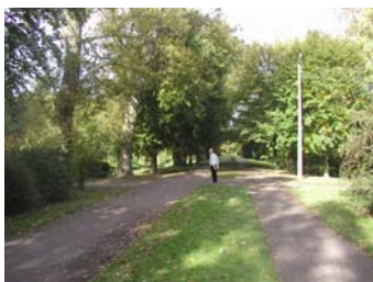
Parkernes gennemgående stier tilbyder en grøn og trafikikker rute for både cyklende og gående.