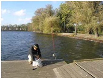
Damhussøen, med sin rolige flade, ligger som en stille oase i en ellers travl by.