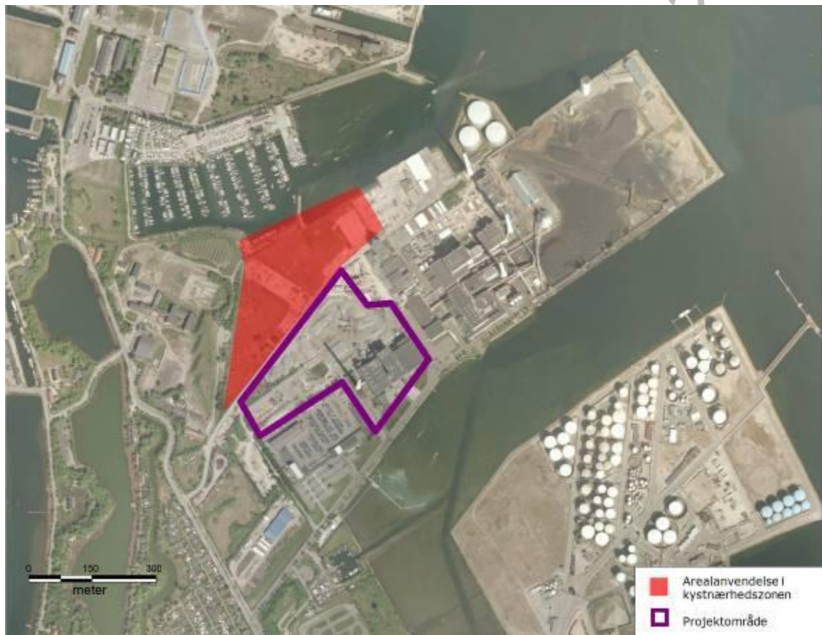
Figur 2 Kystnære arealer i byzonen og kystnærhedszonen. Alle de arealer, som ikke er markerede, er kystnære arealer i byzonen. Det røde areal i kystnærhedszonen ligger i landzone indtil det med Københavns Kommunes lokalplan for Kraftværkshalvøen overføres til byzone.

Projektområdet er inden for den kystnære del af byzonen: Det røde område på Figur 2, hvor en del af byggepladsen skal placeres, ligger i landzone og dermed også inden for kystnærhedszonen. Kystnærhedszonen er en planlægningszone, hvor der skal være særlige planlægningsmæssige og funktionelle behov for evt. etablering af bebyggelse.