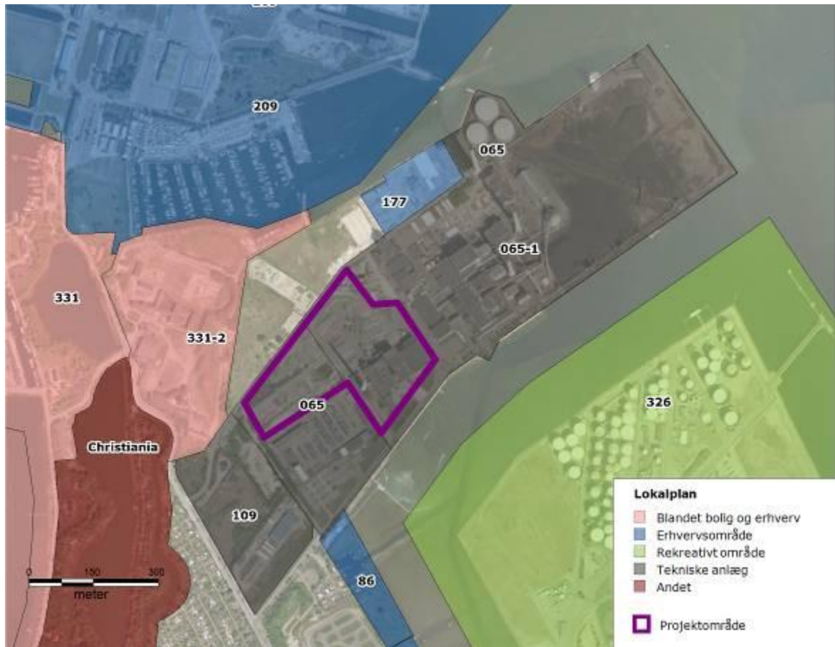
Figur 3 Lokalplaner ved Amagerforbrænding og dets omgivelser.