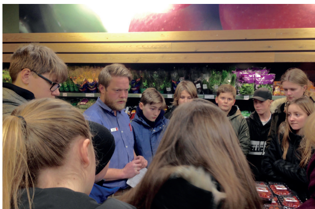
Bestyreren i SuperBrugsen fortæller 6. klasse fra Nyboder Skole om, hvordan de kan hjælpe butikken med at undgå madspild.