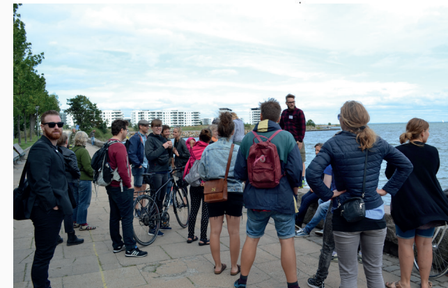
Østerbro er fuld af nære naturoplevelser - og tangen langs kysten er spiselig!