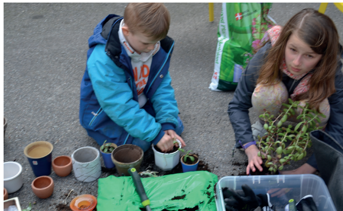
Planteworkshop og stiklingebytte til Grøn Dag i Miljøpunkt.