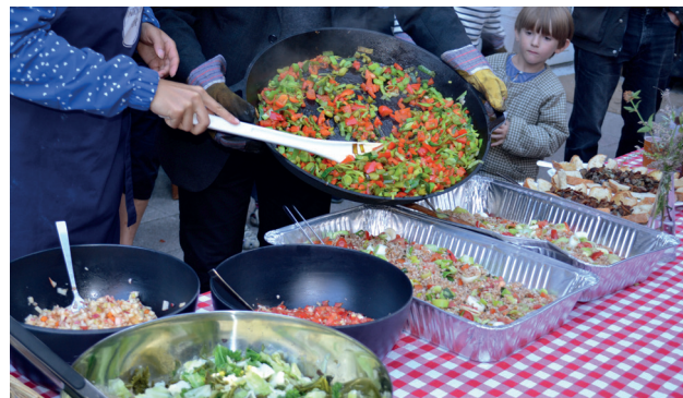
Østerbro bydelsret er serveret. Arrangement i samarbejde med Østerbro Lokaludvalg og FN Forbundet.