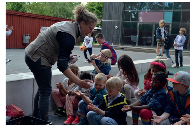
I 2016 har 1044 Østerbro-børn deltaget i undervisningsforløbet om madspild. Børnene mærker, dufter og smager på råvarerne for at vurdere, hvad der kan bruges, og finder på nye, velsmagende retter.