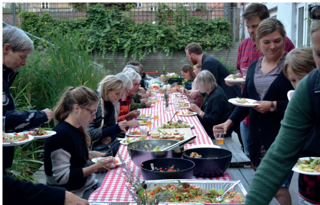
Fællesspisning i Miljøpunkt. Engagementet er stort hos de lokale borgere, når der skal hakkes skæres og ikke mindst spises bæredygtige retter.