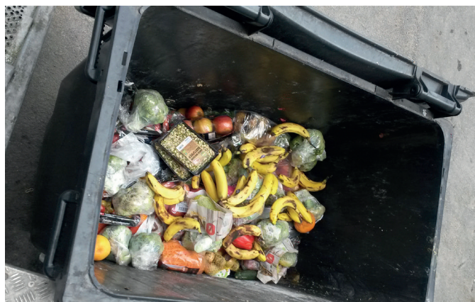
I 2016 har 9 lokale supermarkeder og 3 bagere skænket overskudsvarer til madlavning på skolerne i stedet for at smide dem i containeren.