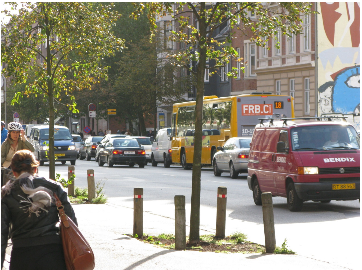
Figur 1. Jagtvej mellem Mimersgade og Nørrebro Runddel - torsdag kl. 1616.