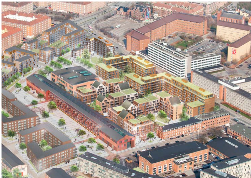
3-D luftperspektiv, der viser blandingen af nybyggeri og eksisterende industribygninger, der er ombygget til bolig og serviceerhverv, set fra sydvest mod Toftegårds Plads. Ved udformningen af nybyggeriet tages der udgangspunkt i samspillet med de gamle industribygninger. (Illustration: Arkitema).

anden side af vejen er vigtige. Det aflæses i bygningens udformning og materialitet, der signalerer en moderne bebyggelse med små raffinerede variationer.