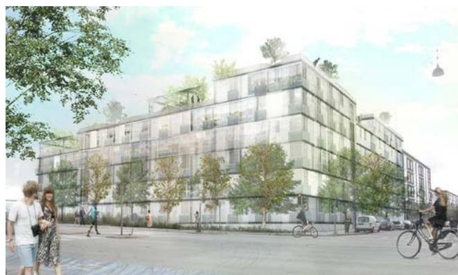
Eksempel på nybyggeri med ungdomsboliger ved Ib Schönbergs Allé. (Illustration: Vandkunsten).

I "Arkitekturby København" er det målet at fremme arkitektonisk og byggeteknisk kvalitet i et tidssvarende formsprog. Lokalplanens bestemmelser om udformning af bebyggelsen mod Vigerslev Allé fastholdes. Der fastlægges en ny udformning af bebyggelsen mellem den bevaringsværdige montagehal og Gammel Køge Landevej. Den samlede bebyggelse består af 4 åbne karreer i 3-6½ etager. Mod vejen opføres bebyggelsen som støjafskærmende randbebyggelse. Samspillet med områdets øvrige bebyggelser, både de bevaringsværdige industribygninger i rød tegl, og de mere differentierede randbebyggelser på den