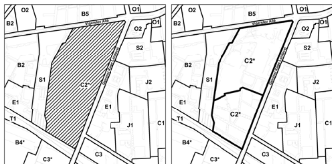
Eksisterende rammer i Kommuneplan 2011 og forslag til ændring.

Kommuneplantillæg er nødvendigt for at muliggøre det ønskede byggeri. Den eksisterende C2*-ramme for lokalplanens underområde II foreslås udskiftet med en C2*-ramme, der indebærer en bebyggelsesprocent på 150 samt friarealkrav på 40 pct. af boligetagearealet og 10 pct. af erhvervsetagearealet. Bestemmelserne om bygningshøjde, parkering og lavenergi er uændrede. *-bemærkningerne om boligandele på mindst 50 pct. og beregning af bebyggelsesprocenten for rammeområdet under ét er unødvendig, da de generelle rammer giver samme mulighed. For lokalplanens underområde I, der stort set er fuldt udbygget, fastholdes C2*-rammen. Der ændres ikke ved retningslinjerne for detailhandel.