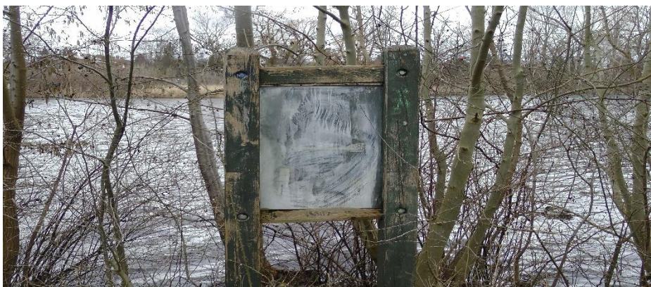
Mange skilte ved Utterslev Mose har kendt bedre dage

Udgiften hertil er af forvaltningen beregnet til 360 000 kr. Det 200 000 kr. er allerede finansieret. Det kunne være praktisk at få alle skiltene opstillet samtidig. Der foreslås derfor disponeret yderligere 160 000 kr. hertil via overførelsessagen.