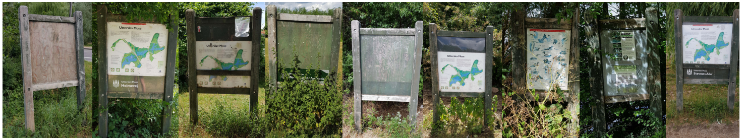
Et repræsentativt udsnit af eksisterende højskilte i Utterslev mose