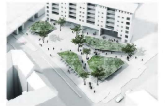
3. Overdækket torv med grønne svævede overdækninger

I en tredje løsning ændres fladerne og bakkerne til overdækkede pavilloner, der kan bruges til cykelparkering, ophold, cafeer eller en mere permanent basar, som Basargrunden har været tidligere.