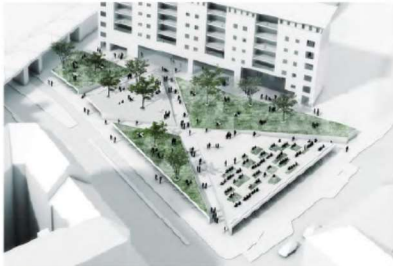
1. Bydeless torv med hældende flader til ophold og cykelparkering