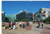
Reference på stor plads

Der har blandt borgere og brugere af byrummene på Nørrebro og Nordvest, været et klart ønske om, at beholde Basargrunden, som det store åbne areal, byens torv. Det skal være stedet, hvor der er plads til loppemarked, basar eller større kulturelle events. Men den store åbne plads har også sin udfordring: hvordan afskærmes det for trafikken, hvordan ledes de bløde trafikanter over pladsen, og hvordan sørger vi for, at det ikke bliver et stort rod af cykelparkering?