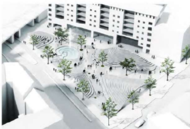
2. Landskabsstorvet med bakker og cykelparkering under 'bakkerne'