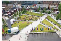
Reference på stor plads