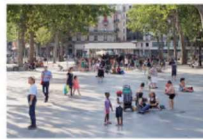
Reference på stor plads