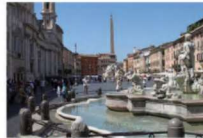
Reference på stor plads