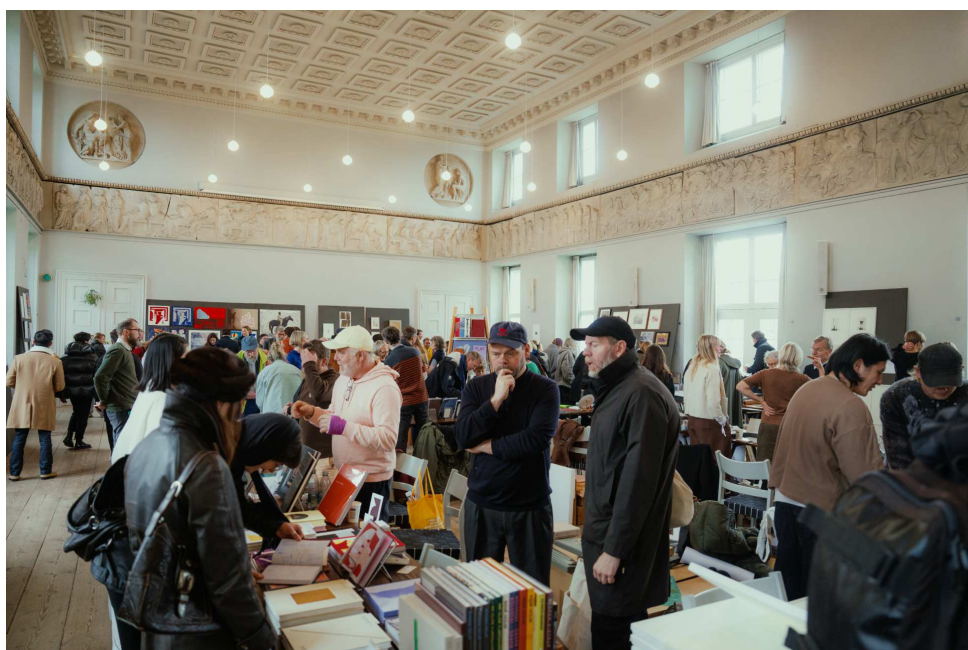
CHART Book & Print Fair 2025.

Publikum spænder bredt i aldersgruppe og baggrund, hvilket afspejler eventets ambition om at tiltrække et alsidigt publikum, der er både engageret, nysgerrigt og interesseret i kunst- og kultur. Publikum kan opleve udgivelser helt tæt på, deltage i oplæg og oplæsninger, og gå på opdagelse i feltet af kunstbogproduktioner og kunstprint. For mange kan dette være det første skridt ind i kunstens verden. En kunstbog eller tryk er mere tilgængeligt end det unikke kunstværk, men med samme kunstneriske tyngde. Netop derfor er det vigtigt at favne mikroforlagene give dem en plads, og vise publikum en demokratisering af kunsten. Eventet åbner kunstfeltet og skaber deltagelse på tværs af alder, baggrund og økonomi. Det inviterer den brede befolkning ind i et fællesskab omkring kunst og refleksion. Vores intention er, at CHART Book & Print Fair ikke kun er for en niche branche – den er for byen, for borgerne og for næste generation af kunst- læsere, -skabere og -elskere.