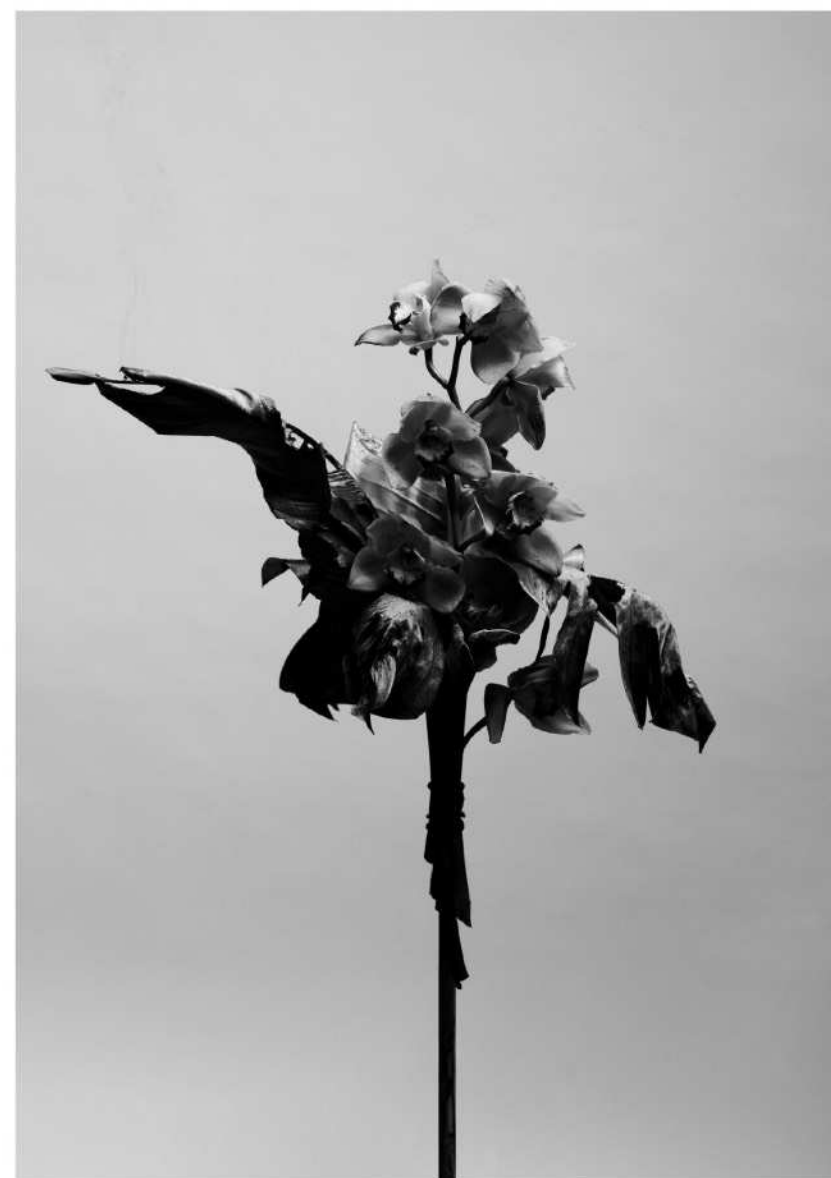
under asken findes gløder