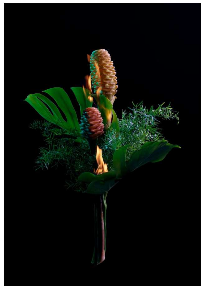
under asken findes gløder