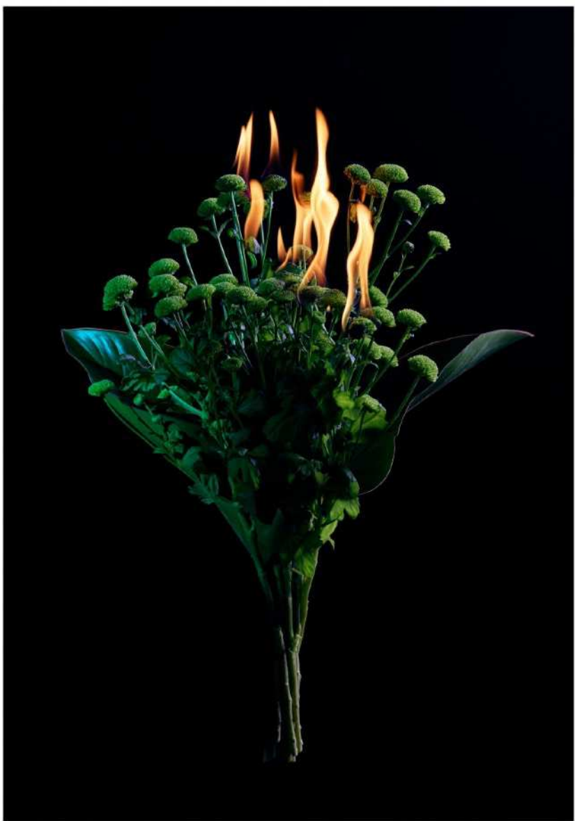
under asken findes gløder