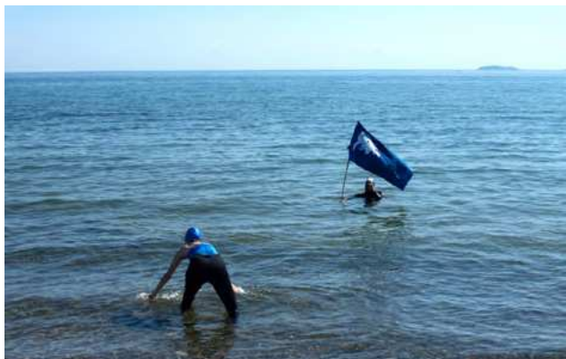
J&K, Ursuppen, water research on boat and in ocean, performance on shore, 1h, Svartlöga and Den Grænseløse Festival, 2022