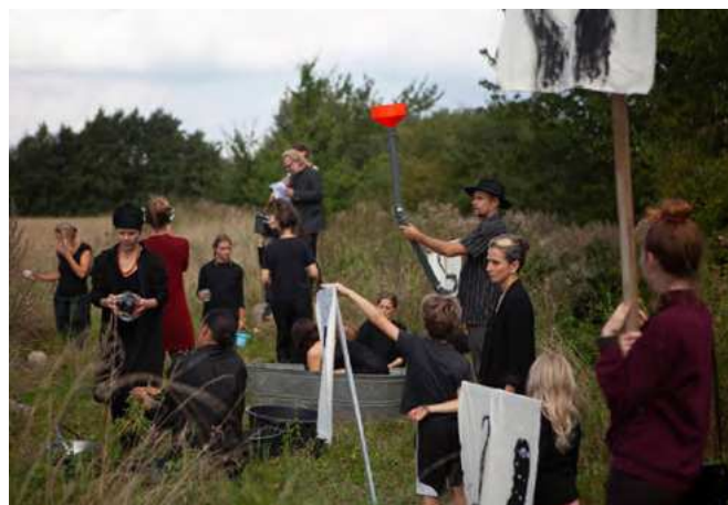
J&K, The Tale of The Black Water Snake, walk and participatory water cleaning ritual, performance, PDAS Biennial - Stofskifte, 2020