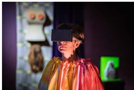
J&K, The Emancipation of O.O.O., mixed media installation, various sizes and performance, 1h, Overgaden, 2017, Foto: M. Vejerslev