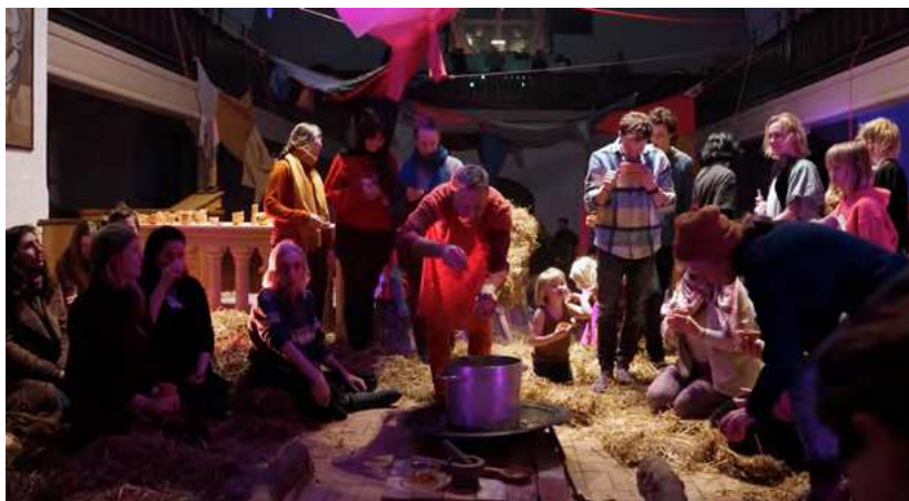
J&K, Kin Matter – Ritual Practice V, mixed media installation, variable size and performance, 2 h, The Maria Project, Copenhagen, 2022