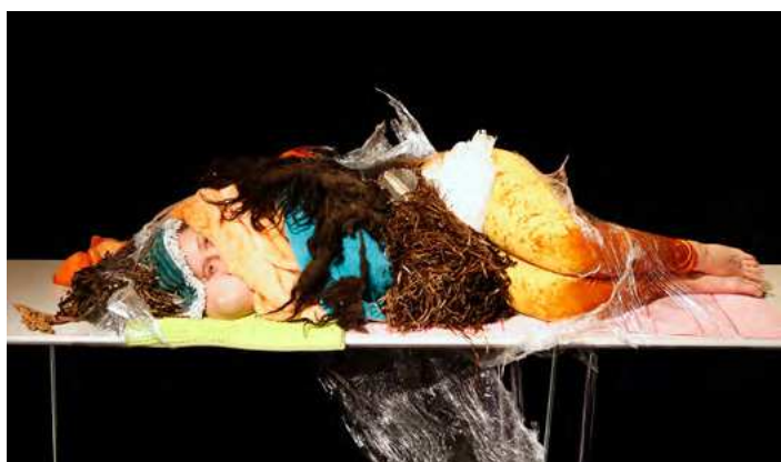
J&K, We, performance-installation, 15h, Inkonst, Malmø, 2020