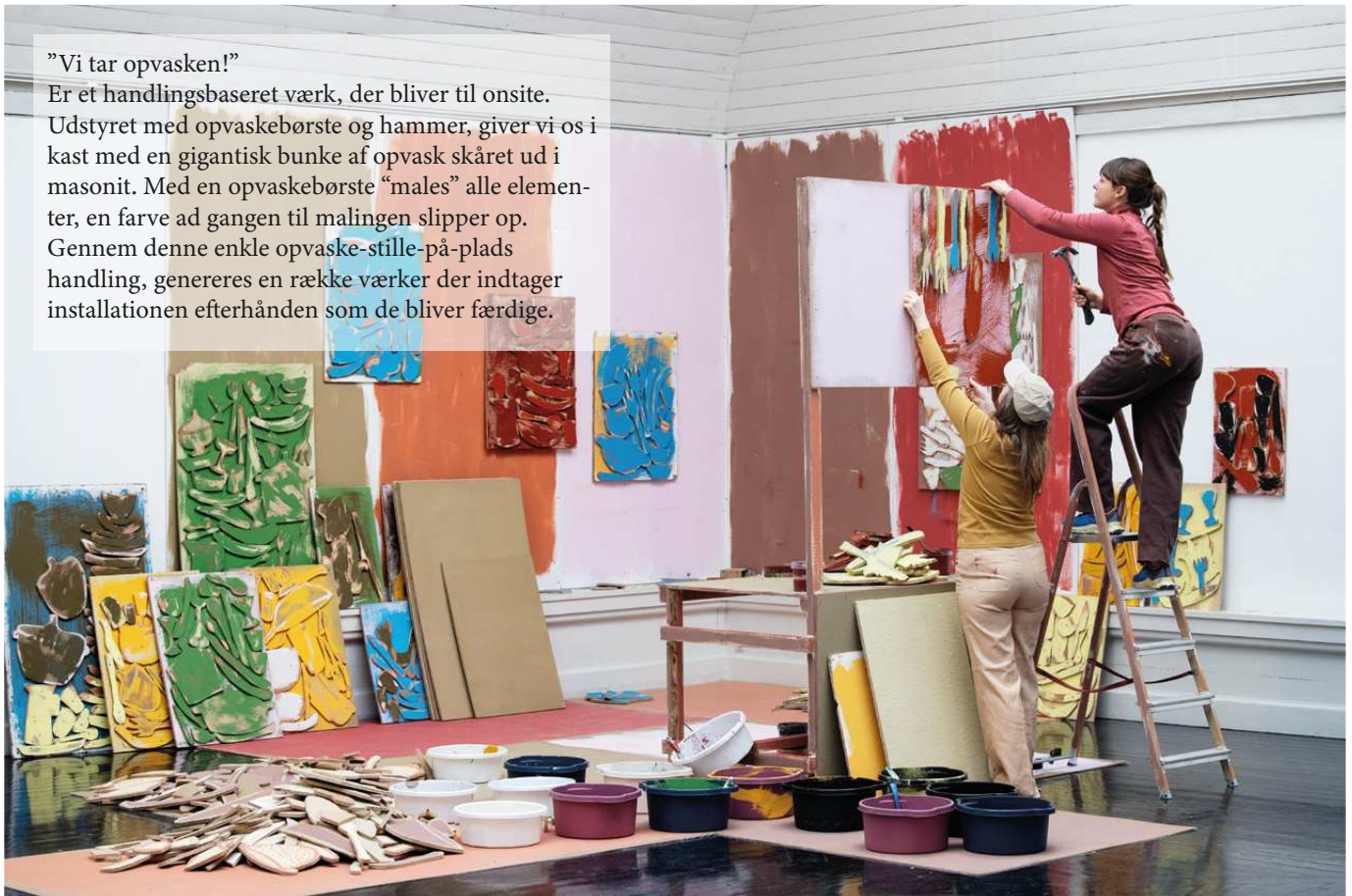
VI TAR OPVASKEN!/ Decembristerne/ Den Frie Udstillingsbygning/ København 2020/ INSTALLATION/ PERFORMANCE/ MALERI/ blød masonit/ opvaskebaljer/ opvaskebørster/ hammer/ søm/ lermaling/silikatmaling/ lægter/ foto: Frida Gregersen

Er et handlingsbaseret værk, der bliver til onsite. Udstyret med opvaskebørste og hammer, giver vi os i kast med en gigantisk bunke af opvask skåret ud i masonit. Med en opvaskebørste “males” alle elementer, en farve ad gangen til malingen slipper op. Gennem denne enkle opvaske-stille-på-plads handling, genereres en række værker der indtager installationen efterhånden som de bliver færdige.