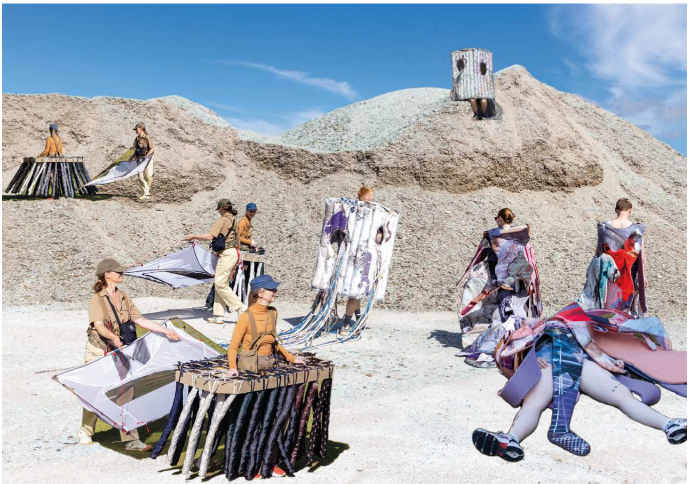
SNAVS/ (kost og fejebakke), (vasketøjsbunke og vaskemaskine)/ Plakat fra PARADE Næstved Havn - Ronnesbækholm/ 2022/ PERFORMANCE, SKULPTUR/ genbrugstøj, vinyl, afløbsslanger, ledninger, telt, klatreseler, foerstof, majsfyld, cns-fræset krydsfinér, printet polyester, mm