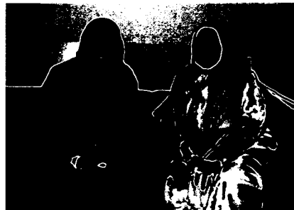
FESTKLÆDTE KVINDER TIL IKC's EID UL-FITR FEST

Bestyrelsen og ledelsen håber også fremover, at det vil lykkes at bevare centret, så IKC fortsat kan være med til at gøre Danmark til et bedre land at leve i.