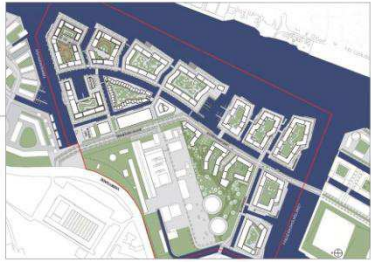
Udkast til bebyggelsesplan 2012